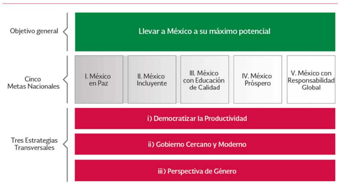
FIGURA I.1. ESQUEMA DEL PLAN NACIONAL DE DESARROLLO 2013-2018.

El Plan Nacional de Desarrollo destaca la importancia de acelerar el crecimiento económico para construir un México Próspero . Detalla el camino para impulsar a las pequeñas y medianas empresas, así como para promover la generación de empleos. También ubica el desarrollo de la infraestructura como pieza clave para incrementar la competitividad de la nación entera. Asimismo, identifica las fortalezas de México para detonar el crecimiento sostenido y sustentable, con el objeto de hacer que nuestro país se convierta en una potencia Económica emergente.