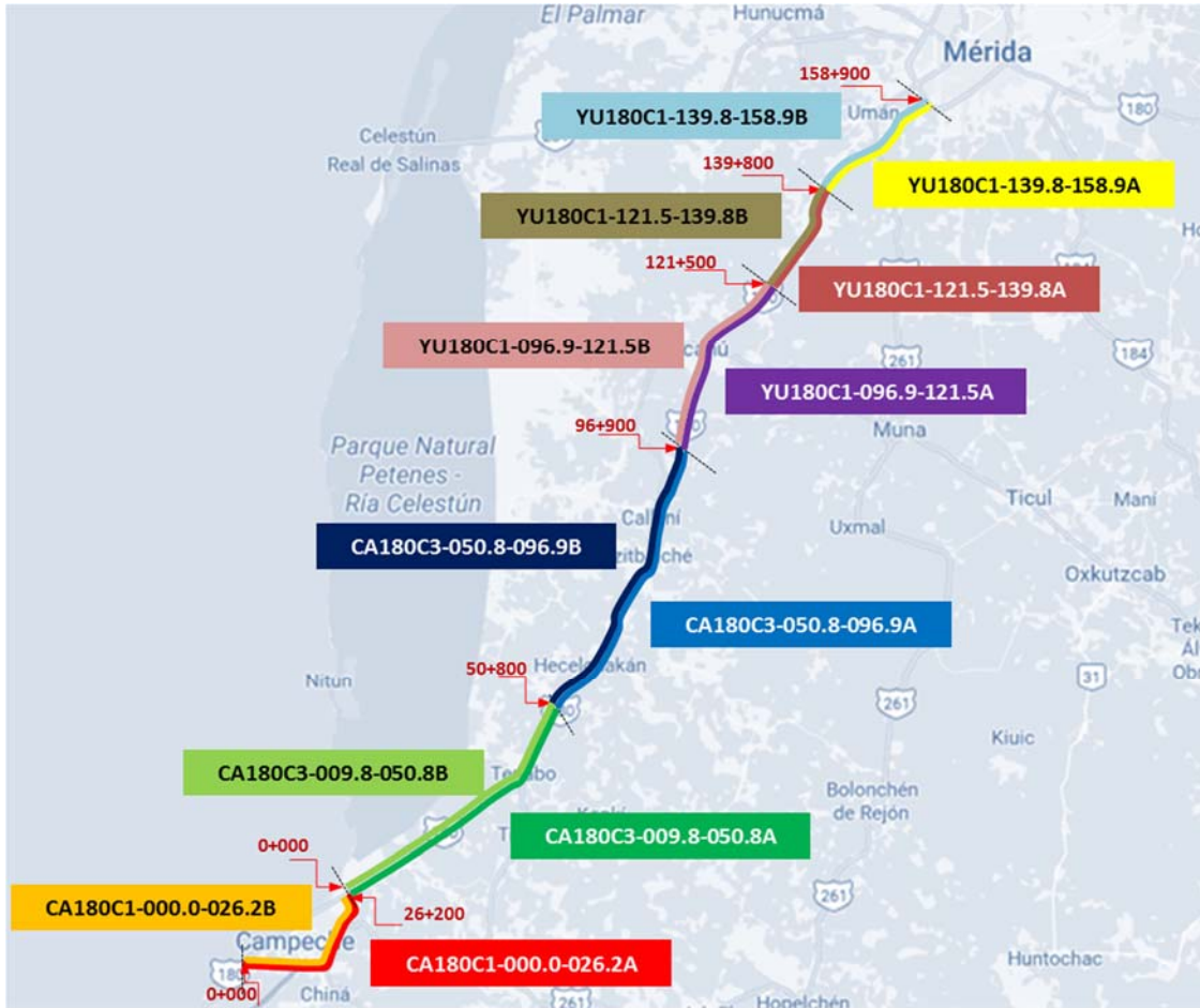
Figura 2. Croquis de segmentación del tramo carretero.