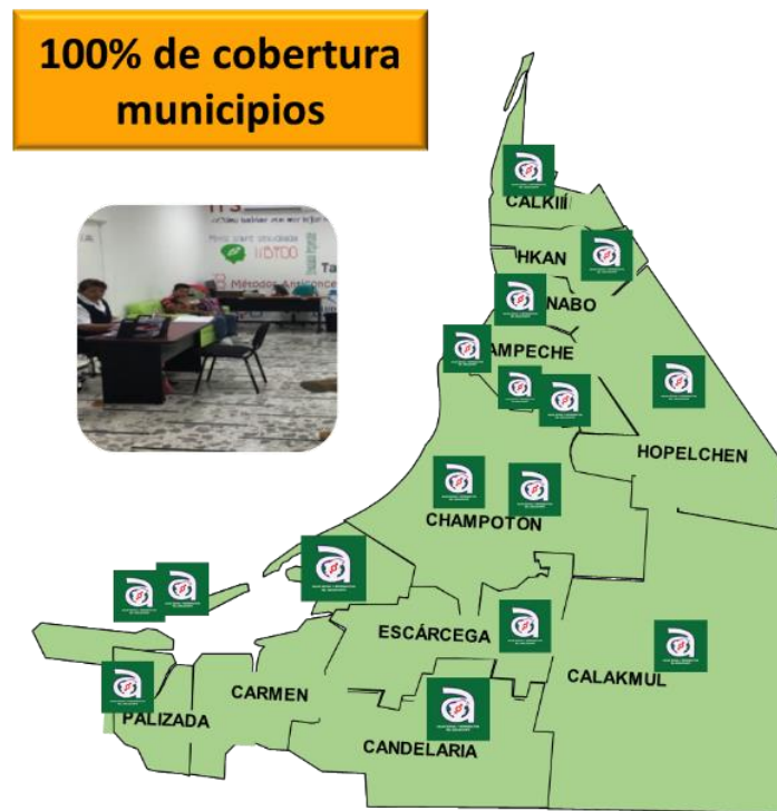
Gráfica 1. Número de Servicios Amigables para Adolescentes en la Secretaría de Salud, 2018

Mediante esta red de Servicios Amigables, la población adolescente tiene acceso a un Paquete Básico de Servicios de Salud Sexual y Reproductiva en el 100% de los municipios del estado.