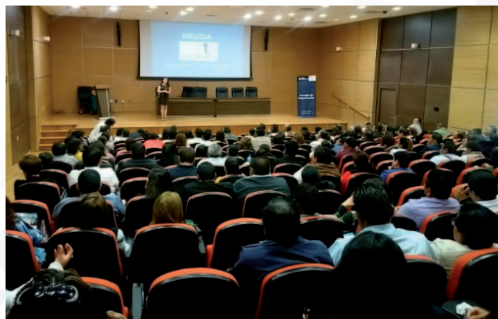
* Impartimos el curso de “Hacienda Pública Municipal” a funcionarios de los ayuntamientos de Hidalgo.

12. Impartimos el curso de capacitación “Hacienda Pública Municipal” a funcionarios de los ayuntamientos del estado de Hidalgo, con el objetivo de ayudarles a identificar las herramientas que les permitan mejorar el manejo de sus recursos, así como a identificar las oportunidades de obtener apoyos y subsidios para el desarrollo de sus acciones de gobierno.