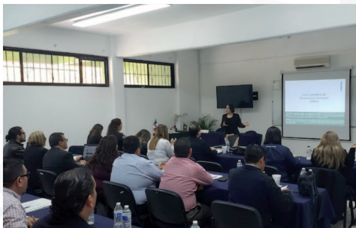
* Jornada de capacitación en Baja California.

6. Realizamos una jornada de capacitación para funcionarios del estado de Baja California, con el fin de fortalecer sus capacidades, habilidades y conocimientos, en favor de mejores administraciones públicas. Durante esta jornada de capacitación, presentamos la Guía Consultiva de Desempeño Municipal e impartimos el taller sobre "Entrega Recepción".