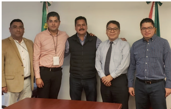
* Reunión con el Alcalde del municipio de Yauhquemehcan, Francisco Villarreal.

4. Nos reunimos con el Alcalde del municipio de Yauhquemehcan, Tlaxcala y presidente de la Conferencia de Alcaldes tlaxcaltecas, Francisco Villarreal, con el objetivo de fortalecer lazos de colaboración en favor del desarrollo municipal.