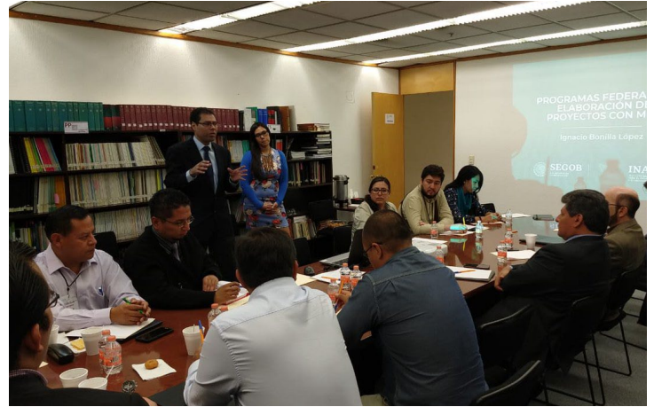
* Brindamos capacitación a servidores públicos de Tlalnepantla de Baz.

16. Brindamos capacitación a servidores públicos de Tlalnepantla de Baz, Estado de México, sobre Identificación de Proyectos bajo la Metodología del Marco Lógico y Programas Federales, para utilizarla en la planeación municipal en aspectos como: Elaboración de Proyectos, Elaboración del Plan de Desarrollo Municipal y Elaboración del Presupuesto Basado en Resultados.