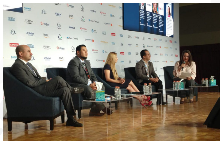
* Foro de Alcaldes 2019, panel de "Seguridad".

3. Participamos en el Foro de Alcaldes 2019, en el panel de "Seguridad", con el objetivo de compartir la visión del Instituto, de cómo pueden los municipios innovar en materia de seguridad y adoptar prácticas y soluciones que garanticen la disminución del delito.