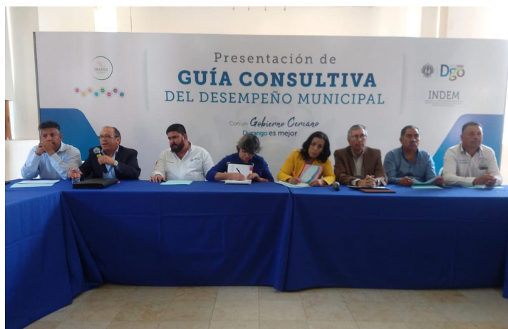
* Presentación de la Guía Consultiva de Desempeño Municipal en Durango.

6. Realizamos una jornada de capacitación para funcionarios del estado de Baja California, con el fin de fortalecer sus capacidades, habilidades y conocimientos, en favor de mejores administraciones públicas. Durante esta jornada de capacitación, presentamos la Guía Consultiva de Desempeño Municipal e impartimos el taller sobre "Entrega Recepción".