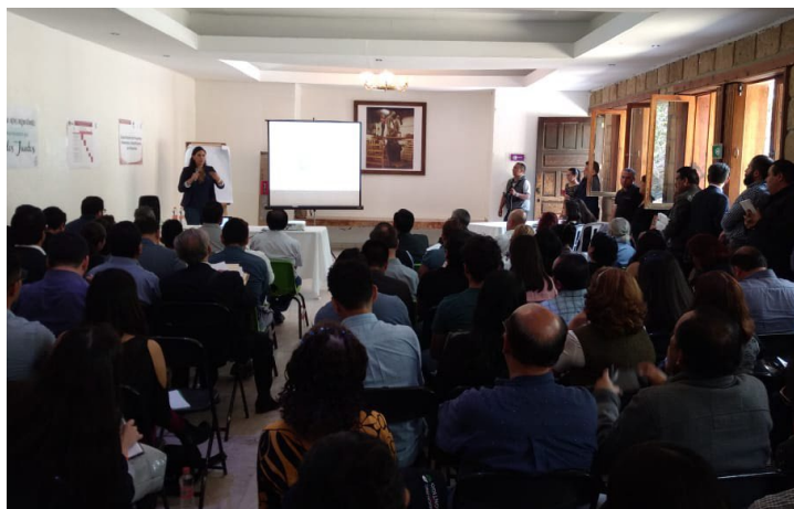
* Talleres de capacitación en Cuautitlán Izcalli.

9. El Coordinador del INAFED, Rafael Cortés, se reunió con los exgobernadores de Puebla, José Antonio Gali Fayad y Oaxaca, Diódoro Carrasco Altamirano, con la finalidad de que este Instituto participe en el Smart City LATAM, que se llevará a cabo del 2 al 4 de julio de este año, en el estado de Puebla, para impulsar el desarrollo del municipio, de las ciudades y los territorios.