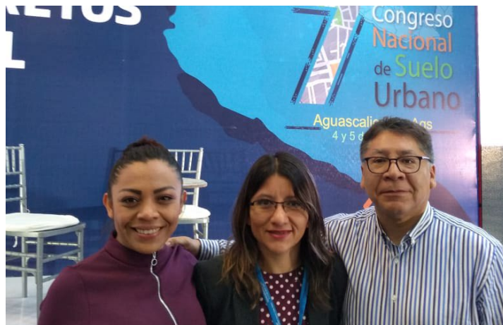
* 7° Congreso de Suelo Urbano en Aguascalientes.

7. Durante el 7° Congreso de Suelo Urbano, que se realizó en el estado de Aguascalientes, participamos en el panel “El Municipio ante la Nueva Política Pública”, con el objetivo de construir propuestas orientadas al ordenamiento y futuro de nuestro territorio nacional.