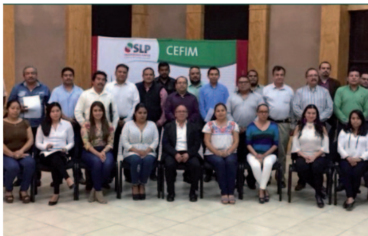
* Presentamos la Guía Consultiva de Desempeño Municipal en San Luis Potosí.

12. Impartimos el curso de capacitación “Hacienda Pública Municipal” a funcionarios de los ayuntamientos del estado de Hidalgo, con el objetivo de ayudarles a identificar las herramientas que les permitan mejorar el manejo de sus recursos, así como a identificar las oportunidades de obtener apoyos y subsidios para el desarrollo de sus acciones de gobierno.