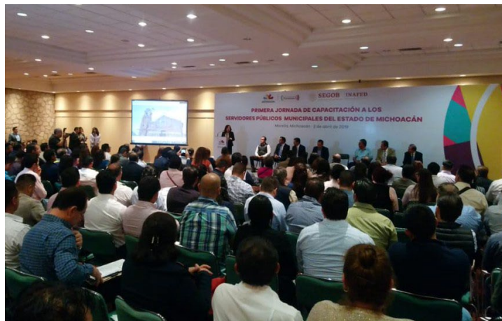
* Jornada de Capacitación en Michoacán.

1. Con el objetivo de dar a conocer la nueva visión institucional, los programas y servicios, así como la Guía Consultiva de Desempeño Municipal, herramientas enfocadas al fortalecimiento de los gobiernos locales, participamos en la "Primera Jornada de Capacitación a Servidores Públicos Municipales" en el estado de Michoacán.