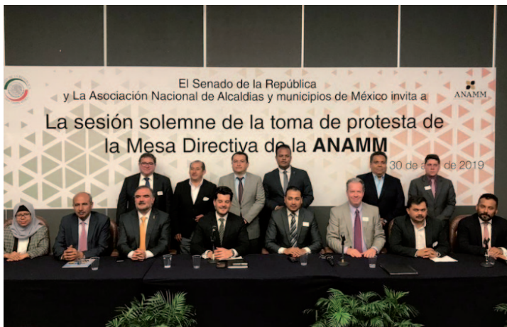
* Toma de la Mesa Directiva de la nueva asociación de municipios ANAMM.