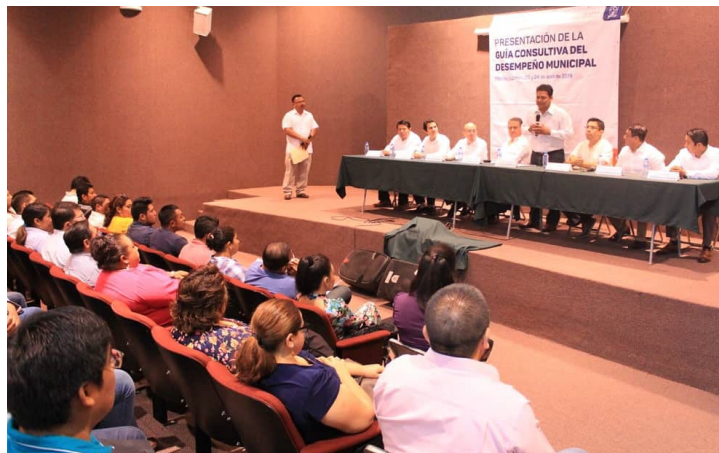
* Presentamos la Guía Consultiva de Desempeño Municipal a los 106 municipios de Yucatán.

13. A fin de contribuir al fortalecimiento de la gestión municipal, presentamos la Guía Consultiva de Desempeño Municipal a los 106 municipios del estado de Yucatán, herramienta del INAFED que busca mejorar y consolidar las capacidades institucionales de las administraciones públicas.