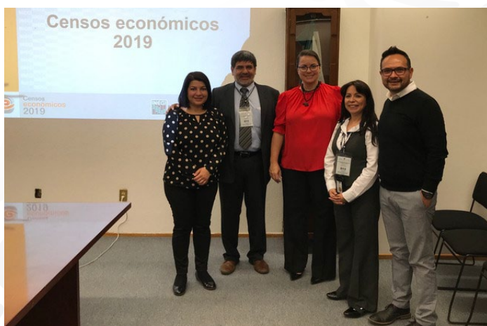
* Reunión con INEGI.

12. En el marco del levantamiento de los Censos Económicos 2019, el INAFED se reunió con personal del Instituto Nacional de Estadística y Geografía (INEGI), con el objetivo difundir la importancia para los municipios, de la información que se recoge en estas encuestas.