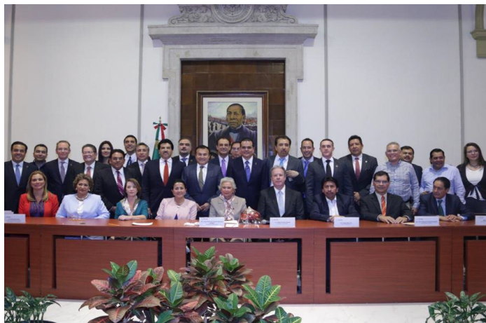
* Reunión con Asociaciones Nacionales de Municipios.