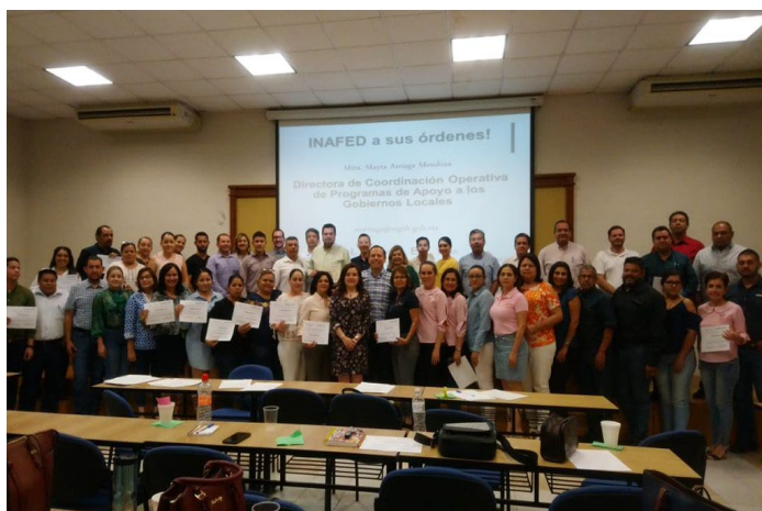
* Jornada de Capacitación en el estado de Colima.

12. En el marco del levantamiento de los Censos Económicos 2019, el INAFED se reunió con personal del Instituto Nacional de Estadística y Geografía (INEGI), con el objetivo difundir la importancia para los municipios, de la información que se recoge en estas encuestas.