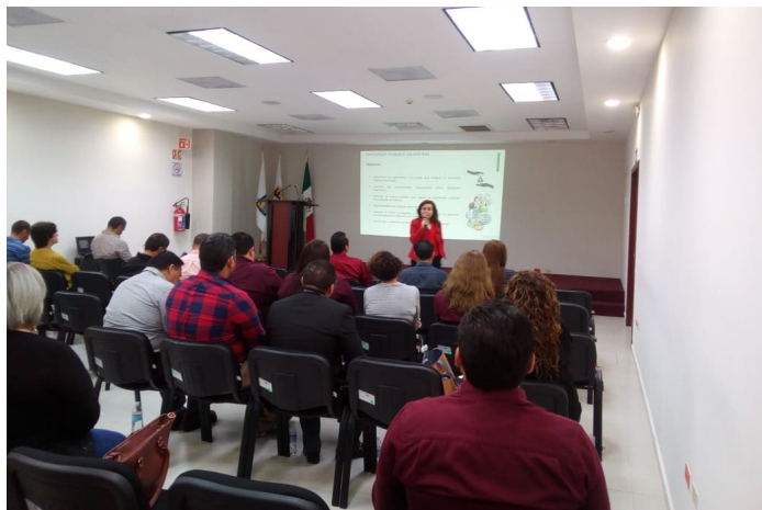
* Jornada de Capacitación en el estado de Sonora.

10. Durante la “Primera Jornada de Capacitación a Servidores Públicos Municipales del estado de Sonora”, el INAFED impartió los cursos sobre “Gobierno y Administración Pública Municipal”, “Transparencia y Rendición de Cuentas”, “Reglamentación Municipal”, “Competencia del Secretario del Ayuntamiento”, “Hacienda Pública Municipal” y “Elaboración del PBR”, esto con la intención de fortalecer, a través de la capacitación, la gestión municipal en el estado.