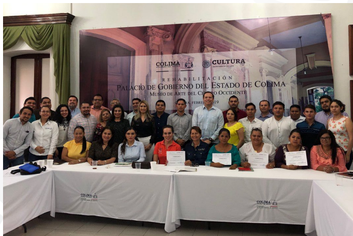
* Taller sobre la Guía Consultiva de Desempeño Municipal en Colima.

24. En colaboración con la Coordinación Estatal de Desarrollo Municipal de Colima realizamos el Taller sobre la Guía Consultiva de Desempeño Municipal la cual busca mejorar y consolidar las capacidades institucionales de las administraciones publicas municipales.