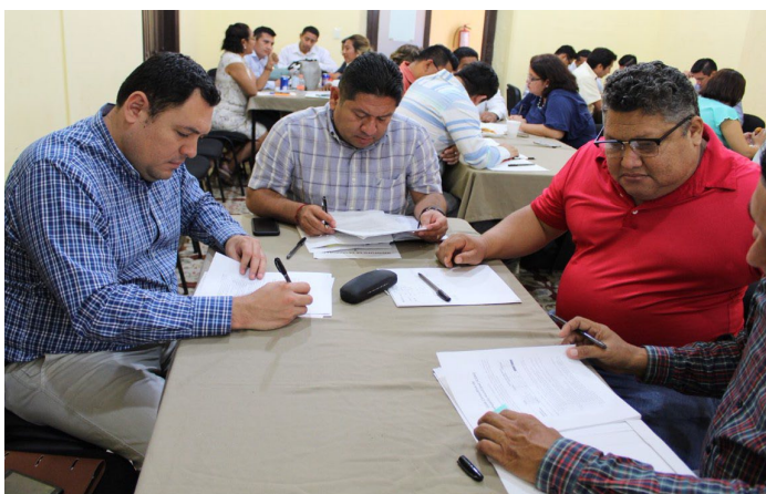
* Jornada de Capacitación en el estado de Campeche.

26. Presentamos a servidores públicos de los 11 municipios del estado de Campeche, la Guía Consultiva de Desempeño Municipal, que impulsa las mejores prácticas y promueve la cultura de la evaluación para lograr mejores resultados en las administraciones de los ayuntamientos.