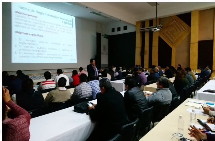
* Jornada de Capacitación en el estado de San Luis Potosí.

3. Participamos en la “Primer Jornada de Capacitación a Servidores Públicos Municipales del estado de San Luis Potosí”. En el evento se contó con la presencia de 12 alcaldes y 153 servidores públicos de los 58 municipios de esa entidad, a los cuales se les impartieron los temas: Reglamentación, Hacienda Pública y Diseño de Indicadores para la Evaluación de la Gestión Municipal, con el objetivo de coadyuvar a los municipios a alcanzar resultados positivos en el desempeño de su gestión.