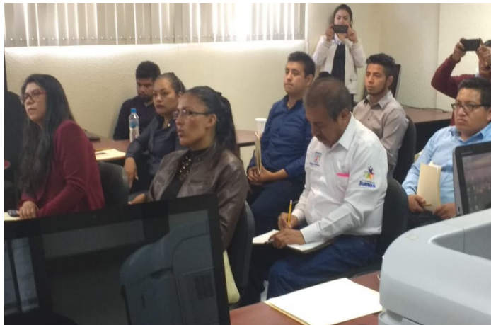
* Presentación de la GDM en Tlaxcala.

1. Con el objetivo de mejorar y consolidar las capacidades institucionales de las administraciones públicas locales, el INAFED presentó la nueva “Guía Consultiva de Desempeño Municipal”, a servidores públicos de los ayuntamientos de Tlaxcala, misma que busca promover la cultura de la evaluación de la gestión para dar mejores resultados en beneficio de la población.