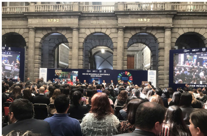
* Lanzamiento de la Red de Soluciones de Desarrollo Sostenible.

7. Con el propósito de impulsar a nivel municipal el cumplimiento de los Objetivos de Desarrollo Sostenible (ODS) de la Agenda 2030, el INAFED participó en el Lanzamiento de la Red de Soluciones de Desarrollo Sostenible, que será liderada por la Universidad Nacional Autónoma de México y el Tecnológico de Monterrey, Red que busca movilizar todo el talento contenido en la sociedad, como el sector público y privado y la academia, con miras al cumplimiento de los ODS.