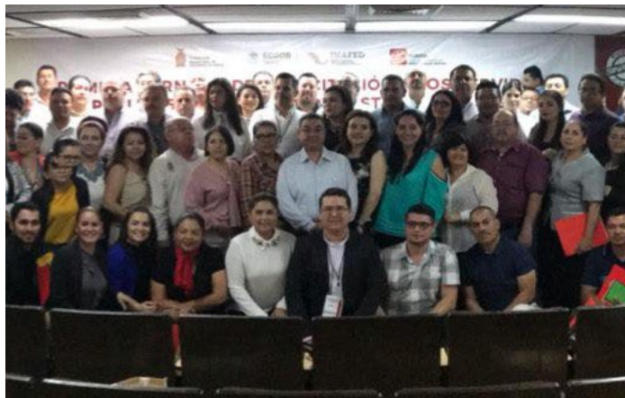
* Jornada de Capacitación en el estado de Sinaloa.

19. Llevamos a cabo la “Primera Jornada de Capacitación a Servidores Públicos Municipales en el estado de Sinaloa”, con el objetivo de apoyar en el desarrollo de sus conocimientos, habilidades y aptitudes para fortalecer las capacidades institucionales de sus gobiernos locales, a través de la capacitación en materia de Hacienda Pública Municipal y Rendición de Cuentas. Asimismo, presentamos la Guía Consultiva de Desempeño Municipal que impulsa la cultura de autoevaluación.