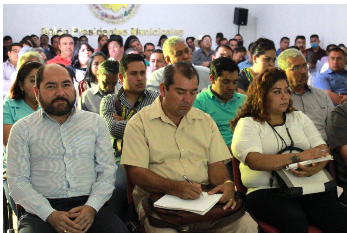
* Jornada de Capacitación en el estado de Morelos.

25. Impartimos capacitación sobre la Guía Consultiva de Desempeño Municipal a Servidores Públicos de los ayuntamientos del estado de Morelos que ayudará a los municipios en su primer año de gobierno e impulsará las buenas prácticas y promover una cultura de evaluación.