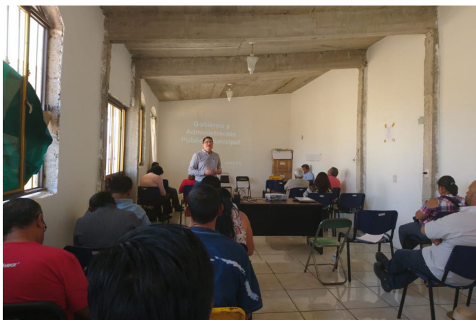
* Jornada de Capacitación en el estado de Oaxaca.

17. Durante la “Primera Jornada de Capacitación a Servidores Públicos Municipales del estado de Oaxaca”, el INAFED impartió el curso de Gobierno y Administración Pública Municipal y presentó la Guía Consultiva de Desempeño Municipal, con la finalidad de contribuir a la formación de ayuntamientos más sólidos que permitan ofrecer mejores servicios y mejores resultados a sus comunidades.