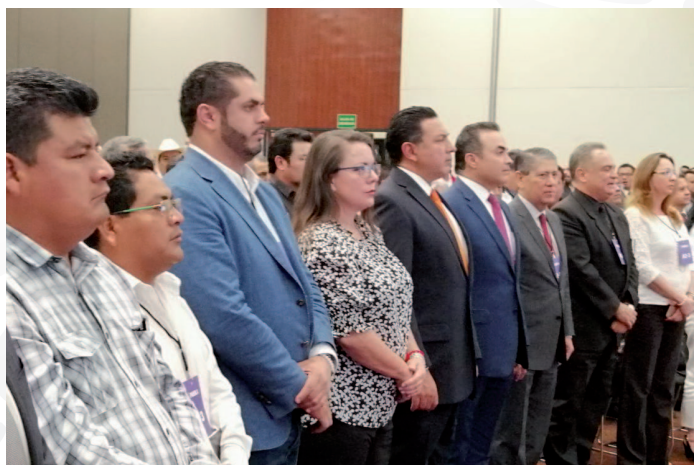
* Jornada de Capacitación en el estado de Puebla.

21. En la “Primera Sesión Ordinaria de la Asamblea Plenaria del Comité de Planeación para el Desarrollo del Estado de Puebla”, presidida por el gobernador de esa entidad, Guillermo Pacheco Pulido, presentamos a los 217 municipios participantes la oferta de los servicios institucionales con los que se cuenta, a través de los cuales se busca mejorar y consolidar las capacidades municipales de las administraciones públicas locales.