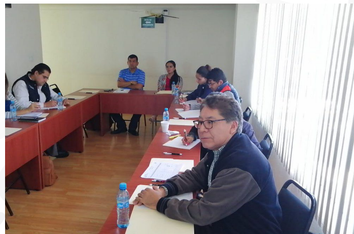
* Mesa de Trabajo en Hidalgo para Consolidar el Modelo Operativo de la GDM.

6. Sostuvimos reunión con el Instituto Hidalguense para el Desarrollo Municipal, Instituciones de Educación Superior, así como con autoridades estatales y municipales del estado de Hidalgo para consolidar el Modelo Operativo de la Guía Consultiva de Desempeño. Cabe destacar que, los participantes nos apoyaron con su retroalimentación y observaciones respecto al funcionamiento y operación de la Guía lo que servirá para fortalecer esta herramienta elaborada para gobiernos municipales del país.