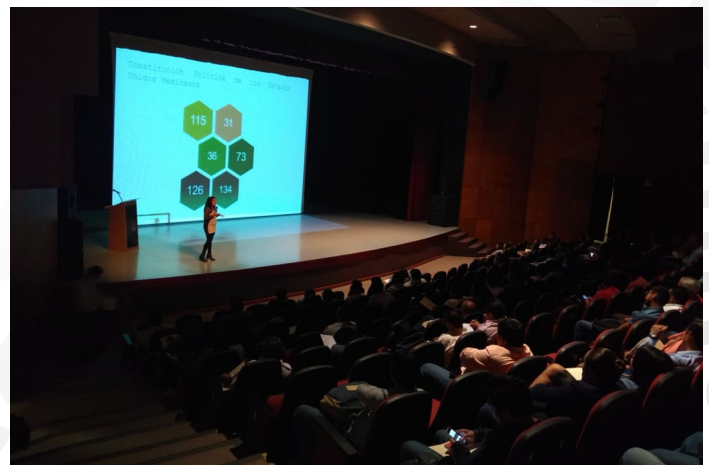
* Jornada de Capacitación en el estado de Chiapas.

15. Participamos en la “Primera Jornada de Capacitación a Servidores Públicos Municipales de Chiapas” que se llevó a cabo en la Ciudad de Tuxtla Gutiérrez, con el objetivo de fortalecer las capacidades institucionales de los gobiernos municipales de esa entidad, a través de la incorporación a la Guía Consultiva de Desempeño Municipal, una nueva herramienta del Instituto que impulsa la gestión de los gobiernos locales.