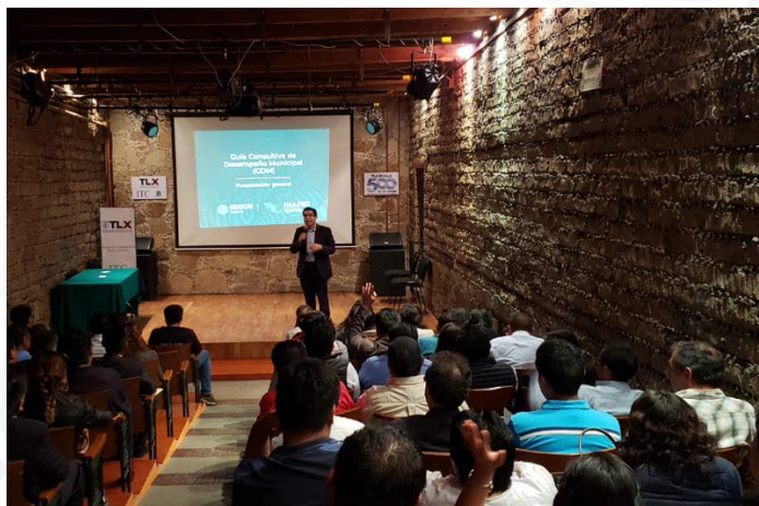
* Jornada de Capacitación en el estado de Tlaxcala.

27. Realizamos Jornada de Capacitación en el estado de Tlaxcala dirigida a servidores públicos municipales de esa entidad, con el objetivo de fortalecer sus capacidades en materia de control interno en la administración pública municipal.