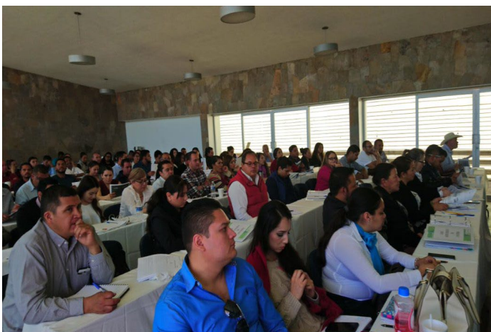
* Jornada de Capacitación en el estado de Zacatecas.

9. Impartimos capacitación a servidores públicos del ayuntamiento de Tepic, Nayarit a fin de fortalecer habilidades y conocimientos en temas de Transparencia y Rendición de Cuentas, Disciplina Financiera y Responsabilidades Administrativas, lo anterior, con la finalidad de que la administración municipal pueda responder de manera oportuna a las necesidades y demandas de la población.