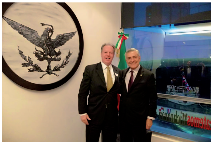
* Reunión con el Senador Cristóbal Arias Solís.

24. En colaboración con la Coordinación Estatal de Desarrollo Municipal de Colima realizamos el Taller sobre la Guía Consultiva de Desempeño Municipal la cual busca mejorar y consolidar las capacidades institucionales de las administraciones publicas municipales.