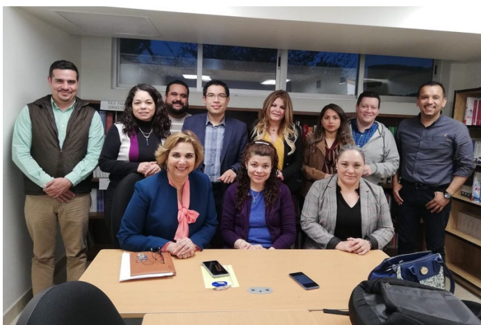
* Reunión de trabajo con académicos de la Universidad Autónoma de Ciudad Juárez.