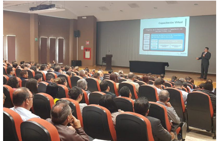
* Jornada de Capacitación en el estado de Zacatecas.

13. En la Primera Jornada de Capacitación para Servidores Públicos Municipales del estado de Zacatecas, Directivos del INAFED participaron como ponentes en temas de “Reglamentación Municipal” y “Atribuciones de la Secretaría del Ayuntamiento”, con el objetivo de contribuir al más eficaz ejercicio de la facultad reglamentaria de los municipios.