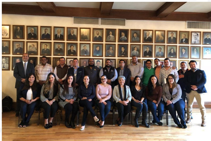
* Capacitación sobre la Guía Consultiva de Desempeño Municipal en Chihuahua.

18. El INAFED brindó capacitación sobre la Guía Consultiva de Desempeño Municipal (GDM) a los ayuntamientos de la Región Centro de Chihuahua, herramienta que busca fortalecer las capacidades institucionales de los municipios e impulsar las mejores prácticas a nivel local.