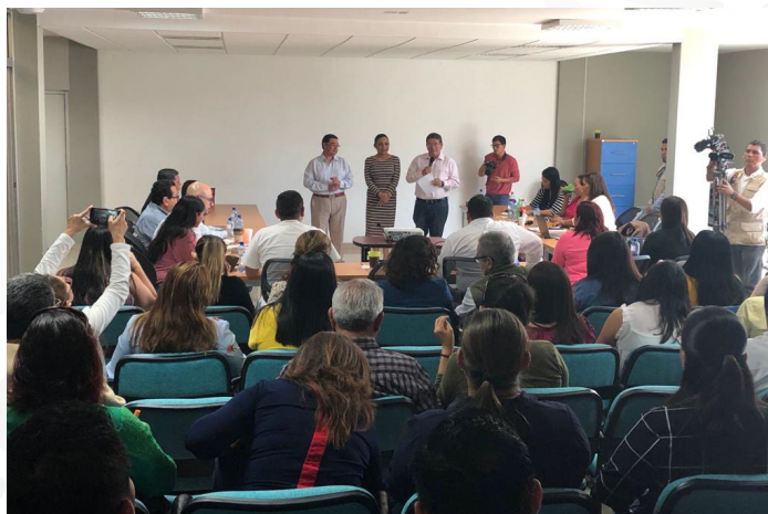
* Jornada de Capacitación en el estado de Nayarit.

9. Impartimos capacitación a servidores públicos del ayuntamiento de Tepic, Nayarit a fin de fortalecer habilidades y conocimientos en temas de Transparencia y Rendición de Cuentas, Disciplina Financiera y Responsabilidades Administrativas, lo anterior, con la finalidad de que la administración municipal pueda responder de manera oportuna a las necesidades y demandas de la población.