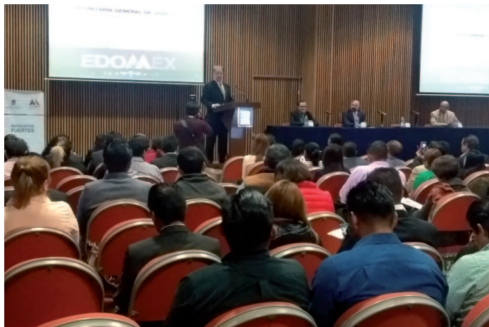
* Taller de la Guía Consultiva de Desempeño Municipal, FES Acatlán.