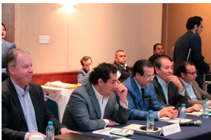
* Primera Reunión Plenaria de Alcaldes ANAC.

2. Con el objetivo de continuar impulsando un diálogo constructivo con actores municipalistas del país, asistimos a la Primera Reunión Plenaria de Alcaldes convocada por la Asociación Nacional de Alcaldes, ANAC. Presentamos el tema “La Profesionalización del Servidor Público Municipal en México”, en donde reafirmamos que la administración pública puede llegar a ser eficiente en su desempeño si se llevará a cabo una estrategia para fortalecer las capacidades técnicas de los gobiernos municipales.