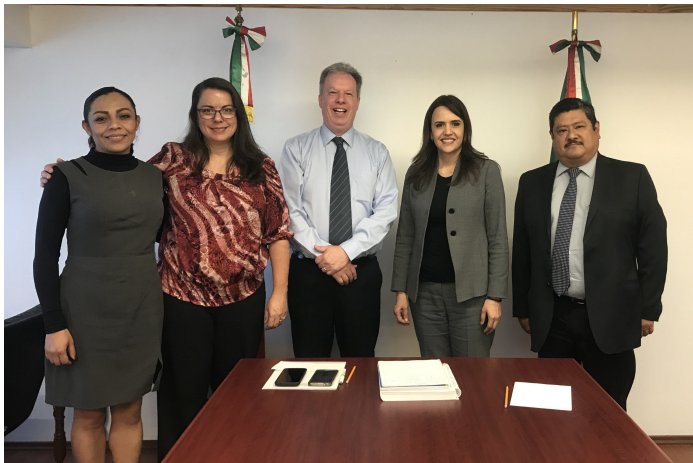
* Reunión con la Presidenta Municipal de Escobedo, Nuevo León.

5. Con el objetivo de Consolidar el Modelo Operativo de la nueva Guía Consultiva de Desempeño Municipal, nos reunimos con los estados de Hidalgo, Morelos, México, Tlaxcala y Puebla, para llevar a cabo una mesa de trabajo a fin de fortalecer esta nueva herramienta para los municipios de México. Los participantes nos apoyaron con su retroalimentación y observaciones respecto al funcionamiento y operación de la Guía.