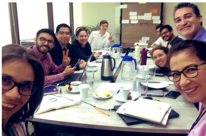
* Taller Kick-Off del Programa de Capacitación "Calles Completas y Verdes".

6. Con la finalidad de intercambiar experiencias y conocimientos que aborden la infraestructura verde como estrategia para la adaptación y mitigación al cambio climático, participamos en el Taller Kick-Off del Programa de Capacitación "Calles Completas y Verdes", que coordina la Agencia de Cooperación Alemana (GIZ), en conjunto con Steer y la UNAM (Laboratorio de Movilidad e Infraestructura Verde). En el este Taller se presentaron los avances en la elaboración del diplomado semipresencial "Calles Completas y Verdes" orientado a funcionarios municipales que se tiene contemplado que en el año 2020 sea implementado en todos los municipios del país.