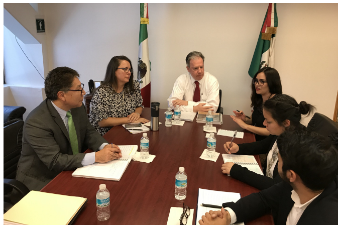
* Reunión con SEDATU.

1. Llevamos a cabo reunión de acercamiento con la Secretaría de Desarrollo Agrario, Territorial y Urbano (SEDATU), específicamente con la Unidad de Microregiones; el área de la Agenda Urbano-Ambiental y de Coordinación Interinstitucional con el objetivo de compartir información para el fortalecimiento de las capacidades institucionales de los municipios en el ámbito territorial.