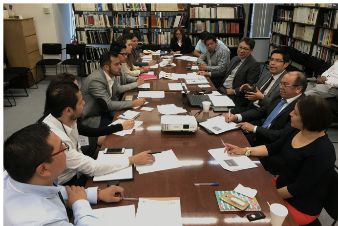
* Mesa de Trabajo para Consolidar el Modelo Operativo de la GDM.

5. Con el objetivo de Consolidar el Modelo Operativo de la nueva Guía Consultiva de Desempeño Municipal, nos reunimos con los estados de Hidalgo, Morelos, México, Tlaxcala y Puebla, para llevar a cabo una mesa de trabajo a fin de fortalecer esta nueva herramienta para los municipios de México. Los participantes nos apoyaron con su retroalimentación y observaciones respecto al funcionamiento y operación de la Guía.