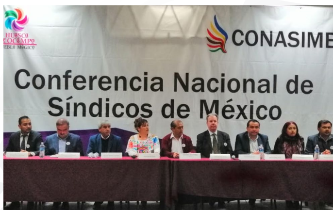
* VII sesión de la Mesa Directiva de la CONASIME.

3. Durante la VII sesión de la Mesa Directiva de la Conferencia Nacional de Síndicos de México (CONASIME), presentamos la nueva oferta de los programas institucionales del INAFED con lo que se busca impulsar las acciones necesarias para fortalecer a los gobiernos locales mediante iniciativas de promoción, alianzas y vinculación para su desarrollo.