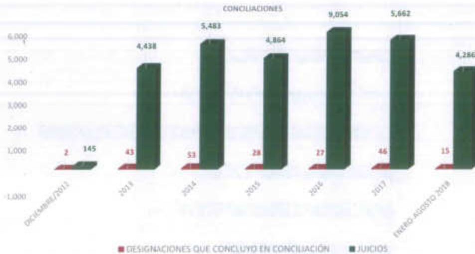
Gráfica 2. Total, de asuntos concluidos por año en materia de designación de beneficiarios, diciembre de 2012 a 31 de agosto de 2018.