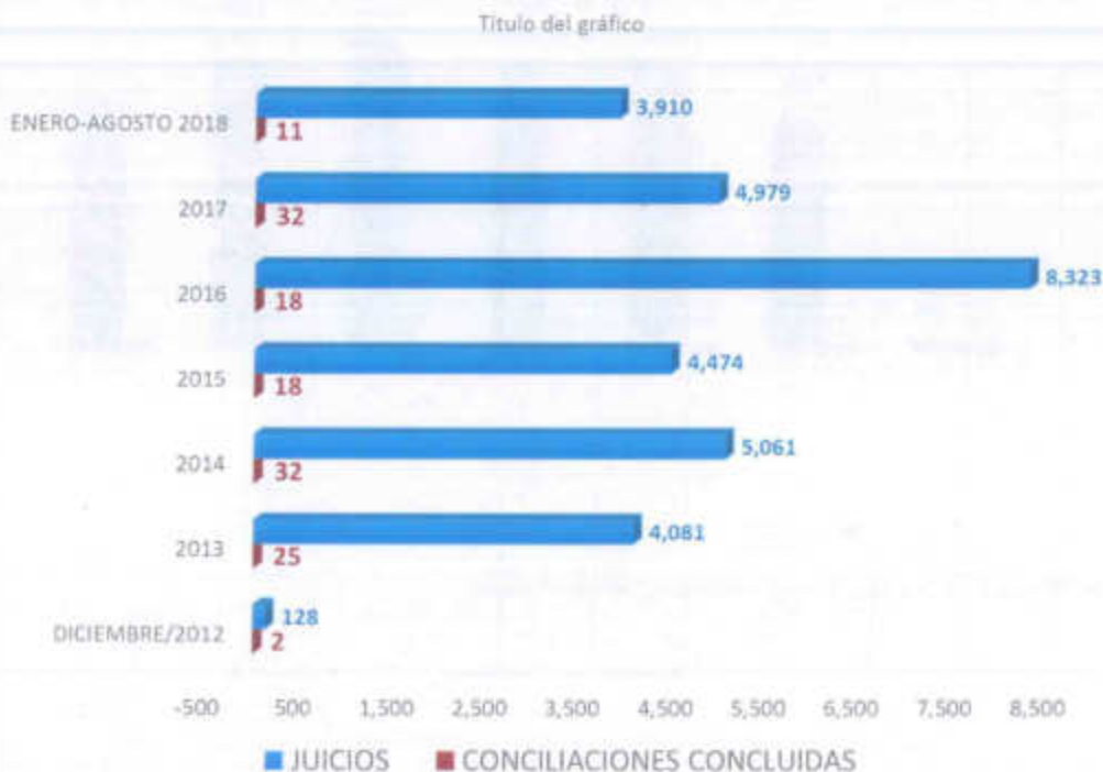
Gráfica 3. Número de asuntos concluidos y juicios resueltos en favor de las y los beneficiarios diciembre de 2012 a 31 de agosto de 2018.

En base a los logros alcanzados durante el 1 de diciembre de 2012 y el 31 de agosto de 2018, se concluyeron favorablemente 30,956 juicios de los cuales 31,094, fueron juicios realizados en materia de designación de beneficiarios y los 138 restantes son asuntos que si bien es cierto estaban encaminadas a ser juicios de designación, terminaron en una conciliación en beneficio de las y los beneficiarios que solicitaron atención en esta procuraduría. Gráfica 3