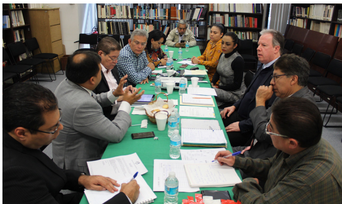
* Capacitación de servidores públicos municipales