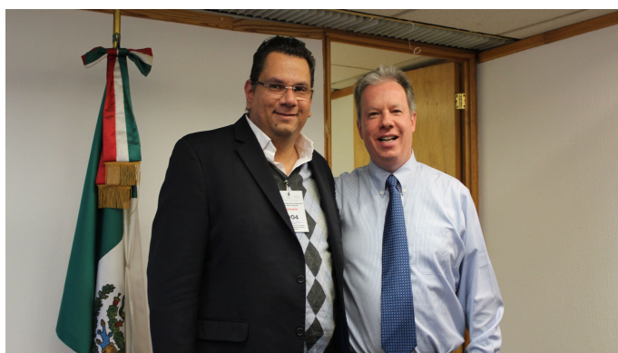
* Reunión con el titular del Organismo Estatal de Desarrollo Municipal de Veracruz

3. Trabajamos con los titulares de los Organismos Estatales de Desarrollo Municipal de los estados de Veracruz y Michoacán, con los que se acordó tener una estrecha colaboración intergubernamental para impulsar el desarrollo municipal a través de la profesionalización, capacitación y asistencia técnica; además de implementar instrumentos que fortalezcan a los municipios de ambos estados.