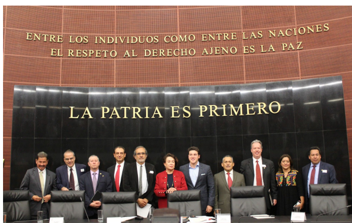
* Encuentro por el Federalismo y el Desarrollo Municipal

1. Asistimos al Encuentro por el Federalismo y el Desarrollo Municipal organizado por el Senado de la República, en donde compartimos con los asistentes la nueva visión institucional, así como, los objetivos estratégicos para el arranque de esta nueva administración.