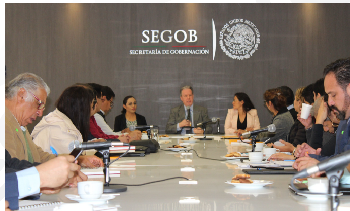
* Asistencia técnica

8. Finalmente, con el objetivo de fortalecer a los gobiernos locales a través de la asistencia técnica, se compartió con representantes de los municipios de los estados de Hidalgo, Estado de México, Morelos, Michoacán, Quintana Roo y Veracruz, insumos y herramientas que les permitirán elaborar sus Manuales de Organización Municipal.