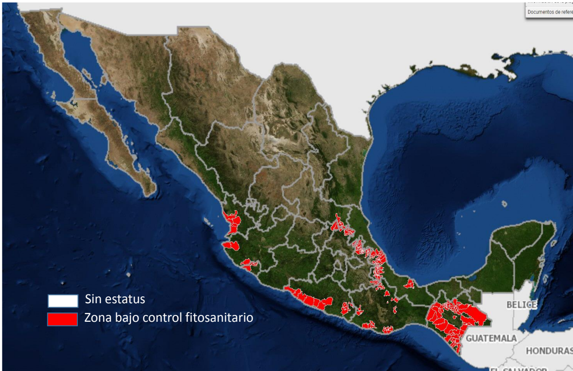
Figura 1. Municipios con antecedentes de la broca del café.

La broca del café se encuentra presente prácticamente en todas las zonas productoras de café en México (figura 1), no obstante, los niveles de infestación están determinados por las condiciones agroecológicas donde se ubican los predios, así como del manejo agronómico realizado en los mismos, ya que de acuerdo con los datos de muestreo registrados en el 2017, el promedio de infestación en los municipios atendidos reflejan infestaciones entre el 0% (Jalpan de Serra, Querétaro) al 8.2% (Santa María Chilchotla, Oaxaca).