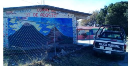
Aprovechan ladrones falta de seguridad y vacaciones, para sustraer material eléctrico y electrónico