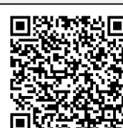
Infografía CENAPRED: "Tormentas eléctricas"