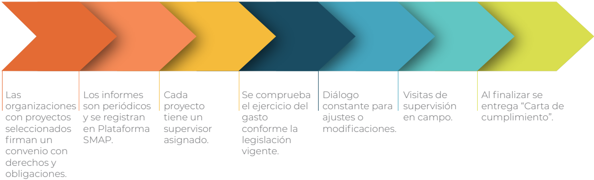
Figura 3. Asesoría, supervisión y fiscalización de los proyectos

El Censida practica un proceso definido para asesoría, supervisión y fiscalización de los proyectos de las OSC que reciben el financiamiento público (Figura 3). xxxv