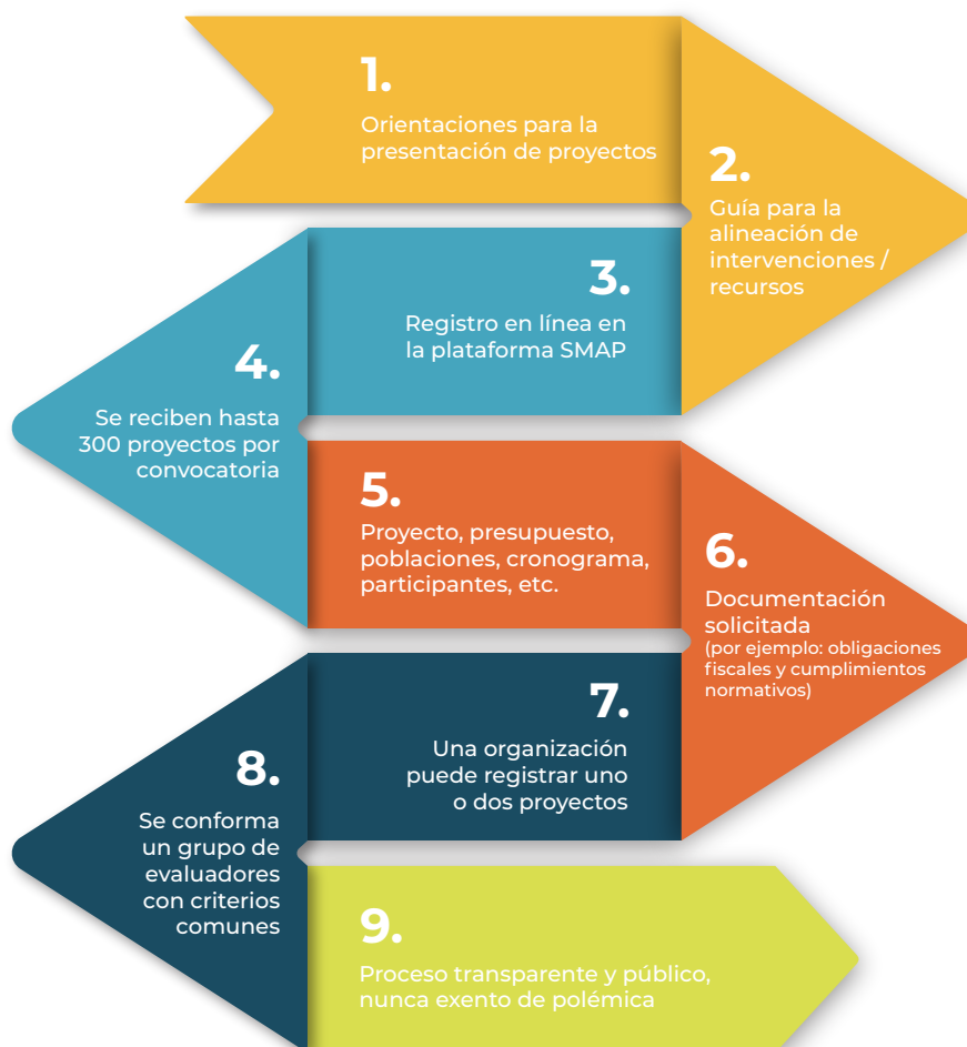
Figura 2. Proceso de registro y selección en la Convocatoria del Censida (2018)

La convocatoria del Censida contiene las bases de participación (Cuadro 6).