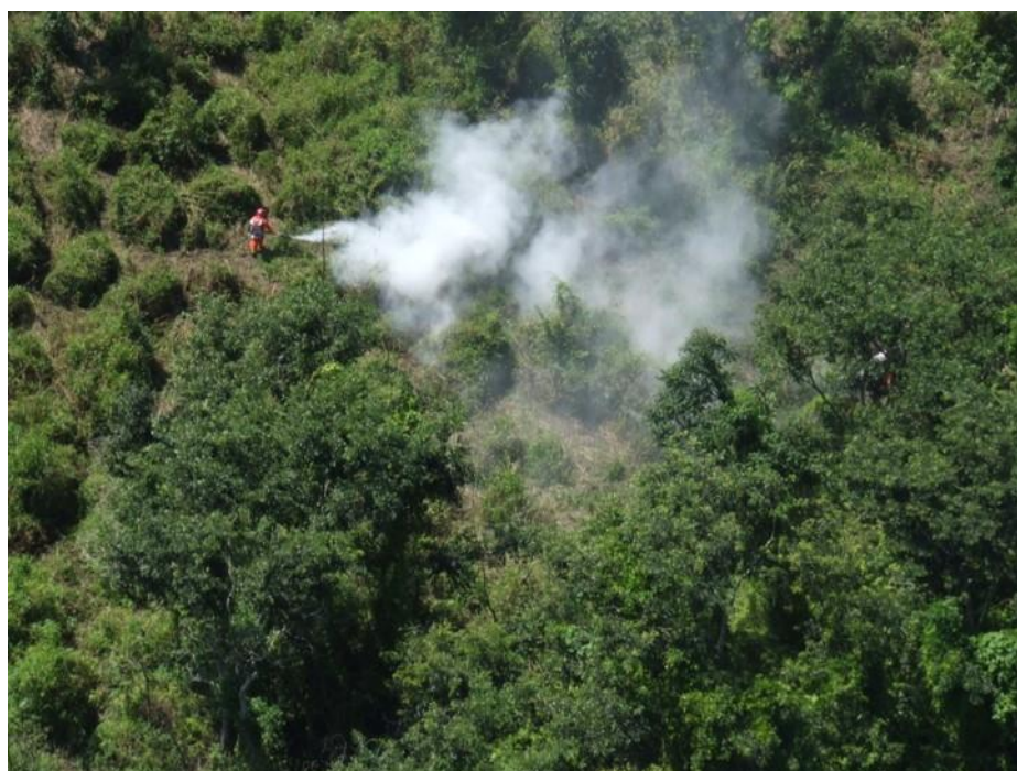
Figura 2. Vista aérea del control químico en el estado de Yucatán.

Al llevar a cabo las acciones de la campaña en 10 Entidades Federativas, se protegió indirectamente la superficie establecida con cultivos de agave, calabaza, caña de azúcar, cártamo, cítricos, frijol, frutales, girasol, limón, maíz, mango, naranja, palma de aceite, piña, sorgo, soya, teca y tomate de cáscara, principalmente, pues la langosta es un insecto polífago que puede llegar a alimentarse de hasta 400 especies vegetales. Mediante la detección y control oportuno, la plaga en cuestión no representó riesgo de daño o pérdidas económicas, que pueden llegar a ser de hasta el 100% de los cultivos susceptibles (Figura 2).