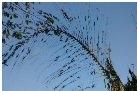
Figura 1. Daños causados por la langosta, estado de Yucatán.