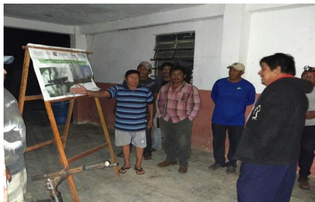
Figura 1. Reunión con productores sobre la participación en el monitoreo de la langosta en el estado de Yucatán.