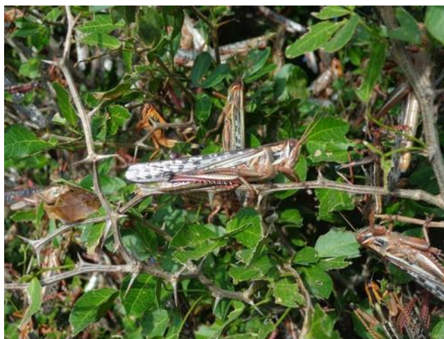
Figura 2. Manchón de langostas (ninfa y adulto), estado de Yucatán.

Al llevar a cabo las acciones de la campaña en 10 Entidades Federativas, se protegió indirectamente la superficie establecida con cultivos de agave, calabaza, caña de azúcar, cártamo, cítricos, frijol, frutales, girasol, limón, maíz, mango, naranja, palma de aceite, piña, sorgo, soya, teca y tomate de cáscara, principalmente, pues la langosta es un insecto polífago que puede llegar a alimentarse de hasta 400 especies vegetales. Mediante la detección y control oportuno, la plaga en cuestión no representó riesgo de daño o pérdidas económicas, que pueden llegar a ser de hasta el 100% de los cultivos susceptibles (Figura 2).