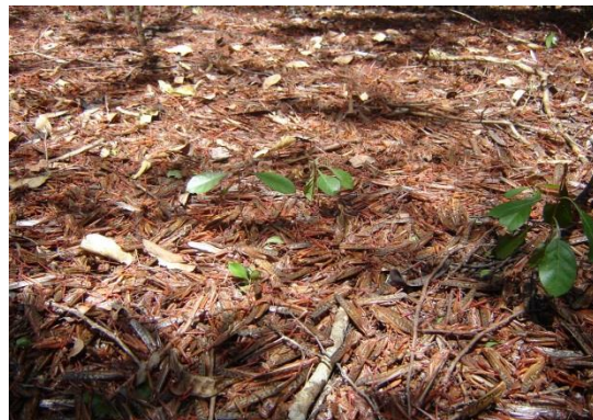
Figura 1. Control de langosta en formación de manga, estado de Yucatán.