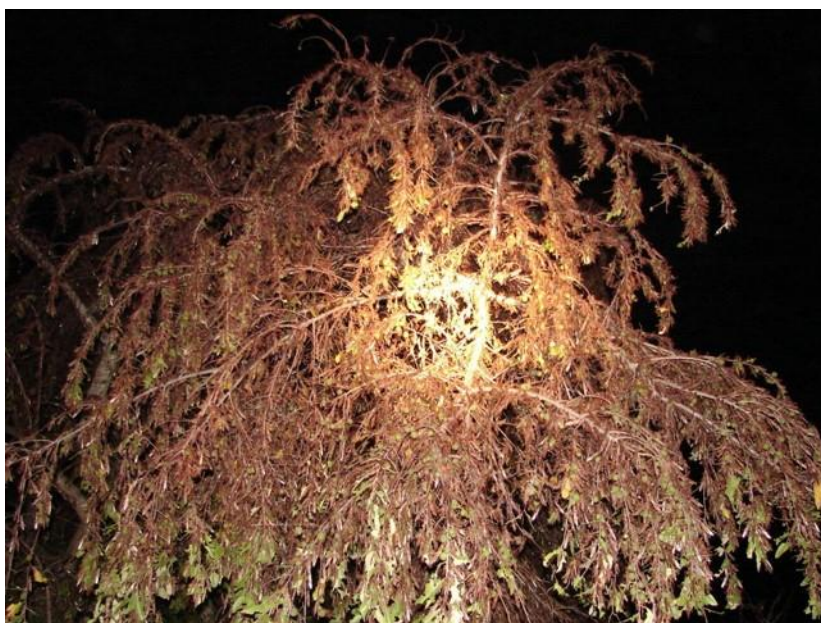
Figura 2. Manga de langostas posada, estado de Yucatán.

Al llevar a cabo las acciones de la campaña en 10 Entidades Federativas, se protegió indirectamente la superficie establecida con cultivos de agave, calabaza, caña de azúcar, cártamo, cítricos, frijol, frutales, girasol, limón, maíz, mango, naranja, palma de aceite, piña, sorgo, soya, teca y tomate de cáscara, principalmente, pues la langosta es un insecto polífago que puede llegar a alimentarse de hasta 400 especies vegetales. Mediante la detección y control oportuno, la plaga en cuestión no representó riesgo de daño o pérdidas económicas, que pueden llegar a ser de hasta el 100% de los cultivos susceptibles (Figura 2).