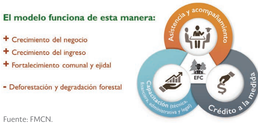
FIGURA 1. MODELO DE INTERVENCIÓN DEL PROYECTO 4 DEL FIP