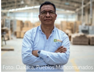
Foto: Oaxaca, Pueblos Mancomunados

Con apoyo de este proyecto, en el marco del Programa de Inversión Forestal (FIP, por sus siglas en inglés), se identificaron oportunidades para mejorar procesos legales, contables y laborales de 16 EFC, cuya implementación combinada tiene un impacto positivo en sus aspectos empresariales.