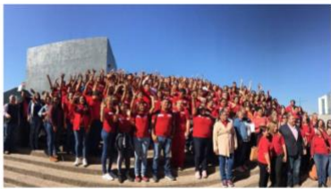
Jóvenes que participaron en Conafe.

Martes 13 de Noviembre de 2018 7:39:09 AM