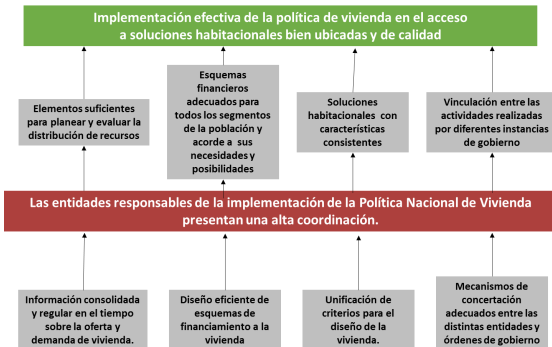
Ilustración 2. Árbol de objetivo

Fuente: Elaboración propia. Agosto de 2018.