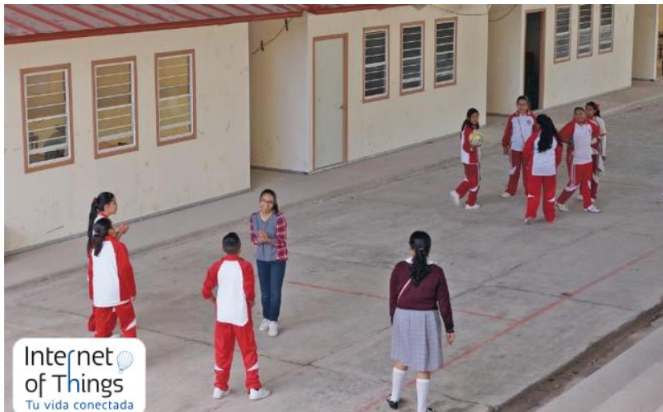
Al analizar programas de autonomía escolar, bebederos en planteles, inglés en las escuelas y capacitación, la ASF no encontró un progreso considerable.

● Al analizar los programas de autonomía escolar, bebederos escolares, inglés en escuelas y capacitación a docentes, el auditor Superior de la Federación determinó que no se obtuvieron progresos