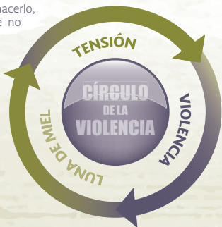
Luna de Miel

Tras varias repeticiones del ciclo, la fase de la reconciliación desaparece, pasando de la “acumulación de tensión” al “estallido de violencia”. En este caso las agresiones serán cada vez más violentas.