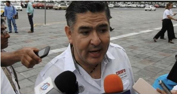
Al menos 30 escuelas rurales no cuentan con condiciones dignas: CONAFE

INICIO LA CIUDAD LA REGIÓN NACIONAL INTERNACIONAL VIRAL STILO ESCENARIOS