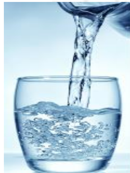
Agua para consumo humano