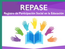
Registro público de consejos escolares