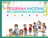
Programa Nacional de Convivencia Escolar