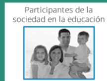
Participantes de la sociedad en la educación