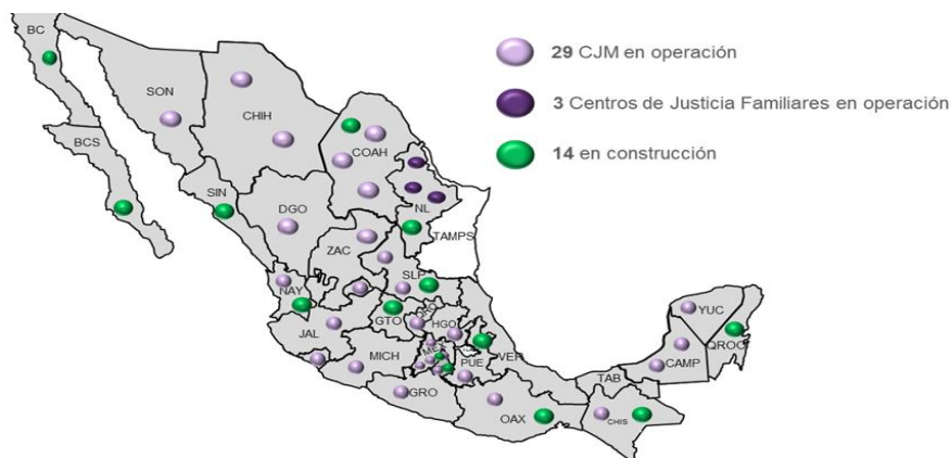
Centros de Justicia para las Mujeres (2016)