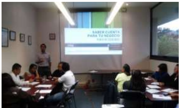
Curso: Saber cuenta para tu negocio