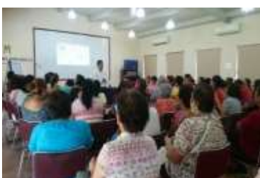
Cuautla 23 mayo