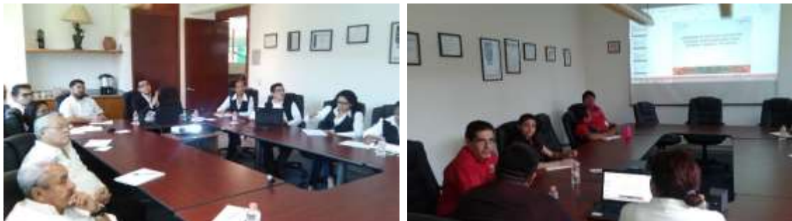
Capacitación externa al personal de la Delegación Federal 2017