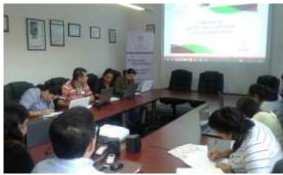
Curso: empresario en 6 días.