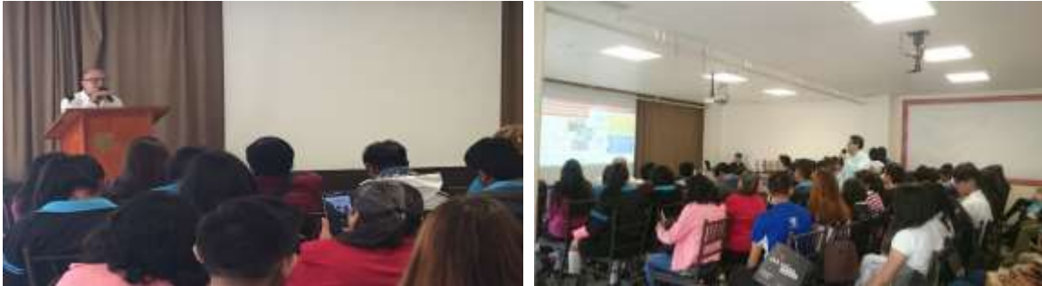
Visita a la Universidad Fray Luca Paccioli.