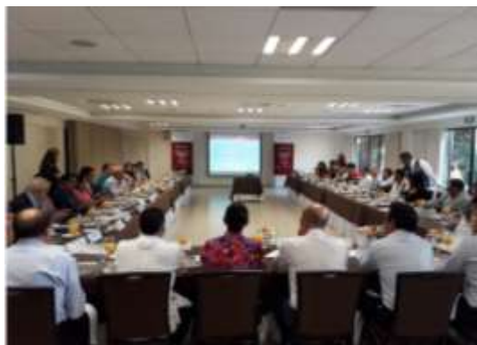
1ª Sesión Ordinaria 2018.