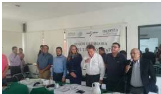
Comités técnicos de PROSPERA