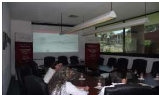
Reunión con Consejo Coordinador Empresarial y Canacintra