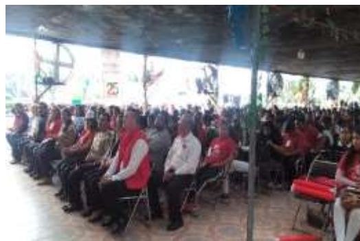
Difusión del PRONAFIM