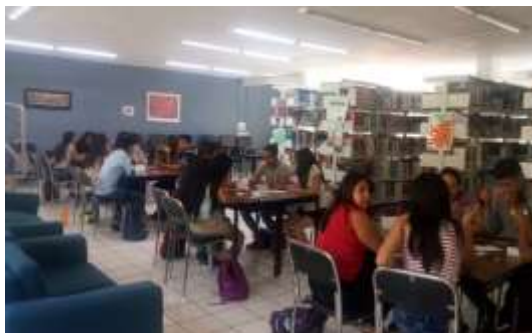
Simulador de Negocios en la Escuela de Estudios Superiores de Jojutla