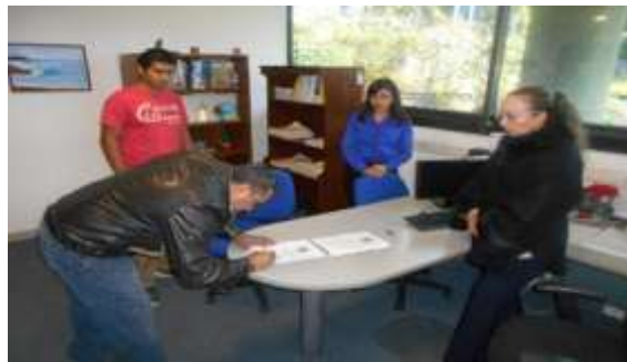
Entrega de plan de negocio de exportación