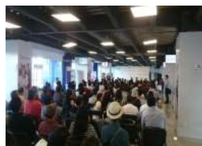
SEDESOM Morelos 20 abril 2017