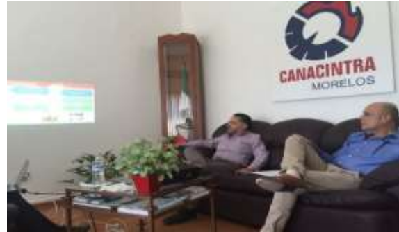
Reunión con el Consejo Coordinador Empresarial CCE y Canacintra