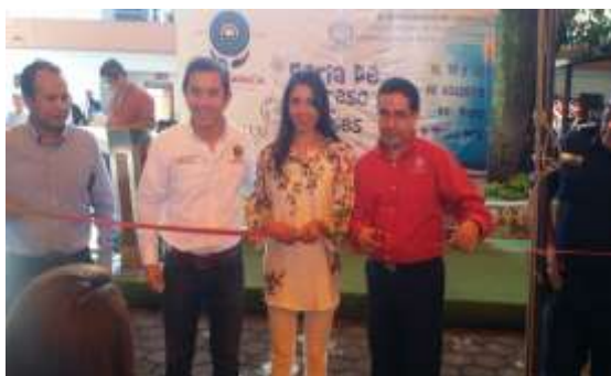
Inauguración Feria de Útiles Escolares