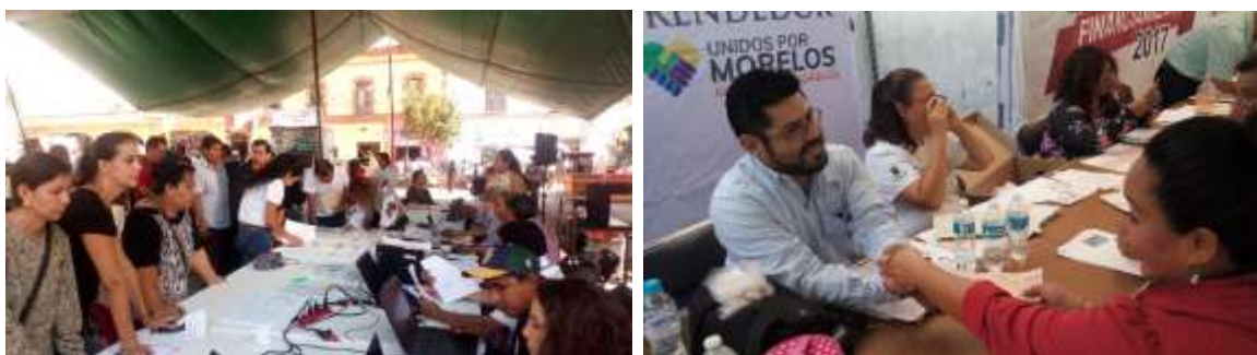
Mesas de atención para la reactivación económica de las MIPYMES siniestradas

Después de la verificación realizada, se emitieron por parte del Gobierno del Estado 3,541 cheques por un monto de $ 10,000.00 (diez mil pesos 00/100 M.N.) cada uno, para beneficio de igual número de empresarios afectados por el sismo, con la finalidad de apoyar la reactivación económica estatal. Siendo el monto dispersado en subsidio por el Instituto Nacional del Emprendedor (INADEM) $ 35,410,000.00 (treinta y cinco millones cuatrocientos diez mil pesos 00/100 M.N.)