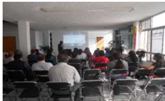
Curso: Educación financiera