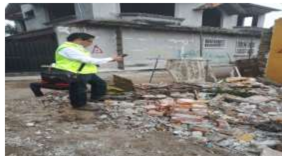
Censo de viviendas afectadas por el sismo