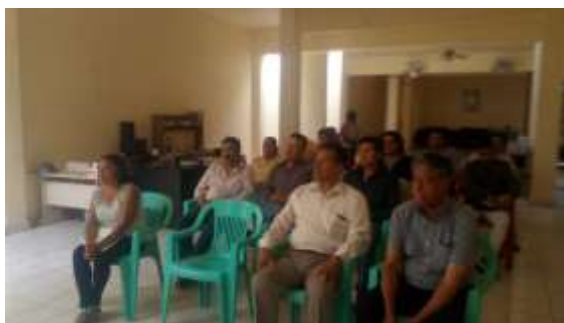
Central de Abasto de Cuautla

Los días 24 y 27 de marzo del 2018, se llevaron a cabo dos pláticas informativas sobre el Sistema Nacional de Información e Integración de Mercados (SNIIM), con comerciantes de la Central de Abasto de Cuautla, Morelos y de la Plaza 12 de Octubre, del mismo municipio.