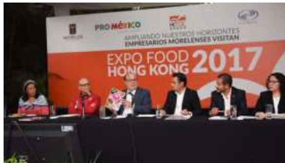
Expo Food Hong Kong 2017