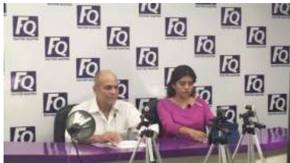
Entrevistas de radio y televisión