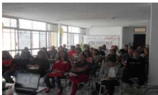
Cursos de capacitación CITIBANAMEX-PROSPERA