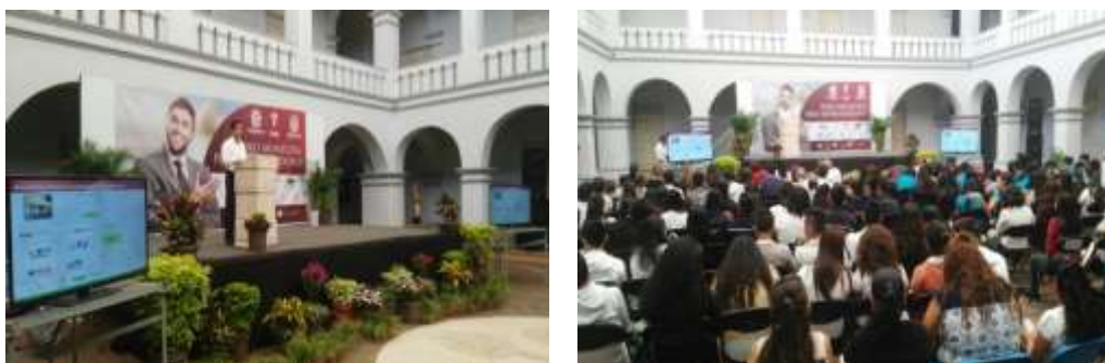
Difusión del Sistema Nacional de Garantías

A través de los eventos de Promoción que se realizan con los diferentes aliados del Ecosistema emprendedor, entre ellos los municipios, Cámaras y Organismos Empresariales, se difunden los esquemas de apoyo que existen en la banca comercial a través del Sistema Nacional de Garantías PYME.