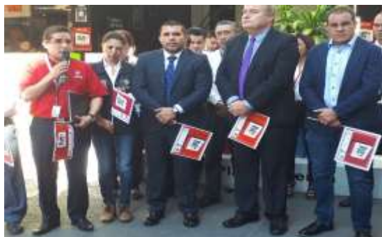
Banderazo para el inicio del Buen Fin