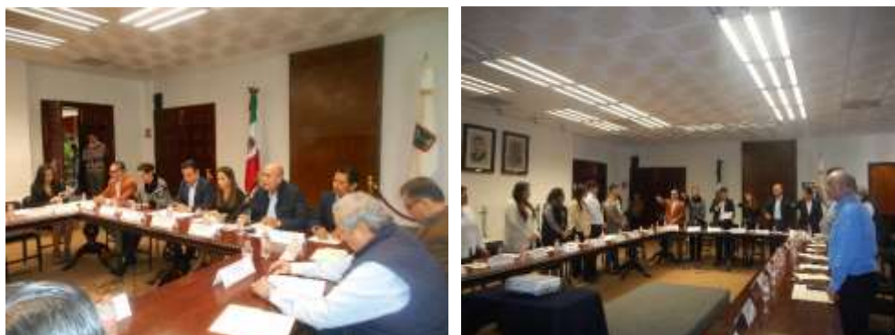
Instalación del Consejo para el Desarrollo de la Competitividad de las MIPYMES (Dic-2017).

El Consejo de la Red de Apoyo al Emprendedor, se integró como un grupo de trabajo dentro del Consejo para el desarrollo de la competitividad de la micro, pequeña y mediana empresa, el cual se instaló el 11 de diciembre del 2017.