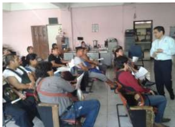
Plática del SNIIM en el Mercado Adolfo López Mateos de Cuernavaca, Morelos.

Con el propósito de que la información del sistema sea conocida y utilizada, la Delegación Federal, llevó a cabo pláticas con población objetivo, dándoles a conocer el sistema, sus objetivos, funcionamiento e importancia del SNIIM, adicionalmente en cada una de las capacitaciones empresariales impartidas por la Delegación Federal, se les informa a los participantes de la herramienta para utilizarla como fuente de información en la determinación de sus costos, además de poder encontrar clientes y proveedores a través de los enlaces comerciales.