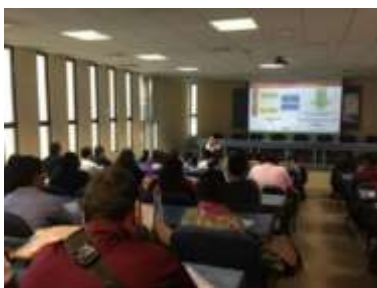
UTEZ 8 febrero