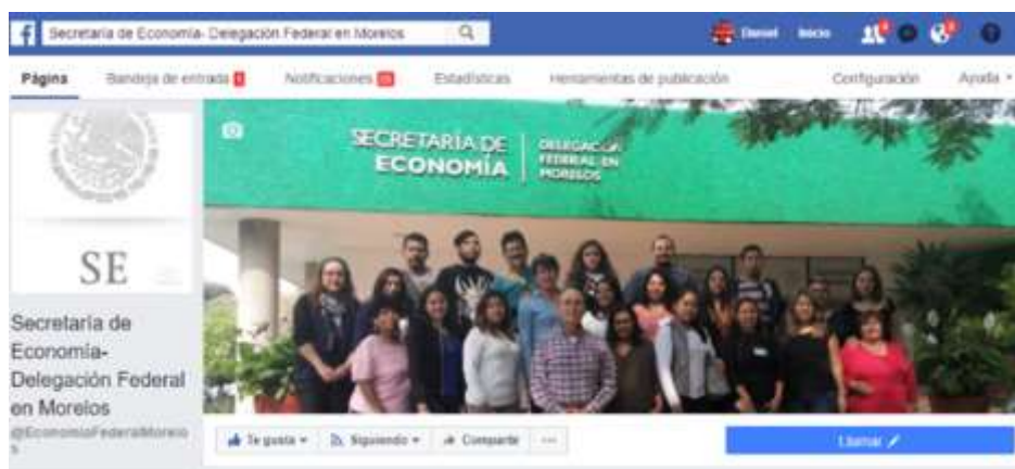
Página de Facebook