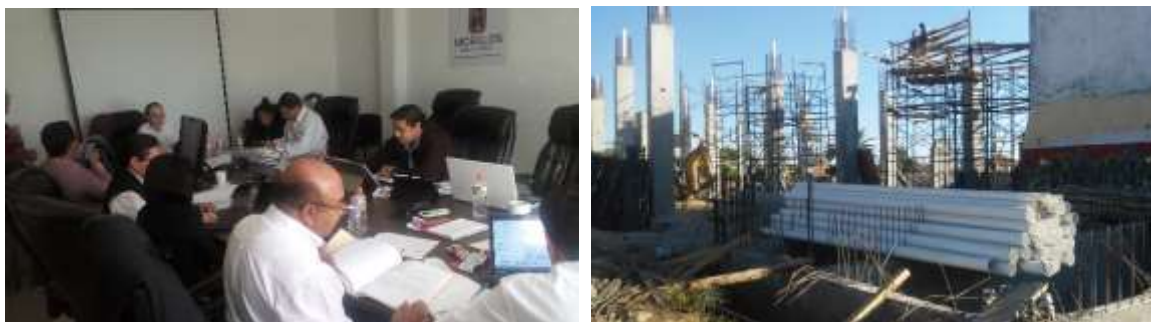
Visitas de Supervisión a proyectos del INADEM

A través del Programa Nacional de Visitas de Supervisión 2015-2016 de los proyectos del INADEM , la Delegación Federal realizó las visitas de supervisión de 21 proyectos asignados para revisión . La meta presentada por la Coordinación de Delegaciones, fue la de realizar las revisiones a más tardar en el mes de enero del 2018, la estrategia para cumplir con la instrucción en el menor tiempo posible, del 29 de noviembre al 14 de diciembre del 2017, se debió a la formación de 4 equipos de trabajo, integrados por personal de las áreas de promoción, servicios y administrativo. Los 21 proyectos fueron enviados al INADEM para las acciones correspondientes sobre el uso de los recursos.