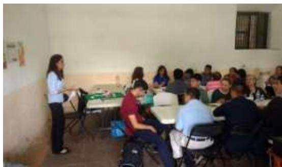
Simulador realizado en Cuautla, Morelos