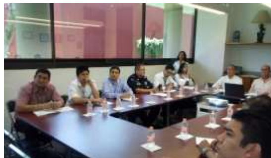
Instalación Sicia 2018