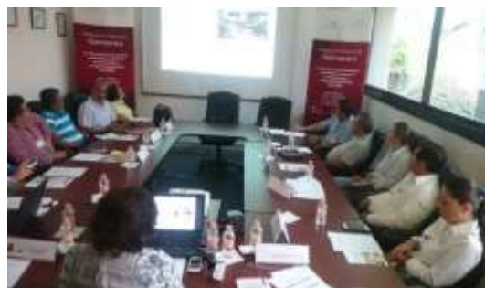
Instalación del Comité de Abasto 2017.