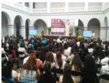
Museo Cuernavaca 27 marzo 2017