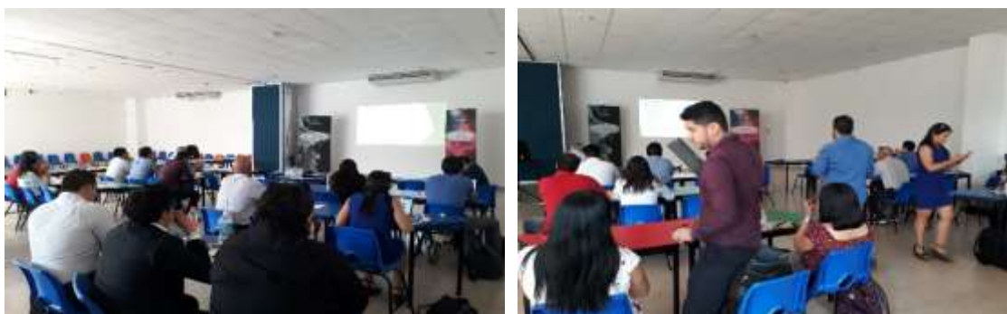
Taller convocatoria 2.1 Secretaría de Innovación Ciencia y Tecnología