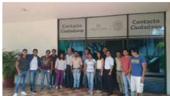
Convenio con ICATMOR, NAFIN y SE, para realizar el curso Empresario en 6 días