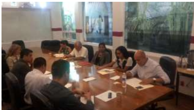
Reunión con Secretaría de Turismo y Asociación de Hoteleros

De enero a abril del 2018, la Delegación está promoviendo la reactivación económica del sector turismo, para favorecer que empresas del sector hotelero, restaurantero y balnearios, tengan ocupación de domingo a jueves, por lo que se está trabajando de manera coordinada con la Secretaría de Turismo del Gobierno del Estado y la Federación de Sindicatos de Trabajadores al Servicio del Estado (FSTSE), en Morelos.