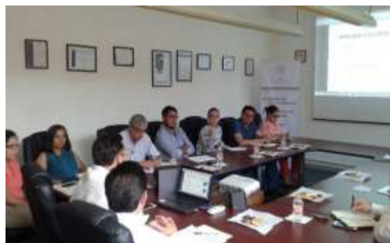
Taller convocatoria 2.1