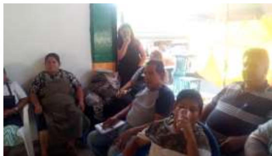
Plaza 12 de Octubre