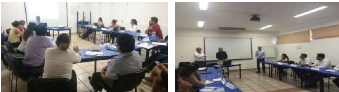
Taller Formulación y Evaluación de Proyectos de Inversión

Se gestionó un taller con la Secretaría de Economía Estatal sobre la “ Formulación y Evaluación de Proyectos de Inversión ”, para los asesores de los puntos de la Red de Apoyo al Emprendedor, con la finalidad de generar proyectos mejor estructurados para las convocatorias del INADEM. Se contó con 16 asistentes y 9 instituciones de apoyo empresarial . Se encuentra en gestión otro curso para las cámaras y organismos empresariales.