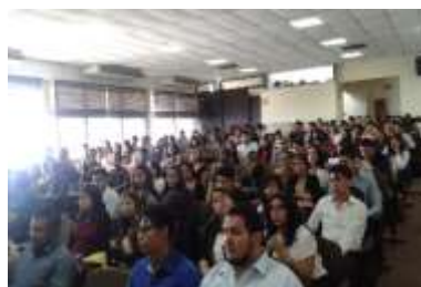
UAEM 23 Mayo