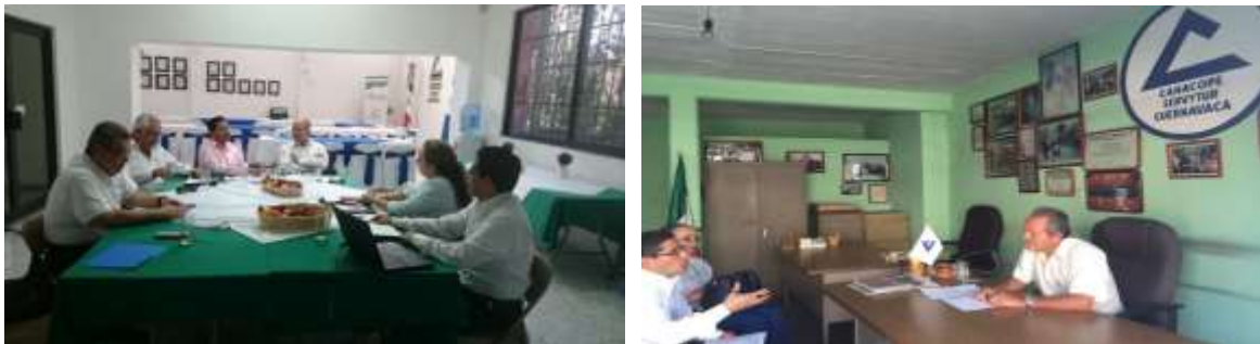
Visitas a cámaras empresariales