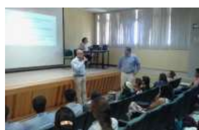
UTEZ 8 junio