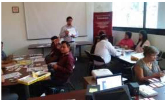
Curso: Decisiones de peso.