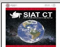
Enlace Manual SIAT-CT SEGOB