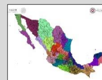
REGIONALIZACIÓN División de tu estado

Siguiente alerta será emitida: a las 05:00 hrs. del 02 de octubre del 2018.