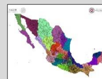
REGIONALIZACIÓN División de tu estado

Siguiente alerta será emitida: a las 05:00 hrs. del 30 de septiembre del 2018.