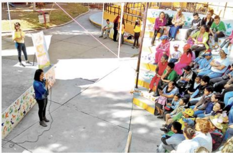
CDHEH realizó siete mil 900 pláticas técnicas, 186 cursos, cinco diplomados y la ruta "Hidalgo con Derechos".

LOCAL POLICÍA REGIONAL MÉXICO REPÚBLICA MUNDO FINANZAS DEPORTES