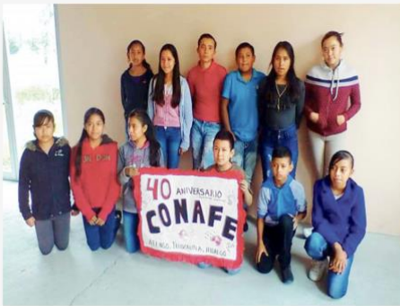
Niños y jóvenes de los municipios de la entidad son los favorecidos.

LOCAL POLICÍA REGIONAL MÉXICO REPÚBLICA MUNDO FINANZAS DEPORTES