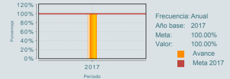
Porcentaje de incorporación de autoridades al SIGED

El programa no cuenta con evaluaciones de impacto, ni similares, entre otras razones por la de tipo presupuestal. En 2015 realizó una Evaluación de Diseño de la que se derivó la recomendación de la importancia de contar con un documento normativo, de ahí que al día de hoy ya cuenta con Lineamientos de operación, publicados en el Diario Oficial de la Federación en marzo 2018. El programa mide sus resultados a partir del reporte de los indicadores incluidos en la MIR, en el nivel Fin "Tasa de abandono escolar en educación primaria, secundaria y media superior por servicio" muestra un cumplimiento de 0.7%, faltando sólo dos centésimas para alcanzar la meta 0.5% programada para el 2018. En el indicador de Propósito "Las autoridades educativas Federal, Locales, Supervisores y Directores de Escuelas apoyan sus procesos de planeación, administración, operación, evaluación y control del Sistema Educativo Nacional en el Sistema de Información para la Gestión Educativa (SIGED)" reportan un nivel de cumplimiento del 100%. (FT17, ICP17, MIR17)