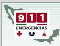
En caso de emergencia marca al 911