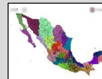
REGIONALIZACIÓN División de tu estado

Siguiente alerta será emitida: Boletín informativo único.