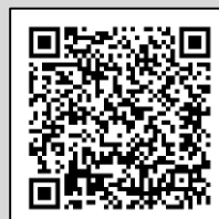
Infografía CENAPRED: "Laderas inestables"