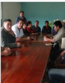
Se reunió además con agentes y subagentes para concretar proyectos de obras.

En la comunidad, que es una de las más alejadas y que sólo se llega a pie, el munícipe refrendó su compromiso para que la carretera llegue hasta la escuela, dando instrucciones a un residente de obra para hacer la medición del tramo que falta, y se tenga una propuesta de inversión.