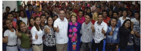
La presidenta del DIF Guerrero inauguró un curso de capacitación para el personal del Consejo Nacional de Fomento Educativo.

10 JULY, 2018 PUBLICIDAD NEWSLETTER DIGITAL GUERRERO - EN VIVO