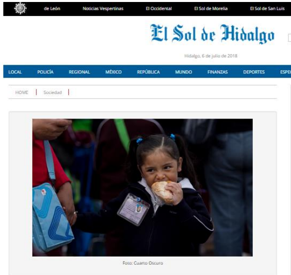
Presenta SEP calendario escolar 2018-2019 ¡consulta las fechas!

HIDALGO (6/jul/2018). La Secretaría de Educación Pública ha dado conocer los calendarios escolares para el ciclo lectivo 2018-2019 que son aplicables para toda la República Mexicana ya sea para escuelas privadas o públicas para nivel preescolar, primaria, secundaria, normal y demás para la formación de maestros de educación básica.