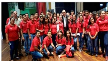
2ª Cruzada Nacional por la Educación Comunitaria Al Calor Político