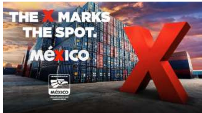
Ilustración 3 The X Marks the Spot, ingeniosa campaña que marca a México como el centro más álgido de desarrollo tecnológico en industria manufacturera.

Además, se logró la participación como expositores de cuatro empresas regiomontanas del rubro manufacturero y tecnológico, llevando a las empresas de la región a exponer el mayor foro del rubro. Las