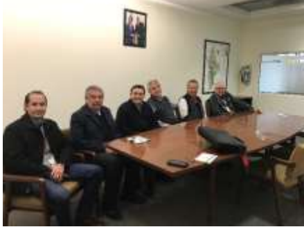
Instalaciones de la SE en Nuevo León

En el mes de febrero de 2018, se realizan varias reuniones técnicas en las oficinas de la Secretaría de Economía, dentro de las cuales destacan: