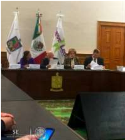
Instalación del Consejo Estatal para la MIPYME. Palacio de Gobierno. Nuevo León

El 9 de febrero, se llevó a cabo la presentación del Programa para la Productividad y Competitividad Industrial en instalaciones de la Delegación donde se mencionarán los objetivos, tipos y montos de apoyo. Y dar a conocer las características de la Convocatoria a fin de que los interesados participen con la posibilidad de que el Programa apoye el desarrollo de las actividades industriales del Estado, conforme a las Reglas de Operación del PPCI 2018.