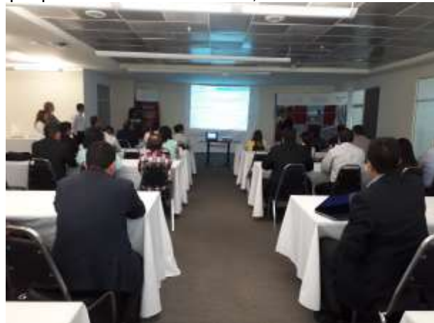
Sala de usos múltiples en la SE, Nuevo León

Pertencientes a PROGRAMAS PARA MIPYMES de la Convocatoria 4.2 del INADEM “Formación Empresarial y Micro franquicias” en los cuales se apoyaron 7 proyectos beneficiando a igual número de MIPYMES en Nuevo León con una inversión federal nacional de $238,098.00 pesos y una inversión privada de 26,455.33 dando un total invertido en este rubro de $264,553.33 pesos.