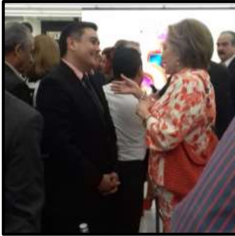
Reunión de Trabajo con el China Development Bank