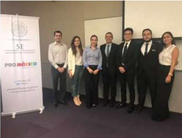
Ilustración 1 Evento "Oportunidades de Negocio en Singapur". EGADE Business School. 14 de junio de 2017.

Por este fin, la oficina de Nuevo León y la Coordinación Regional Noreste promovieron la organización de foros de exportación, inversión y oportunidades de negocio con organismos asiáticos de Singapur, Indonesia y Tailandia, con el vasto apoyo de nuestras oficinas en el extranjero y de las embajadas de los países interesados.