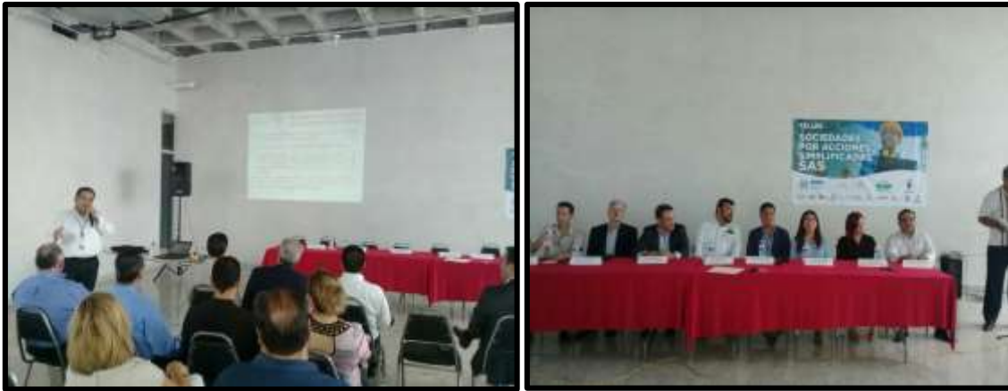
Presentación del programa de Sociedades por acción Simplificada SAS, a la Asociación Mexicana de la Industria de la Construcción, AMIC, Calzada del Valle No.400, Piso Penthouse, Int.9, San Pedro Garza García Nuevo Leon, el miércoles 28 de junio del 2017.