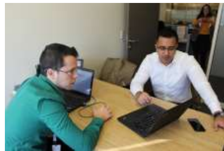
Oficinas de la Delegación de la Secretaría de Economía en N.L.