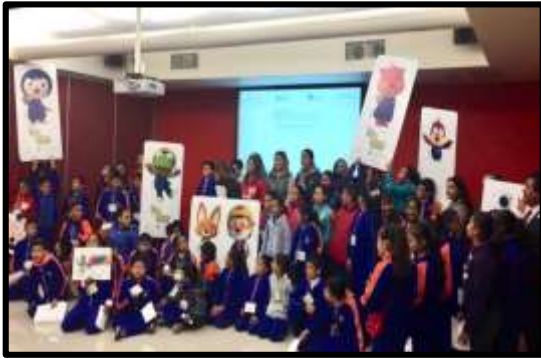
Expo Ingenio 2017, Biblioteca Raúl Rangel Frías, UANL. Cápsula de Pororo.

El Instituto Mexicano de la Propiedad Industrial IMPI, autoridad encargada de administrar el Sistema de Propiedad Industrial en México, a través de su Oficina Regional Norte, ha trabajado arduamente en sembrar el conocimiento sobre el respeto a los derechos de Propiedad Industrial de terceros, concientizando a los ciudadanos sobre las ventajas que este brinda, logrando avances importantes, los cuales han permitido cumplir con las metas propuestas, acercando los servicios del Instituto a los Estados que abarca su jurisdicción (Nuevo León, Coahuila, Chihuahua, Durango y Tamaulipas).