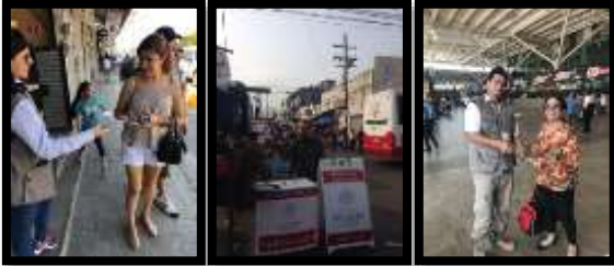
Ilustración 2. "Operativos de Verificación y Vigilancia" de PROFECO

Ahora bien, durante el 2018, procurando la solución de las diferencias entre consumidores y proveedores, así como la prevención y corrección de prácticas abusivas en las relaciones de consumo, se recibieron 933 quejas, logrando la conciliación entre las partes de 439 quejas, cifra que representa el 47.05% del gran total, recuperando con ello un importe total de $9'520,196.96 pesos, de los $35'190,308.11 pesos como monto reclamado de las quejas concluidas a favor del consumidor. Adicionalmente, multamos con sanciones hasta por $17'773,623.06 pesos a los proveedores incumplidos.