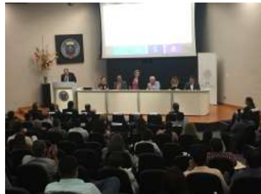
Presentación del FNE 2017 en la Unidad de Seminarios, UANL, Campus Mederos.

El 28 de abril de 2017, se llevó a cabo la presentación del Fondo Nacional del Emprendedor para el Ejercicio Fiscal 2018 como parte de las actividades del área de promoción de la Delegación de Economía en Nuevo León.