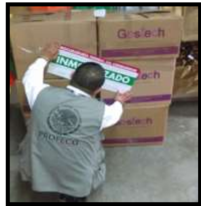
Ilustración 1. "Operativos de Verificación y Vigilancia" de PROFECO

Siguiendo los lineamientos establecidos en el Plan Nacional de Desarrollo 2013-2018 y cumpliendo con las líneas estratégicas institucionales, la Procuraduría Federal del Consumidor continúa promoviendo y protegiendo los derechos y cultura del consumidor, procurando la equidad, certeza y seguridad jurídica en las relaciones entre proveedores y consumidores, mediante la conciliación o solución de controversias dentro del ámbito de nuestra competencia, tanto de forma personal, telefónica y electrónica (tratándose de quejas en materia de Telecomunicaciones); la verificación y vigilancia durante todo el año a través de programas ordinarios y permanentes, así como especiales y temporales; la educación y divulgación mediante la asesoría y capacitación a grupos de consumidores y talleres a proveedores, buscando con ello la prevención y cultura para un consumo responsable e inteligente.