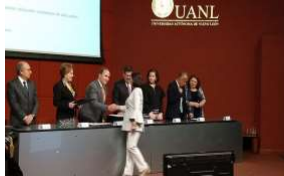
Biblioteca Raúl Rangel Frías, UANL.

En el mes de Noviembre, y con el fin de reforzar e incrementar en forma puntual los Derechos de la Propiedad Industrial en la Región se llevaron a cabo las Jornadas EXPOINGENIO los días 9 y 10 de Noviembre en la Ciudad de Monterrey teniendo como anfitrión en esta a la Universidad Autónoma de Nuevo León, esto en el marco del convenio de colaboración IMPI UANL, la gran mayoría de los eventos realizados dentro de estas jornadas, fueron transmitidos en línea por las redes sociales de forma tal que los estados de la circunscripción tuvieron acceso en forma paralela a ellos, divulgando así los Derechos de la Propiedad Industrial.,