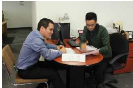
Oficinas de la Delegación de la Secretaría de Economía en N.L.

Asimismo, el permiso de Regla 8va el cual se encuentra establecido en el artículo 2, Fracción II de las Reglas Complementarias para la interpretación de la TIGIE, es un instrumento de comercio exterior el cual requiere de autorización previa por parte de la Secretaría para importar maquinaria y equipo, insumos, partes y componentes para la fabricación de productos, teniendo como finalidad apoyar la competitividad de la industria nacional al aplicar aranceles preferenciales. Se realiza a través de alguna de las fracciones arancelarias de la partida 98.02 de la TIGIE, lo que permite a las empresas fabricantes importar a través de una sola fracción arancelaria los componentes para utilizarse en sus procesos productivos.