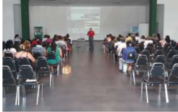
Taller PRONAFIM, Salón Polivalente en el Municipio de Guadalupe, Nuevo León

Gracias a este Sistema Nacional de Garantías en el ejercicio 2017 se apoyaron 4,161 empresas con una derrama económica de $2,240.9 mdp de los cuales el 40% fueron micro empresas, el 21% medianas y el 39% pequeñas empresas de los sectores de industria, servicio y comercio de Nuevo León.