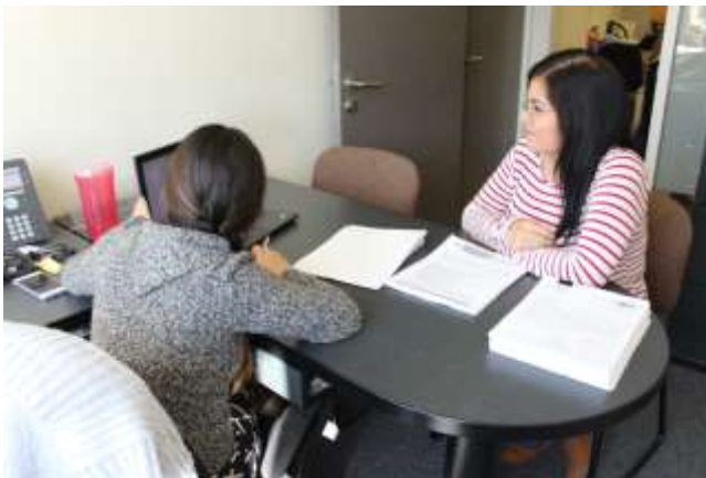
Oficinas de la Delegación de la Secretaría de Economía en N.L.

Las políticas de fomento y operación implementadas por el gobierno de México han permitido que la Industria Manufacturera se haya convertido en el factor más dinámico dentro de la industria nacional durante los últimos años. México ha logrado incursionar satisfactoriamente en el mercado internacional, gracias a su cada vez mayor nivel de competitividad en el ramo de las manufacturas.