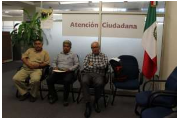
Sala de Espera, Delegación de la Secretaría de Economía en N.L.

Consciente de la necesidad de apoyar la vinculación entre los diversos eslabones de las cadenas productivas, la Secretaría de Economía, conjuntamente con otras dependencias del Gobierno Federal, ha instrumentado diversos apoyos destinados a fortalecer y desarrollar el ramo productivo del país, entre el que destaca PROSEC (Programa de Promoción Sectorial), el cual otorga aranceles preferenciales para empresas productoras, con el objeto de que adquieran insumos y maquinaria, necesarios para sus procesos productivos a precios competitivos.