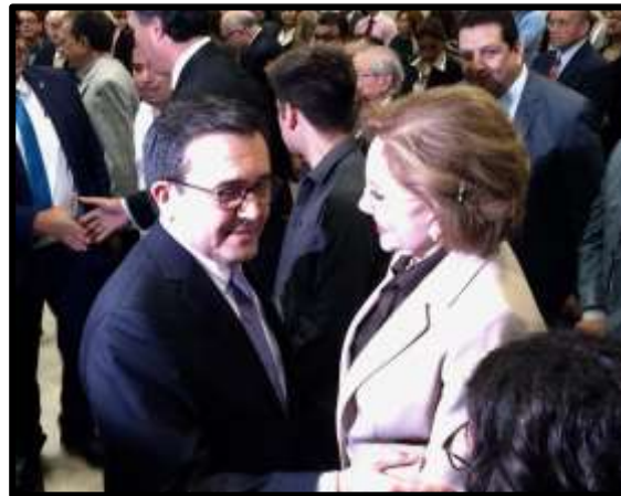
Reunión del Consejo Directivo de CAINTRA