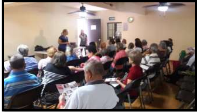
Ilustración 3. “Departamento de Educación y Divulgación”

En cuanto a las líneas estratégicas institucionales consistentes en “Fortalecer el poder de los consumidores brindándoles información y asesoría” y “Desarrollar proveedores conscientes e informados para que ejerzan sus derechos y cumplan sus obligaciones con los consumidores”, durante el 2018 se llevaron a cabo talleres y capacitación a grupos de consumidores en sesiones educativas sobre el consumo adecuado de los productos y servicios, a fin de que contaran con mayores herramientas y conocimiento de sus derechos, para una adecuada defensa ante los proveedores, así como que tuvieran la libertad para decidir en las contrataciones, otorgándoles información y facilidades para la defensa de sus derechos y en contra de la publicidad engañosa y abusiva.