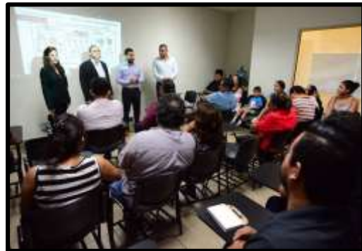
Capacitación a Proveedores N.L.

El Instituto Nacional del Emprendedor (INADEM) implementó la convocatoria 1.1 “Desarrollo de Redes y Cadenas Globales de Valor” a la cual en este 2017 se destinaron $ 77,396,200.68 pesos en Nuevo León para apoyar en la vinculación de Pequeñas y Medianas empresas, Gobiernos Estatales, Empresas Integradoras y Clústeres, con grandes empresas que promueven el desarrollo de proveedores nacionales e internacionales, fomentando con esto, el mejoramiento de la productividad y competitividad de la industria y empresa mexicana. Como resultado de esta convocatoria se aprobó en Nuevo León el proyecto denominado “Fabricación de Tanques de Carburación y Cilindros” de la empresa “METSA” con una inversión total de $16,964,000.00 de pesos, de los cuales el INADEM aportó el 65%.