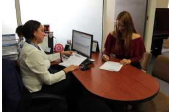
Oficinas de la Delegación de la Secretaría de Economía en N.L.

El Aviso automático de importación de productos siderúrgicos se presenta en la Ventanilla Digital mexicana de Comercio Exterior (VUCEM), se presenta un aviso por fracción arancelaria, por país de origen o procedencia y por Certificado de molino o de calidad, sin que se excluya la posibilidad de que un certificado pueda ser utilizado en distintos avisos, siempre y cuando del conjunto de avisos correspondientes, no se exceda el monto que ampare dicho certificado