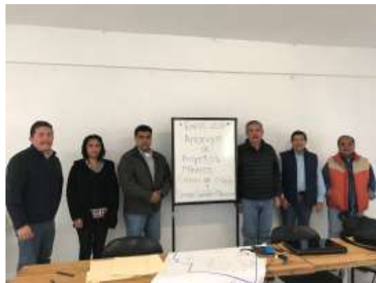
Arranque de Proyectos Mineros en Nuevo León

Además, se llevó a cabo el levantamiento de datos geológico-mineros de 1,302 kilómetros cuadrados, para ser integrados en tres cartas a escala 1:50,000: Bustamante, Los Nogales y La Hediondilla, las cuales se ubican en zonas de los municipios de Bustamante, Cerralvo y Galeana. Esta información, permite conocer las características y propiedades de los materiales presentes en esas regiones. La inversión destinada para tal fin, ascendió a 1.8 mdp.