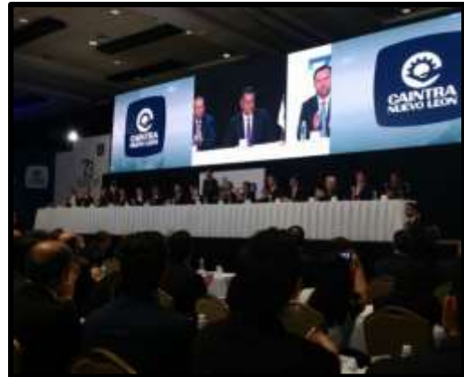
Conferencia "Política Comercial de México en un entorno complejo y cambiante".

Asimismo, el 23 de agosto de 2017 acudió al 5º Foro de Financiamiento de Infraestructura Estratégica de la Cámara Mexicana de la Industria de la Construcción Delegación Nuevo León. El 26 de septiembre al evento "Entrega de la presea Pedro Maiz Arsuaga" organizado por la Cámara de Comercio de Monterrey y representó el 28 de noviembre de 2017 al Secretario de Economía en la Inauguración de la Expansión de la empresa National Material of México.