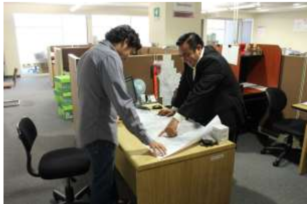
Instalaciones de la SE en Nuevo León

En la Agencia de Minería, se registran las Solicitudes de Concesión (formato FSE-010-001), en forma consecutiva, que es inicio a todo trámite, para la obtención del título minero y la recepción de Trabajos Periciales, subsecuentes a la solicitud. En 2017 se otorgaron la cantidad de 540 asesorías, en las necesidades de información de los numerosos concesionarios, en los primeros meses de 2018 se han asesorado a 179 usuario, explicando los requisitos, dudas, aclaraciones en los diferentes trámites que la normativa minera establece.