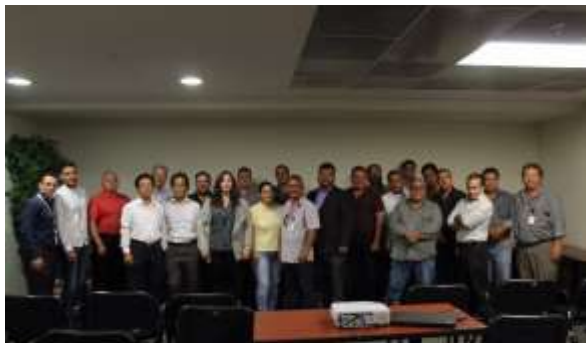
Plática de Créditos con miembros de la Asociación Mexicana de la Industria de la Construcción en N.L. Sala de Usos Múltiples.

Por lo anterior, la Secretaría de Economía en colaboración con Nacional Financiera, comparten con los intermediarios financieros, bancarios y especializados, el riesgo del crédito