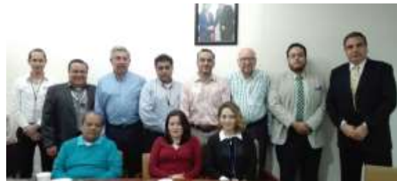
Fotografía tomada en reunión de trabajo con empresario líder del sector vidriero en la región en la Delegación Federal de la Secretaría y FIFOMI, el día 18 de enero de 2018