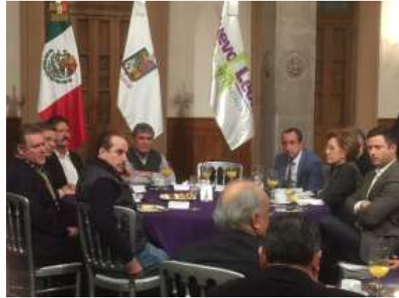
Patio de honor de Palacio de Gobierno. Zaragoza y 5 de mayo. Centro de Monterrey, Nuevo León

El 25 de enero, se realizó la Inauguración de la Exposición Tecnológica y a la firma de convenio TEC-Instituto Mexicano de la Propiedad Industrial (IMPI) en el Pabellón Tec.