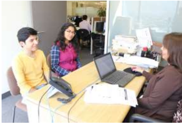
Oficinas de la Delegación de la Secretaría de Economía en N.L.

La Ley de Inversión Extranjera establece los diversos sujetos de inscripción ante el RNIE: