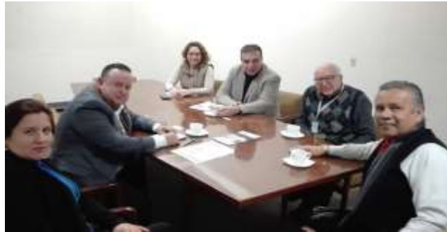
Fotografía tomada en reunión de la Delegación Federal de la Secretaría y FIFOMI, con Autoridades de Gobierno del Estado y del SGM, a fin de atender a Organizaciones de Mineros de la Entidad, el día 20 de febrero de 2018

La Gerencia, Promueve los programas de apoyo financiero a la minería durante todo el año en curso, de capacitación y de asistencia técnica, dedicación los siguientes datos: