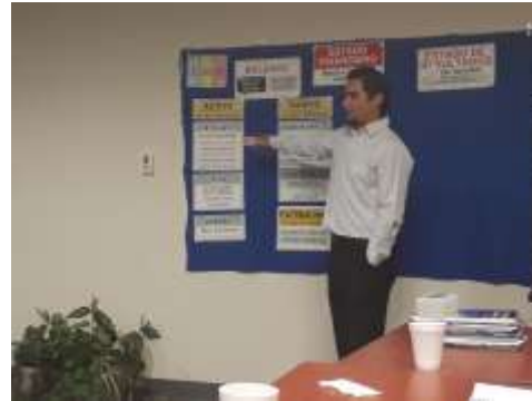
Taller de la RAE, 5 de abril de 2017. Sala de Usos Múltiples de la Delegación de Economía en N.L.

En relación a las incubadoras reconocidas, en Nuevo León a la fecha hay 8 incubadoras básicas, 3 de alto impacto y 4 aceleradoras.