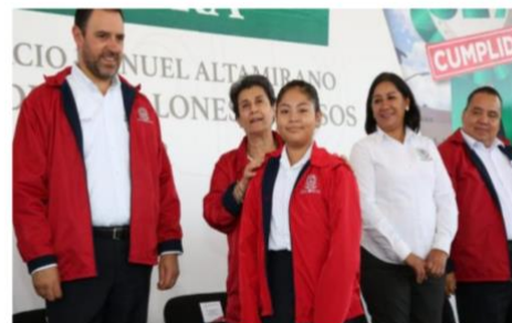
Beneficia gobierno de Tello con uniformes escolares a más de 184 mil alumnos de primaria

ZACATECAS (21/ago/2018). Alumnos de 1.565 primarias públicas de todo el estado fueron beneficiados por el gobierno de Alejandro Tello, al recibir 600 mil uniformes conformados por chamarra, playera, falda y/o pantalón para el ciclo escolar 2018 - 2019, que recién inicia.