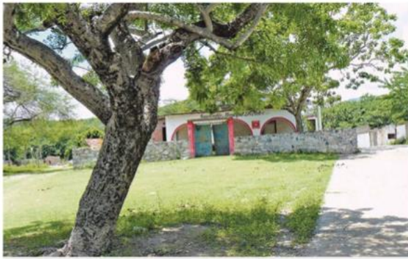
Los Elotes tiene una población de 65 habitantes / Angelina Albarrán

El lugar carece de fuentes de empleo, por lo que los jóvenes emigran de la localidad