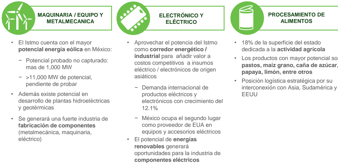
Ilustración 3 Principales Vocaciones Productivas de la ZEE de Salina Cruz