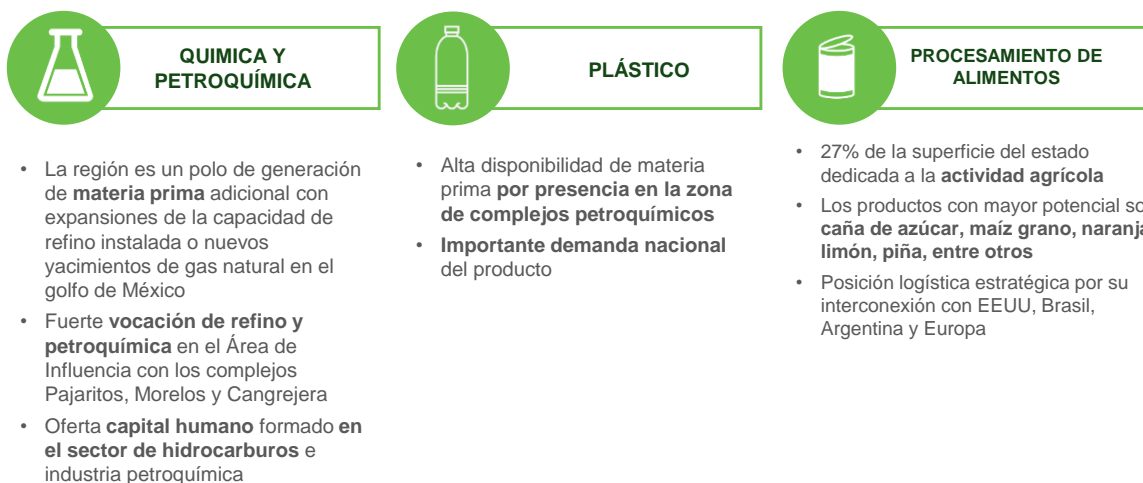
Ilustración 3 Principales Vocaciones Productivas de la ZEE de Coatzacoalcos

Notas: 1) SSA México; 2) SCT; 3) API Lázaro Cárdenas; 4) Anuario Estadístico de la Minería Mexicana 2015, Edición 2016; Referirse a los anexos para ver los casos de negocio de los sectores con mayor potencial