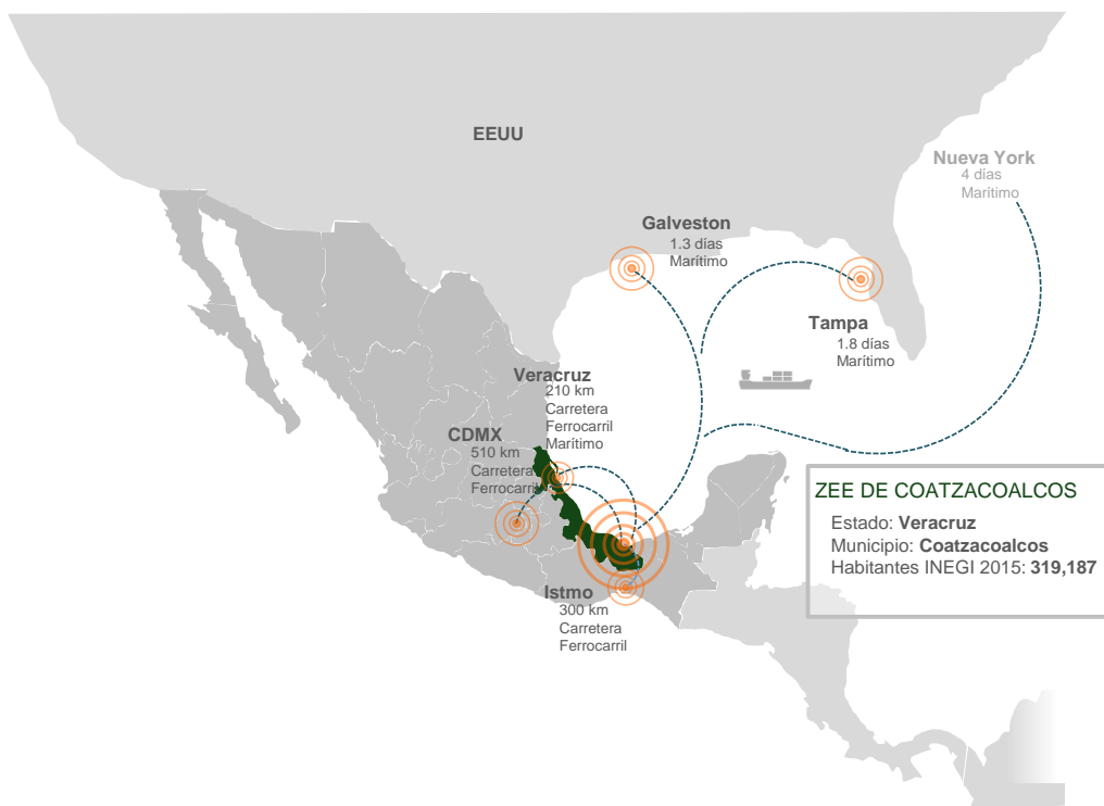
Mapa 1 Ubicación Estratégica