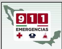
En caso de emergencia marca al 911