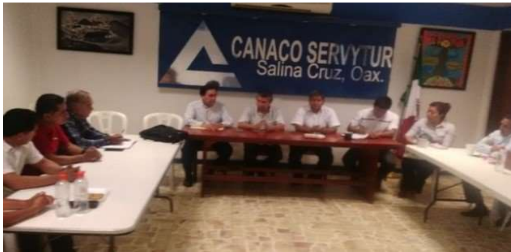
Promoción de Programas de la SE y del INADEM 2018 a Empresarios de CANACO Salina Cruz, Matías Romero y Juchitán de Zaragoza - Abril 2018