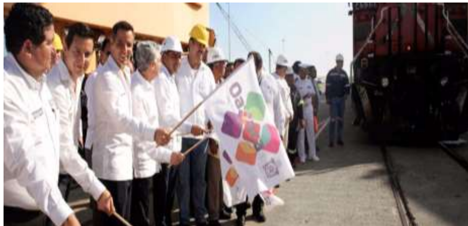
Reactivación del Ferrocarril de la Región del Istmo en Salina Cruz. Reunión con organismos empresariales de Oaxaca. Salina Cruz y Oaxaca de Juárez - Febrero 2018

En apoyo a la Secretaría de Economía Estatal y al IODEMC se participó en las siguientes actividades: Atención a la demanda de locatarios de la Federación de Mercados de Oaxaca; Firma del Convenio de Colaboración de la Zona Económica Especial de Salina Cruz; Reactivación del Ferrocarril de la Región del Istmo; Reunión en Oaxaca de Juárez con organismos empresariales y el Lic. Alejandro Murat Hinojoza, Gobernador Constitucional de Oaxaca; Reunión de planeación y realización de la feria itinerante NAFIN 2108 en Oaxaca de Juárez, Huajuapán de León y Santo Domingo Tehuantepec; Entrega de equipos TIC a beneficiarios de la convocatoria 4.1 del INADEM en Oaxaca de Juárez; Reinicio de la construcción de la súper carretera Oaxaca de Juárez-Costa; Rehabilitación del mercado público Paz Migueles de Oaxaca de Juárez; y Primera Reunión del Consejo Estatal de NAFIN. Con la Universidad Tecnológica de los Valles Centrales de Oaxaca (UTVCO) se colaboró en la entrega de 26 planes de negocios a Mipymes de Oaxaca.