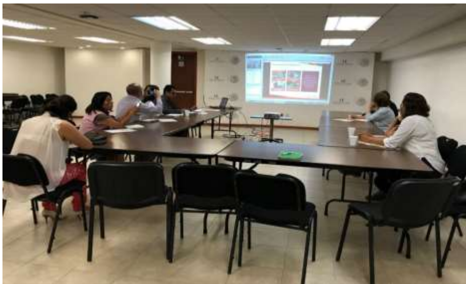
Presentación de la convocatoria "Incubación de actividades productivas" - Marzo 2018

Para el año 2018 se han realizado diversas actividades de promoción entre ellas la difusión de la convocatoria a asociaciones civiles, incubadoras de negocios y a instituciones educativas que estén realizando su labor con nuevos negocios para que participen en la convocatoria de incubación de actividades productivas. De enero a abril del 2018, se han beneficiado con microcréditos por este programa a 15,722 microempresarias(os), ubicados principalmente en el municipio de San Juan Bautista Tuxtepec.