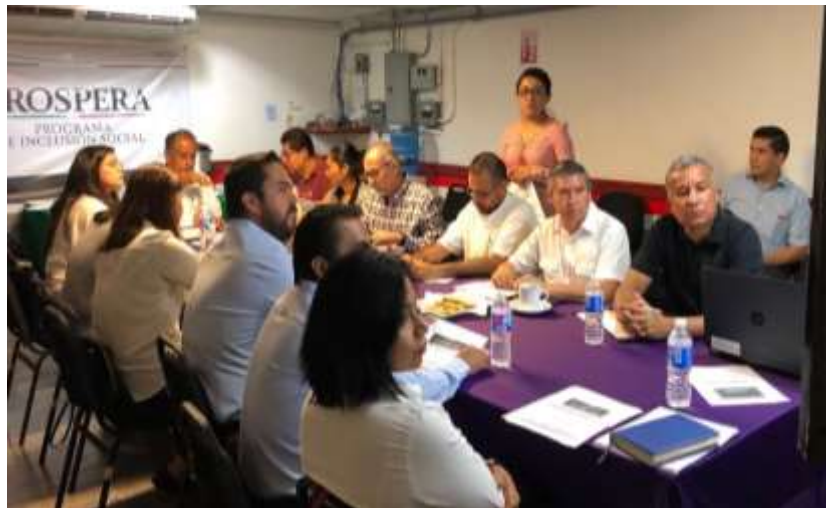
Primera y Segunda reuniones ordinarias del Comité Estatal Prospera Oaxaca. Oaxaca de Juárez - Marzo 2018

Nota: Elaborado con datos de la Coordinación General de Delegaciones Federales de la SE.