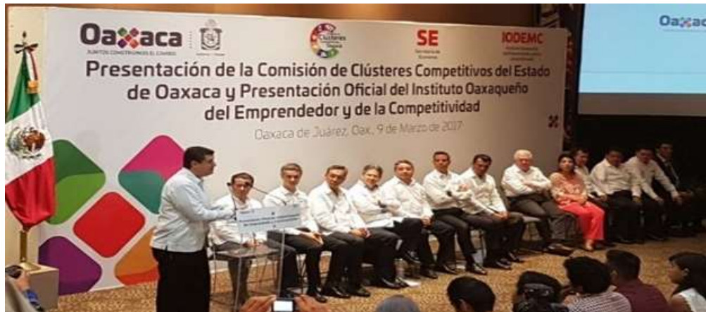
Establecimiento de la Comisión de Clústeres Competitivos del Estado de Oaxaca del Instituto Oaxaqueño del Emprendedor y de la Competitividad. Oaxaca de Juárez - Julio 2017

Huatulco y Puerto Escondido; habilitación de un Cluster de TIC; y construcción de tres mercados nuevos en San Pedro y San Pablo Ayutla Mixe, Santa María Colotepec y San José del Progreso; la implementación de talleres de capacitación para emprendedores en San Pedro Ixcatlán y el fortalecimiento de la industria del mezcal en la región de los Valles Centrales.