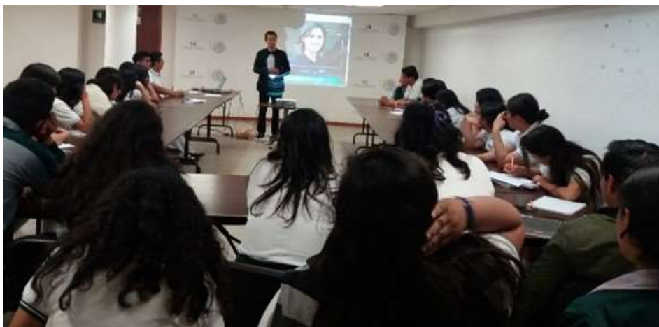
Promoción de Programas de la SE y del INADEM 2018 a Emprendedores del GECYTE Plantel 25 de San Pablo Huixtepec - Marzo 2018