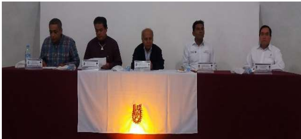
Seminario Ingeniero Emprendedor, Unidad Oaxaca – Escuela Superior de Economía del Instituto Politécnico Nacional, Unidad Oaxaca - Julio 2017

Con la finalidad de fomentar el desarrollo de los emprendedores y facilitarles el acceso a información y programas institucionales, se realizaron una serie de presentaciones en diferentes localidades de la entidad y en la sala de eventos de esta representación. Se llevaron a cabo talleres principalmente en temas de emprendimiento y modernización de microempresas, lo cual tuvo una intensa promoción aprovechando la participación que tiene la representación en los diferentes eventos coordinados con dependencias tanto del gobierno del estado como con las autoridades de diversos municipios de la entidad. Por otra parte, se realizó la promoción de los apoyos que se pueden obtener a través del Instituto Nacional del Emprendedor para generar y apoyar el emprendimiento y la modernización de microempresas.