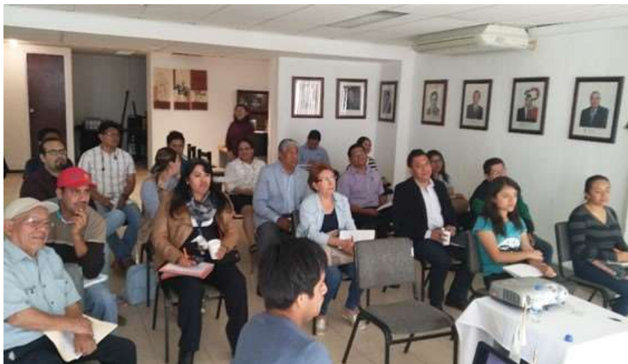
Exposición de los Programas de Financiamiento a Empresarios Afiliados a Canacintra Oaxaca – Noviembre 2017

Del monto total de la dispersión de recursos colocados, el 51.6% fue colocado entre las microempresas, y que a su vez representa el 73% del total de empresas atendidas, toda vez que en el estado, el mayor número de empresas se concentra en las micro que son las que contribuyan mayormente al crecimiento de la economía en el estado.