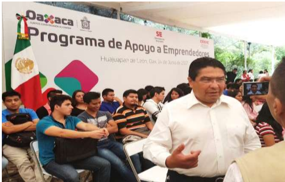
Presentación del programa de emprendedores en la Universidad Tecnológica de la Mixteca de Huajuapán de León - Mayo de 2017

y Santa María Colotepec en la región de la Costa; Huajuapán de León en la región de la Mixteca y Tlacolula de Matamoros, Santa Cruz Xoxocotlán, Zaachila y Ciudad de Oaxaca de Juárez en Valles Centrales.