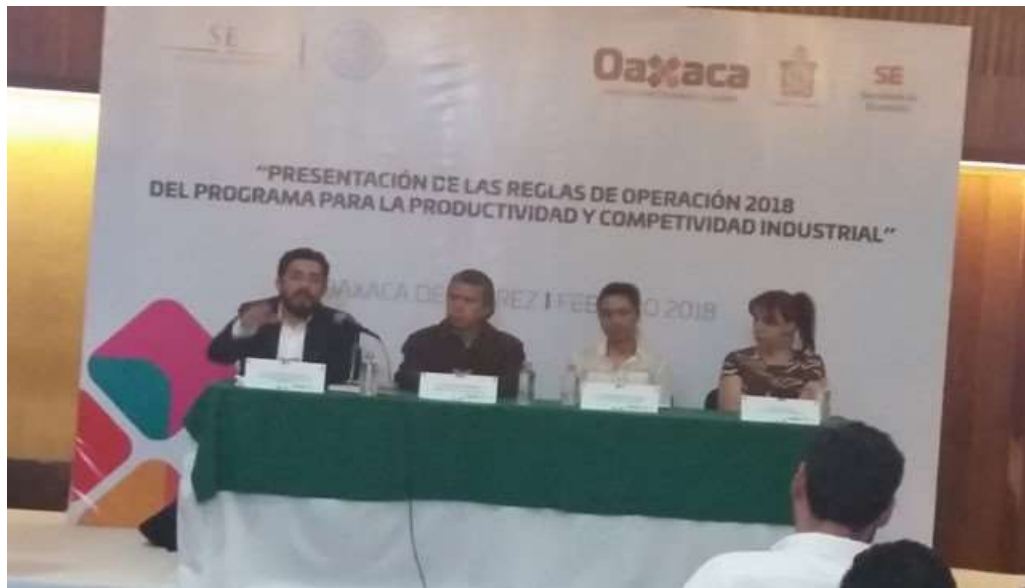
Presentación de las Reglas de Operación del PPCI -2018, Centro Cultural y de Convenciones de Oaxaca - Febrero del 2018