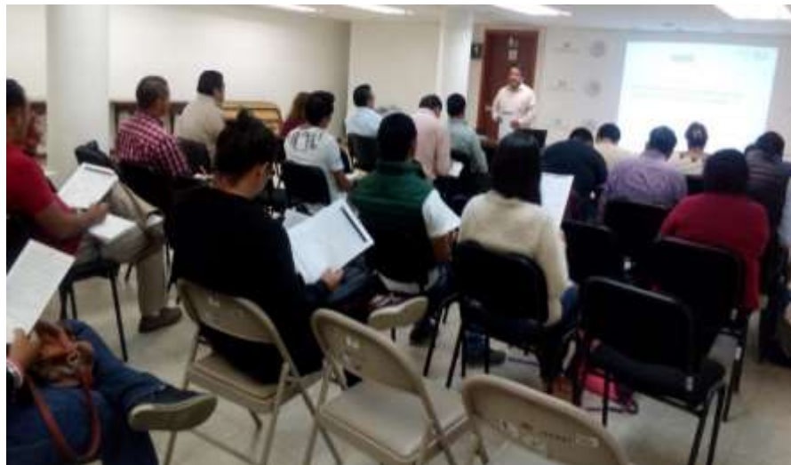
Realización de talleres con aliados de la Red (IMPI) - Junio 2017

Como parte de los servicios que ofrece la RAE en esta representación federal, el asesor después de registrar al empresario o emprendedor en la plataforma lo orienta para participar en el programa denominado Crezcamos Juntos, programa que el INADEM considera como prioritario y en el cual se han venido teniendo buenos resultados con solicitantes que han obtenidos apoyos y financiamiento.