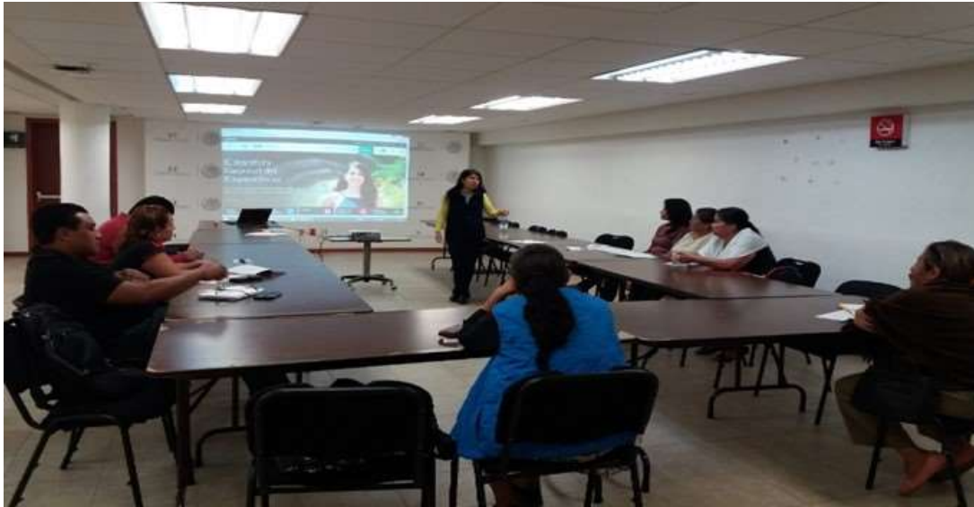
Promoción de Programas de la SE y del INADEM 2018 a Emprendedores de la Asociación Civil NECA - Marzo 2018