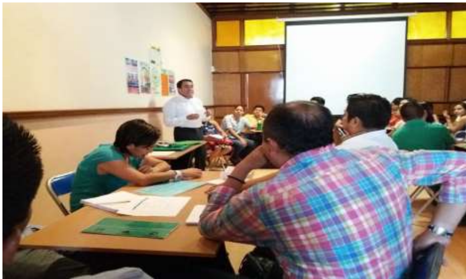
Taller para emprendedores ( Simulador de Negocios) efectuado en la Dirección de Desarrollo Económico Municipal del Ayuntamiento de la Ciudad de Oaxaca - Agosto 2017

Derivado de la coordinación que se tiene con el Gobierno Municipal de la Ciudad de Oaxaca de Juárez se realizó el taller de emprendedores dirigido a personas que tienen el interés en desarrollarse como futuros empresarios concretando la creación de una microempresa.