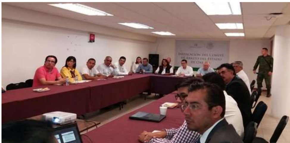
Instalación del Comité de Abasto Privado - Abril 2017

Como parte de las actividades a cargo de la Secretaría de Economía de lo relacionado a las actividades económicas del Estado, el Delegado Federal funge como presidente de la instalación del comité de abasto en caso de contingencias naturales, ya que en caso de que se presente algún desastre natural este comité opere de manera inmediata, por ello como cada año se tiene el compromiso de realizar la instalación de dicho comité, para el año 2017 este comité fue instalado el 7 de abril contando con la asistencia de los principales actores que tienen la encomienda de atender emergencia en casos de, como son: Comerciantes Mayoristas, Gobierno del Estado de Oaxaca, Secretaría de Gobernación, Comisión Nacional del Agua ; Instituto Estatal de Protección Civil, Secretaría de Comunicaciones y Transportes; Secretaría de Desarrollo Social, Policía Federal; Secretaría del Medio Ambiente y Recursos Naturales, Comisión Federal de Electricidad, Cámaras de Comercio, Instituciones Bancarias, Procuraduría Federal del Consumidor y Secretaría de la Defensa Nacional.