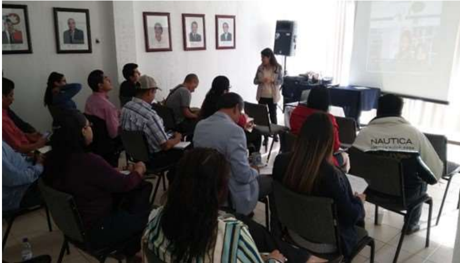
Presentación de la REA a Mipymes, socios de Canacintra - Octubre 2017

Como parte de los servicios que ofrece la RAE en esta representación federal, el asesor después de registrar al empresario o emprendedor en la plataforma lo orienta para participar en el programa denominado Crezcamos Juntos, programa que el INADEM considera como prioritario y en el cual se han venido teniendo buenos resultados con solicitantes que han obtenidos apoyos y financiamiento.