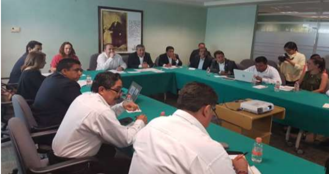
Reunión de trabajo con el Secretario de Economía del Gobierno de Oaxaca y el Director General del Instituto Mexicano de la Propiedad Industrial (IMPI. Tlalixtac de Cabrera - Agosto 2017

En el mismo año 2017, se realizó conjuntamente con personal del INADEM, la Secretaría de Economía Estatal y BanOaxaca tareas de revisión y validación de documentación para definir apoyos a Mipymes siniestradas por los Sismos ocurridos en septiembre de dicho año en 41 municipios del Istmo de Tehuantepec, teniendo como sedes las ciudades de Juchitán de Zaragoza, Ciudad Ixtepec, El Espinal, Santo Domingo Tehuantepec y Salina Cruz. En este programa se lograron otorgar apoyos económicos a 1,200 empresas.