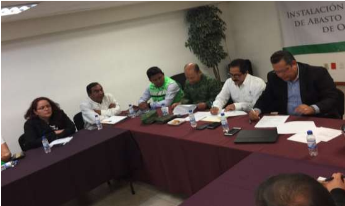
Instalación del Comité de Abasto Privado - Abril 2018

En esta ocasión se contó con la asistencia de: Comerciantes mayorista, Gobierno del Estado, Secretaría de Gobernación, Comisión Nacional del Agua; Instituto Estatal de Protección Civil, Secretaría de Comunicaciones y Transportes; Secretaría de Desarrollo Social, Secretaría del Medio Ambiente y Recursos Naturales, Comisión Federal de Electricidad, Instituciones Bancarias, Procuraduría Federal del Consumidor y Secretaría de la Defensa Nacional.