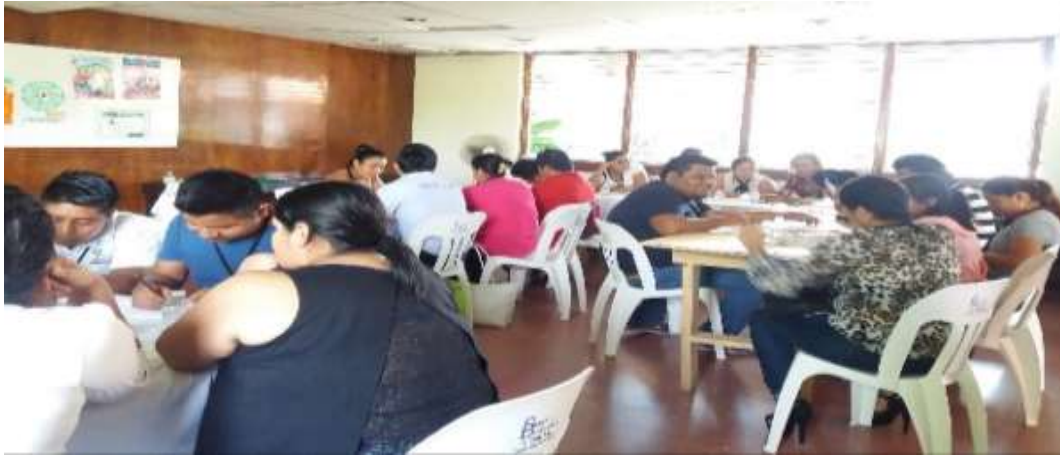
Curso de Mercadotecnia y Taller para Emprendedores (Simulador de negocios) realizado durante el Congreso Empresarial Tuxtepec - Mayo del 2017

En materia de campañas y talleres para fomento de la cultura emprendedora, se considera importante destacar los 12 talleres realizados en 2017, en los que se capacitaron a 256 emprendedores y microempresarios de diferentes municipios de la entidad., en coordinación con instituciones educativas de niveles superior y medio superior de Oaxaca, y Ayuntamientos de San Juan Bautista Tuxtepec, Oaxaca de Juárez y Santa Lucía del Camino. Universidad La Salle, Plantel COBAO de Tlacolula de Matamoros y Programa Punto México Conectado de la SCT Oaxaca