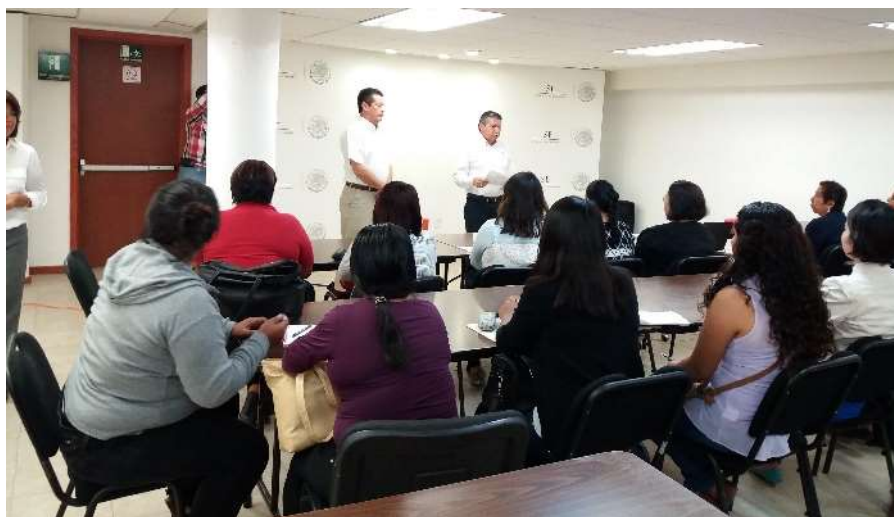
Taller de Emprendedores y Marketing realizado en la Delegación de la SE - Abril 2017