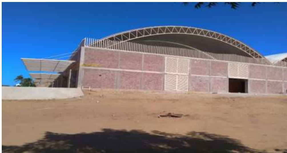
Mercado Hidalgo de Puerto Escondido, Santa María Colotepec. En proceso de terminación y entrega recepción a la autoridad municipal - Diciembre 2017