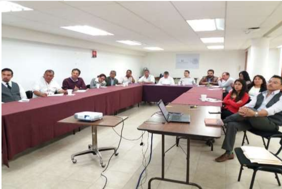
Diálogos por la Competitividad. Oaxaca de Juárez - Abril 2017