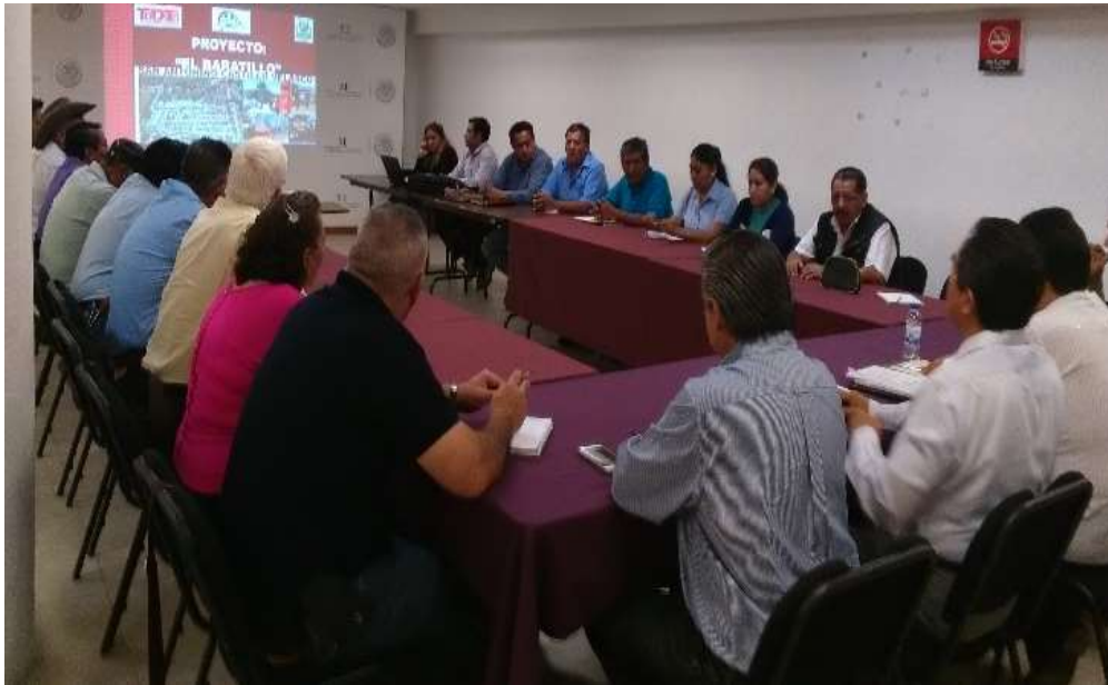
Presentación de proyectos de mercados de los municipios de Ocotlán de Morelos, San Dionisio Ocotepc y San Antonino Castillo Velasco, Oaxaca. Oaxaca de Juárez - Abril 2018