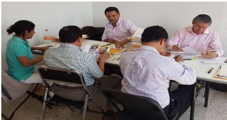
Apoyo de personal de la Delegación Federal a la Secretaría de Economía Estatal en la revisión y validación de documentos de Mipymes para el Programa Emergente "Sumemos por Oaxaca". Oaxaca de Juárez. Febrero 2017.

Al término del programa, el Gobierno Estatal dispersó 3,400 apoyos económicos a negocios del Municipio de Oaxaca de Juárez y también atendió favorablemente a otras ciudades y municipios del interior del estado otorgando otros 3,600 apoyos.