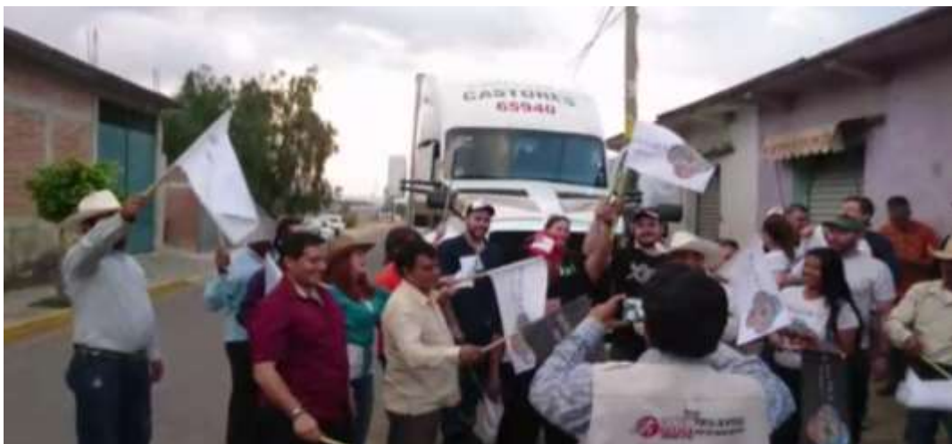
Banderazo de salida del embarque de Productores de Maguey y Mezcal Los Tres Reyes, S.P. R DE R.L. - Abril 2018

Las empresas que obtuvieron su registro en este programa durante el año 2017 fueron: Metamorfosis de Metales, S.A de C.V. con actividad de acabado y limpieza de metales y Single Palenque, S.A de C.V. con el proceso de envasado y comercialización de mezcal. El 8 de enero de 2018, la empresa Productores de Maguey y Mezcal Los Tres Reyes, S.P. R DE R.L., ingresó una solicitud nueva para el programa IMMEX, la cual se autorizó para importar envase, empaque y embalaje para la transformación de su producto final y enviarlos hacia la Unión Americana Mezcal con su marca Wahaka.