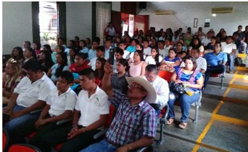
Primer Congreso Empresarial Tuxtepec 2017. Casa de la Cultura Tuxtepec- Mayo 2017

En este sentido la representación realizó la difusión y promoción del Programa para la Productividad y Competitividad Industrial 2017, siguiendo la ruta enmarcada en las políticas y programas definidos en el Plan Nacional de Desarrollo para contribuir a la Integración de un mayor número de empresas a las cadenas de valor y mejorar su productividad.