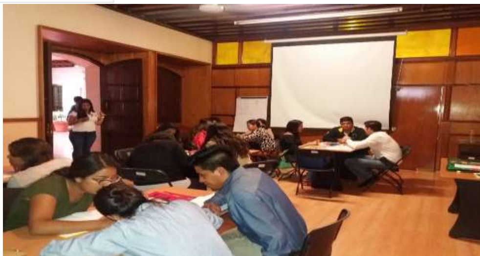
Taller para Emprendedores ( Simulador de Negocios ) realizado en las oficinas de la CTM Oaxaca – Agosto 2017

Esta Delegacion en 2017 participó con talleres exposiciones con diferentes Instituciones de Educacion media y Superior de diferentes regiones del Estado: