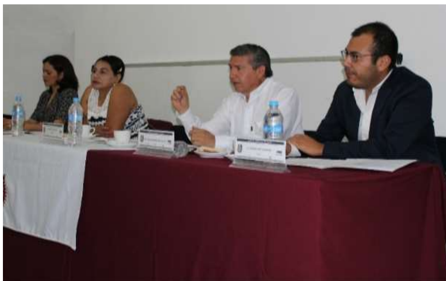
Presentación de proyectos CEC-IPN y de convocatorias del INADEM relacionadas con la Innovación. Santa Cruz Xoxocotlán - Febrero 2017

En lo correspondiente al periodo enero abril del 2018, se realizaron acciones de fomento a proyectos innovadores. En marzo se participó en el evento de presentación de proyectos en el Centro de Educación Continua del Instituto Politécnico Nacional (CEC-IPN OAXACA) ubicado en Santa Cruz Xoxocotlán en el cual se difundieron los contenidos de la convocatoria del INADEM, 2.1 Fomento a las Iniciativas de Innovación, y de otras dos convocatorias que se relacionan con procesos de innovación, como son la 2.4 Incubación de Alto Impacto, Aceleración de Empresas y Talleres de Alta Especialización y 3.1 Apoyo a Emprendimientos de Alto Impacto.