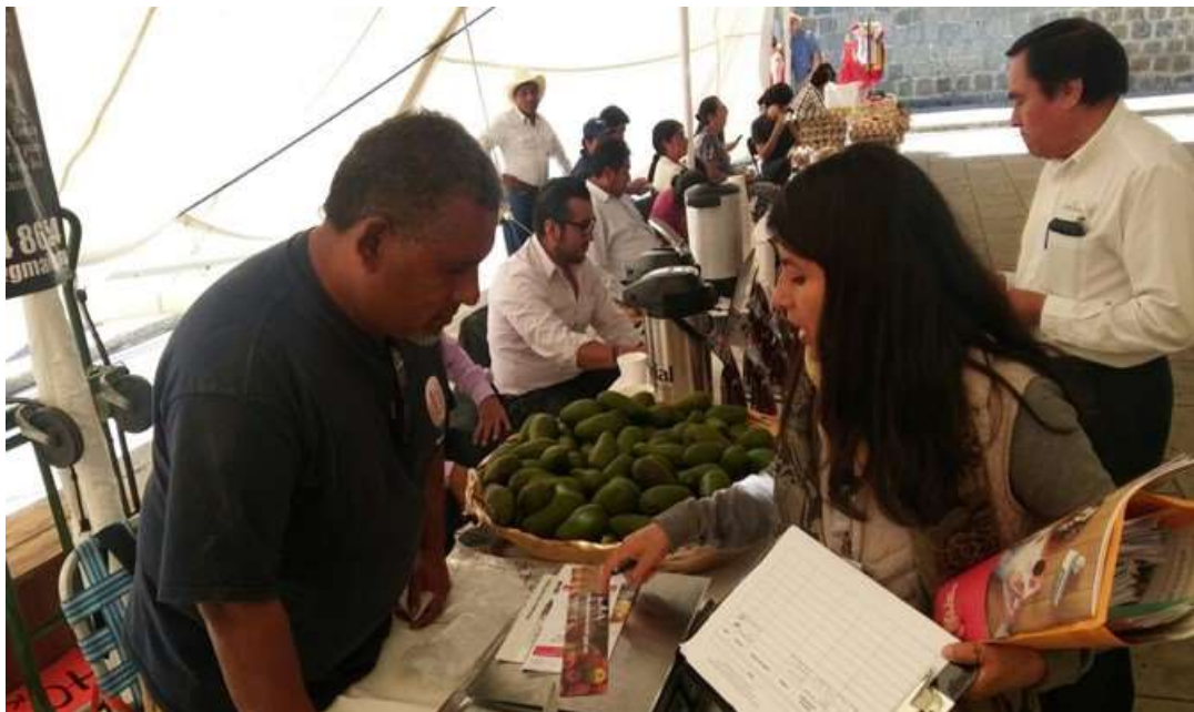
Difusión del SNIIM en la 4ta Expo Feria de la Economía Social - Octubre 2017

Para el año 2017, en la Expo Feria que organizó el instituto de la Economía Social, se nos invitó a participar para dar a conocer los servicios que ofrece el SNIIM a la población, a la cual le explico la forma de acceder a la información que se ofrece a través de esta plataforma y pueda ser de utilidad, indicándoles cómo realizar búsquedas en materia de: precios, ferias nacionales, estatales, así como su interpretación.