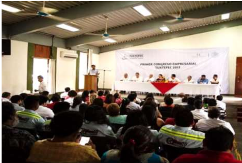
Primer Congreso Empresarial Tuxtepec 2017. Casa de la Cultura Tuxtepec- Mayo 2017