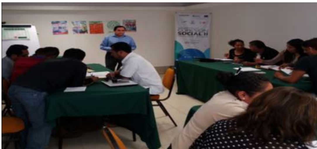
Taller para Emprendedores ( Simulador de Negocios ) realizado en las instalaciones de la Universidad La Salle Campus Oaxaca – Marzo 2018