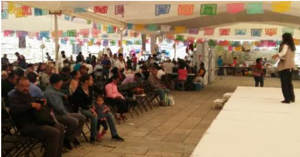
Presentación del programa de PRONAFIM a grupos solidarios de INAES - Octubre 2017

La labor de la delegación es la promoción del programa entre la población objetivo, por lo que, en el 2017, se realizaron difusiones entre la población objetivo, en coordinación con el municipio de Zaachila, en eventos de dependencias federales como INAES; PROSPERA, contando con la asistencia de varias Asociaciones Civiles que acudieron a esta representación a conocer las reglas de operación de la convocatoria de apoyo para la Incubación de actividades productivas 2017.