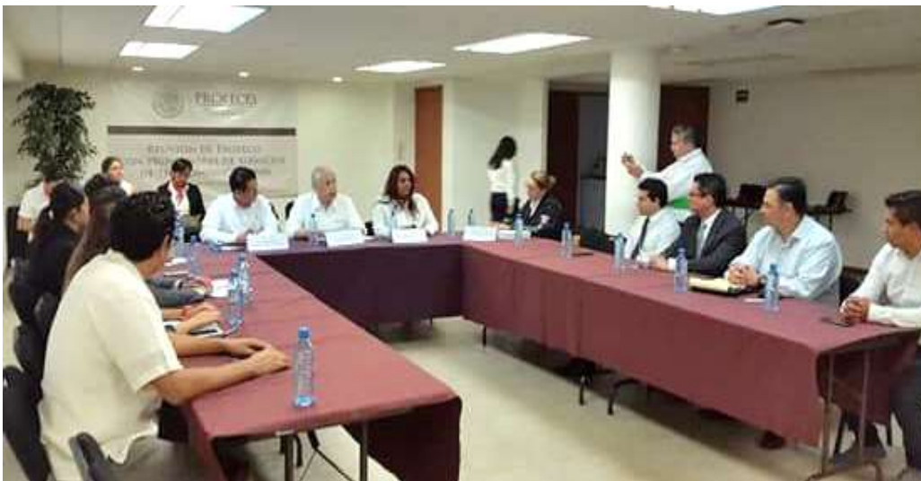
Reunión con Proveedores de servicios de Telecomunicaciones en Oaxaca con el Subprocurador de Telecomunicaciones de PROFECO. Oaxaca de Juárez. Julio 2017

Durante 2017 el personal de la Delegación Federal participó en diferentes eventos de promoción de productos oaxaqueños para consumo nacional y para exportación celebrados en la entidad. En estos eventos se contó con la participación de funcionarios federales, estatales y municipales, empresas comercializadoras, productores y emprendedores, a quienes se les presentaron las oportunidades que existen para proveeduría en mercados locales y regionales de Oaxaca. Para fomentar la proveeduría se realizó una reunión en donde se promovió el uso de los portales en línea del Sistema Nacional de Investigación de Mercados (SNIIM) y del Sistema Compranet de la Secretaría de la Función Pública, así como también se invitó a los proveedores a que tengan un acercamiento con la Delegación de la Procuraduría Federal de Consumidor, con la finalidad de establecer un mejor ambiente de intercambio comercial entre proveedores, intermediarios y consumidores.