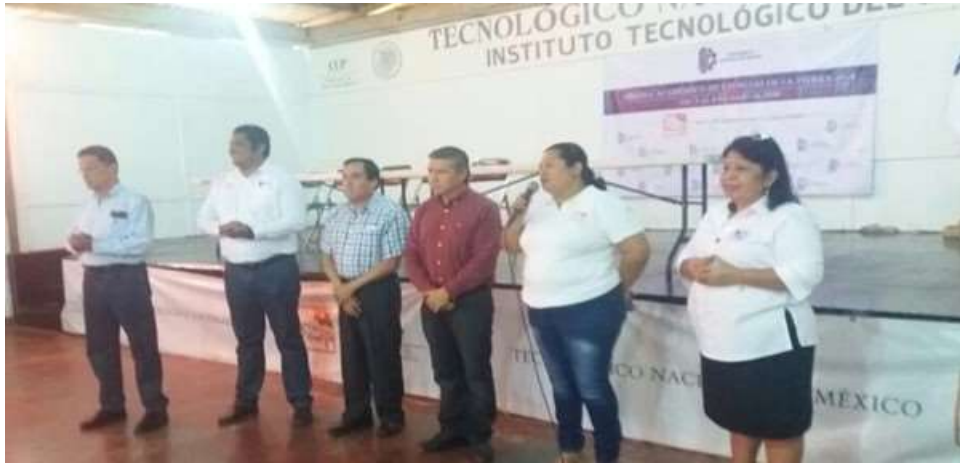
Promoción de Programas de la SE y del INADEM 2018 a Emprendedores en Juchitán de Zaragoza y Empresarios en Santo Domingo Tehuantepec – Abril 2018