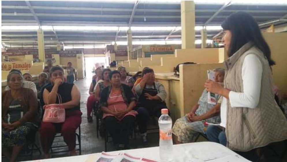
Exposición de los Programas de Financiamiento a Mujeres del Mercado Municipal de Santa Cruz Xoxocotlán– Agosto 2017

Del monto total de la dispersión de recursos colocados, el 51.6% fue colocado entre las microempresas, y que a su vez representa el 73% del total de empresas atendidas, toda vez que en el estado, el mayor número de empresas se concentra en las micro que son las que contribuyan mayormente al crecimiento de la economía en el estado.