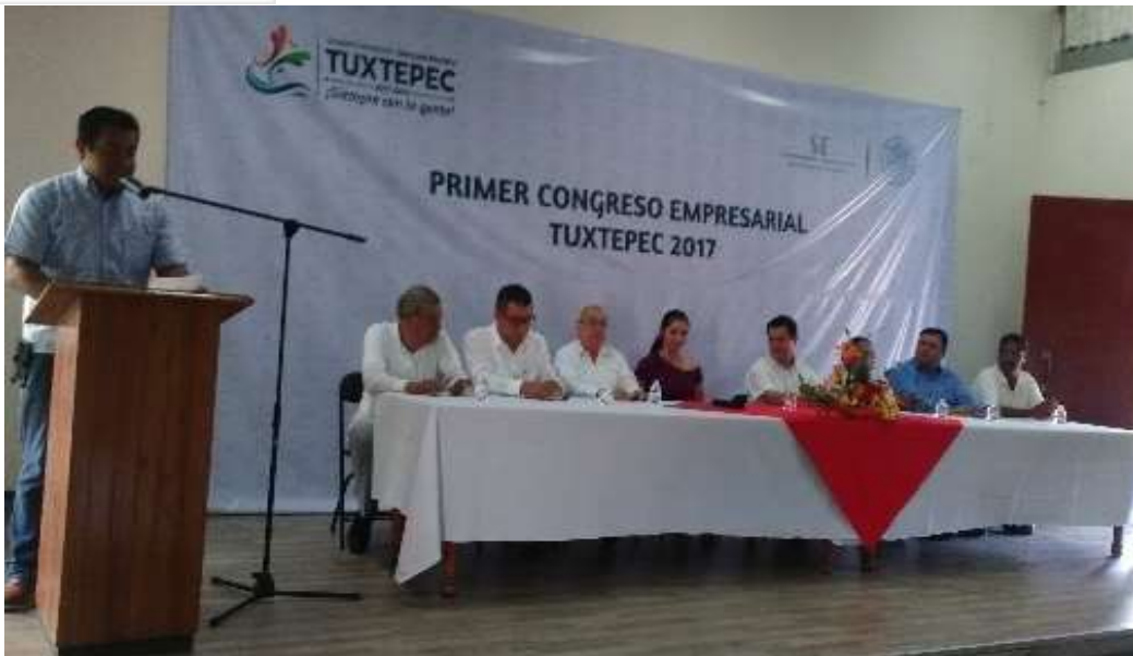
Primer Congreso Empresarial Tuxtepec 2017 con empresarios y Proveedores de Productos Agroindustriales y Microempresarios Fabricantes de Muebles de Maderas Preciosas de San José Chiltepec. San Juan Bautista Tuxtepec - Mayo 2017

Para incentivar el uso de estímulos públicos entre diversos proveedores y productores se difundió entre la comunidad empresarial el proceso de gestión de las convocatorias denominadas 1.1.- Redes y Cadenas Globales de Valor y 1.2.- Productividad Económica Regional del Instituto Nacional del Emprendedor (INADEM), que han sido diseñadas para fortalecer la proveeduría, así como de otros programas que pueden coadyuvar como es el caso del Programa de Productividad y Competitividad Industrial del año 2017.