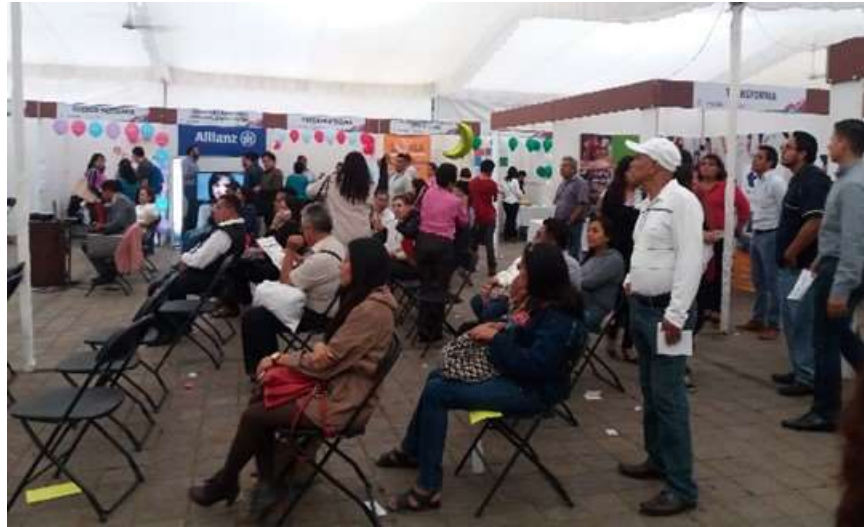
Expo emprendedores realizada por la Dirección de Desarrollo Municipal del Ayuntamiento de Oaxaca de Juárez, en el Parque el Llano de la Ciudad de Oaxaca - Agosto 2017

Derivado de la coordinación que se tiene con el Gobierno Municipal de la Ciudad de Oaxaca de Juárez se realizó el taller de emprendedores dirigido a personas que tienen el interés en desarrollarse como futuros empresarios concretando la creación de una microempresa.