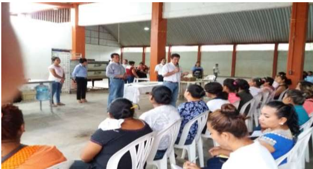
Reunión con mujeres emprendedoras y microempresarias de San José Chiltepec - Mayo del 2017

En la región del Papaloapan en coordinación con el H. Ayuntamiento de Tuxtepec, se participó en el Primer Encuentro Empresarial 2017, en el que se realizaron diversos talleres y presentaciones de los programas y servicios de la SE y que tuvo una afluencia de 375 personas de la Universidad de Papaloapan, (UNPA), Instituto Tecnológico de Tuxtepec (ITT), Institutos de Estudios de Bachillerato del Estado de Oaxaca (IEBO 58 y IEBO 066), Instituto Tecnológico de Acayucan (ITA), Colegio de Bachilleres (COBAO 07), Universidad Madero de Puebla (UMAD), Centro de Bachillerato Tecnológico e Industrial (CBTIS 107), Cámara de Comercio, Servicios y Turismo de Tuxtepec (Canaco–Tuxtepec), y de los municipios de San Juan Bautista Tuxtepec, Nuevo Soyaltepec y Ayotzintepec. Por otra parte, con el ayuntamiento de Santa Lucía del Camino se realizó una jornada de talleres de apoyo a emprendedores y microempresarios de la localidad a fin de que conocieran los apoyos que el gobierno federal tiene para consolidar negocios a través del Instituto Nacional del Emprendedor.