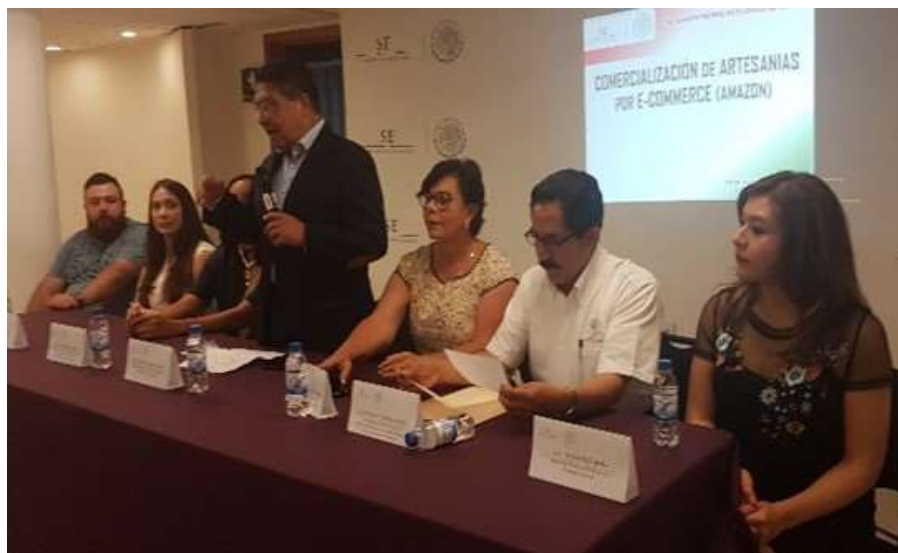
Presentación del Programa “Amazon Handmade”. Oaxaca de Juárez - Febrero 2018

El 23 de febrero del 2018 en instalaciones de esta Delegación Federal y en colaboración con autoridades del Municipio de Oaxaca de Juárez, se presentó a distintos proveedores de artesanías el programa y mesa de negocios “Amazon Handmade”, a efecto que los productores y comercializadores mejoren sus sistemas de proveeduría utilizando innovadores programas de mercadotecnia y publicidad a través de tiendas en línea de alcance internacional.