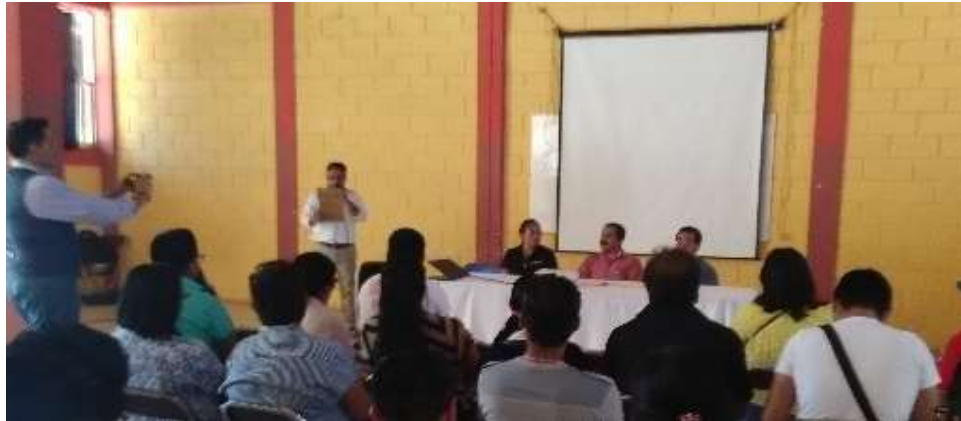
Jornada de Actualización Empresarial para MIYMES de la Región de la Mixteca. Huajuapán de León - Abril 2014