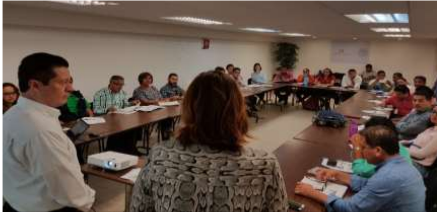
Taller de capacitación con la participación del Instituto Mexicano de la Propiedad Industrial (IMPI) de la Norma Oficial Mexicana NOM-070 SCFI 2016, Bebidas Alcohólicas para productores y empresarios oaxaqueños de la industria del mezcal – 26 de Abril 2017

Derivado de la promoción realizada por personal de la Delegación Federal de la Secretaría de Economía en Oaxaca sobre el contenido de la convocatoria 1.5 denominada Obtención de apoyos para proyectos de Mejora Regulatoria del Instituto Nacional del Emprendedor, en el año 2017 el Ayuntamiento de Oaxaca de Juárez y la Secretaría de Economía y el Poder Judicial del Gobierno del Estado de Oaxaca presentaron 5 proyectos para mejorar sus procesos regulatorios de registro de empresas, generar plataformas electrónicas y equipar 4 salas para juicios orales por un monto de 9.9 millones de pesos, solicitando al INADEM 6.2 millones de pesos (62%).