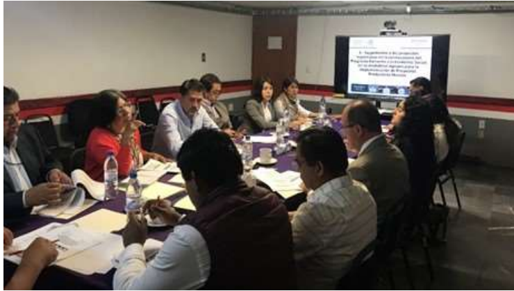
Participación de la Delegación Federal de la SE en las reuniones del Comité Técnico Estatal del Prospera, Programa de Inclusión Social. Oaxaca de Juárez. Julio 2017.

En 2017 a través del Programa de Financiamiento al Microempresario se dispersó en la entidad a 27,998 mujeres y 505 hombres un monto por 68.4 millones de pesos en calidad de microcréditos a través de tres entidades micro financieras. De este total 29.9 millones de pesos se aplicaron a 40 municipios del Programa de la Cruzada Nacional contra el Hambre y el Programa Nacional de la Prevención de la Violencia y la Delincuencia, cuyas características por región, municipio, acreditados mujeres y hombres y subtotales por municipio se desglosan a continuación: