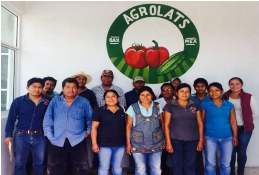
Personal de la empresa Dan Llia, S.P.R de R.I. Productores y Exportadores de Hortalizas - Agosto 2017

Con el Tratado de Libre Comercio de América del Norte, los productos perecederos se han visto beneficiados para realizar una buena comercialización en Canadá y los Estados Unidos de América. En este ámbito, las empresas Agro Bin Gansak, S.A de C.V. y Daan Llia, S.P.R de R.I., han logrado consolidar el tomate Oaxaqueño a buena escala y con gran calidad en dichos países.