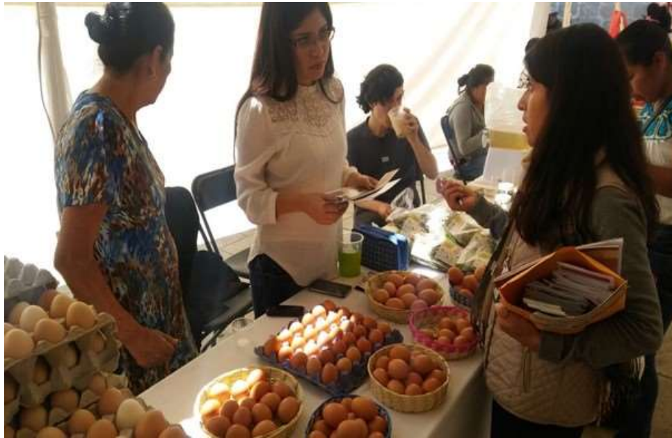
Difusión del SNIIM en la 4ta Expo Feria de la Economía Social - Octubre 2017

Para el año 2017, en la Expo Feria que organizó el instituto de la Economía Social, se nos invitó a participar para dar a conocer los servicios que ofrece el SNIIM a la población, a la cual le explico la forma de acceder a la información que se ofrece a través de esta plataforma y pueda ser de utilidad, indicándoles cómo realizar búsquedas en materia de: precios, ferias nacionales, estatales, así como su interpretación.