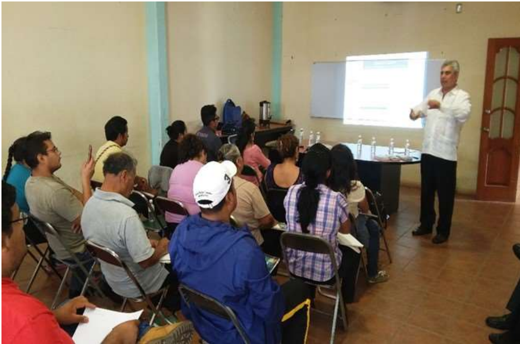
Taller de Financiamiento realizado conjuntamente con NAFIN y Banamex– Septiembre 2017

Dentro de los principales programas que se promovieron entre la población objetivo se encuentra Crédito joven, Crédito Mujer Pyme, Ven a Comer, Créditos de los Programas Emergentes por Desastres Naturales y los Créditos del Programa Crezcamos Juntos.