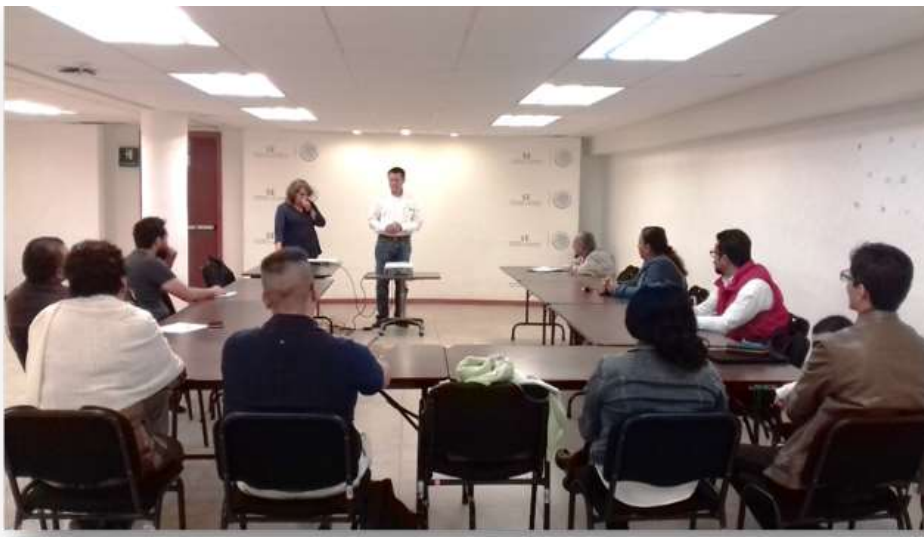
Taller de Patentes - Abril 2017