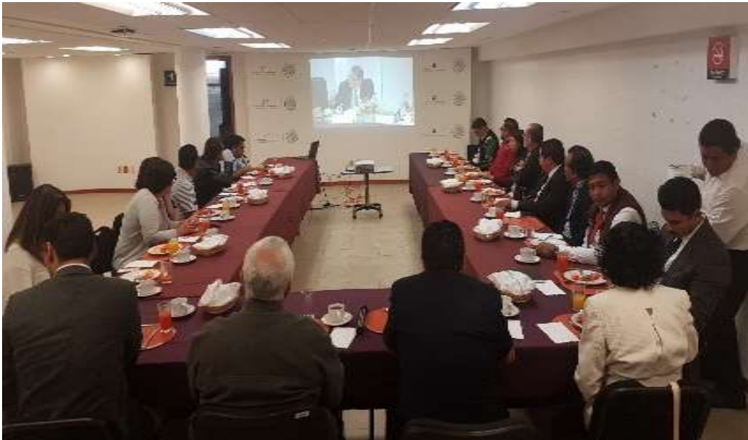
Presentación de "Diálogos Públicos Privados para la Competitividad". Oaxaca de Juárez - Febrero y Marzo 2018