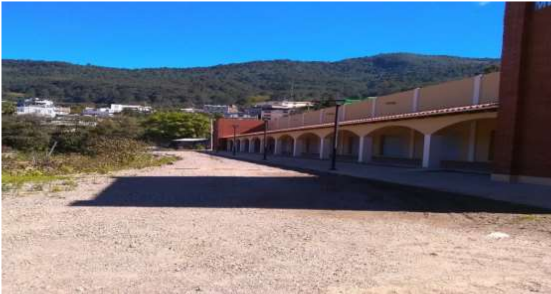
Mercado de San Pedro y San Pablo Ayutla Mixe, Oaxaca. En proceso de entrega y recepción a la autoridad municipal - Diciembre 2017