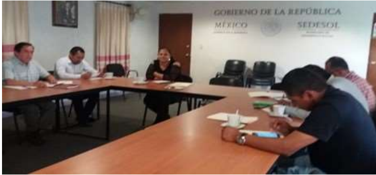
Reunión para Instalación del Comité 3x1 Migrantes de la SEDESOL-OAXACA Santa Lucía del Camino - Marzo 2018

reunión de instalación del Comité 3x1 Migrantes de la SEDESOL-OAXACA, en donde esta Delegación Federal apoya en la evaluación colegiada de proyectos productivos.