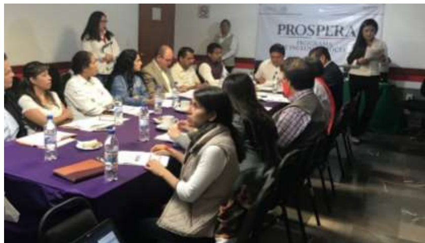
Participación de la Delegación Federal en reuniones del Comité Técnico Estatal del Prospera, Programa de Inclusión Social. Oaxaca de Juárez - Julio 2017

Durante el año 2017 se participó en reuniones mensuales del Comité Técnico Estatal de Oaxaca del “Prospera, Programa de Inclusión Social de la SEDESOL, en el cual se evalúan acciones de alimentación, salud y educación de personas en situación de pobreza que realizan dependencias federales de la Secretaría de Desarrollo Social, el Instituto Mexicano del Seguro Social (IMSS) y la Secretaría de Salud. Por petición del citado Comité se les dio a conocer el 12 de enero de 2017 el Programa Nacional de Financiamiento al Microempresario y la convocatoria 2.3.- Creación y Fortalecimiento de Empresas Básicas a través del Programa de Incubación en Línea (PIL), con la finalidad de su difusión a grupos de personas de su padrón de beneficiarios del interior de la Entidad.