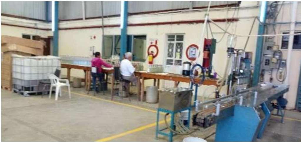
Instalaciones de la Empresa Single Palenque, S.A. de C.V

Las empresas que obtuvieron su registro en este programa durante el año 2017 fueron: Metamorfosis de Metales, S.A de C.V. con actividad de acabado y limpieza de metales y Single Palenque, S.A de C.V. con el proceso de envasado y comercialización de mezcal. El 8 de enero de 2018, la empresa Productores de Maguey y Mezcal Los Tres Reyes, S.P. R DE R.L., ingresó una solicitud nueva para el programa IMMEX, la cual se autorizó para importar envase, empaque y embalaje para la transformación de su producto final y enviarlos hacia la Unión Americana Mezcal con su marca Wahaka.