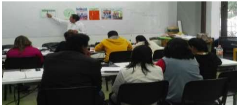
Taller para emprendedores (Simulador de Negocios) en las oficinas Punto México Conectado - Agosto 2017

En materia de campañas y talleres para fomento de la cultura emprendedora, se considera importante destacar los 12 talleres realizados en 2017, en los que se capacitaron a 256 emprendedores y microempresarios de diferentes municipios de la entidad., en coordinación con instituciones educativas de niveles superior y medio superior de Oaxaca, y Ayuntamientos de San Juan Bautista Tuxtepec, Oaxaca de Juárez y Santa Lucía del Camino. Universidad La Salle, Plantel COBAO de Tlacolula de Matamoros y Programa Punto México Conectado de la SCT Oaxaca