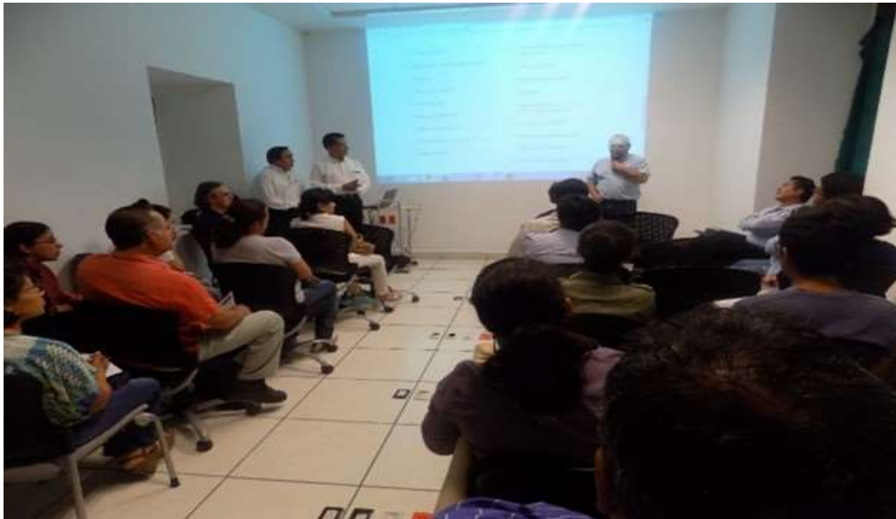
Presentación de los programas de la SE. de apoyo al sector empresarial, en las instalaciones de Canaco Oaxaca - Junio 2017