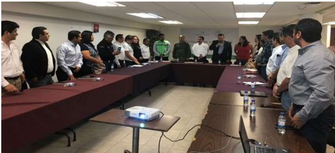
Instalación del Comité de Abasto Privado - Abril 2018

Para el año 2018, la instalación del comité de abasto se instaló el 23 de abril del 2018, con el objetivo de estar preparados ante una posible contingencia derivado de los cambios climáticos que se han venido presentado.