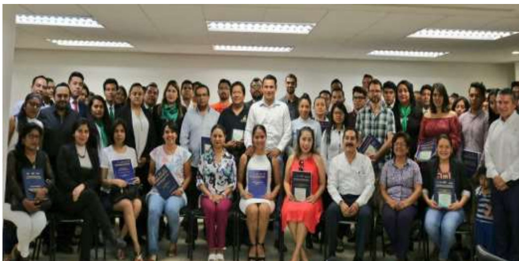
Centrales de Oaxaca. Oaxaca de Juárez - Marzo 2018

En atención a solicitud del Ayuntamiento de Huajuapán de León el 18 de abril del 2018 se realizó la "Jornada de Actualización Empresarial" dirigida a empresarios, emprendedores, estudiantes y sector