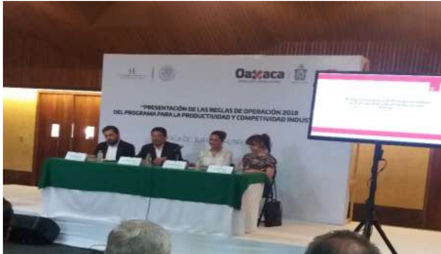
Presentación de las Reglas de Operación del PPCI -2018, Centro Cultural y de Convenciones de Oaxaca - Febrero 2018

En coordinación con la Secretaría de Economía del Gobierno del Estado se efectuó la presentación de las reglas de operación del PPCI, la cual tuvo como expositor al Director de la Unidad de Compras de la SE; este evento fue realizado en el Centro Cultural y de Convenciones de Oaxaca y asistieron 62 personas entre empresarios, representantes de organismos empresariales y directivos de dependencias del Gobierno del estado de Oaxaca.