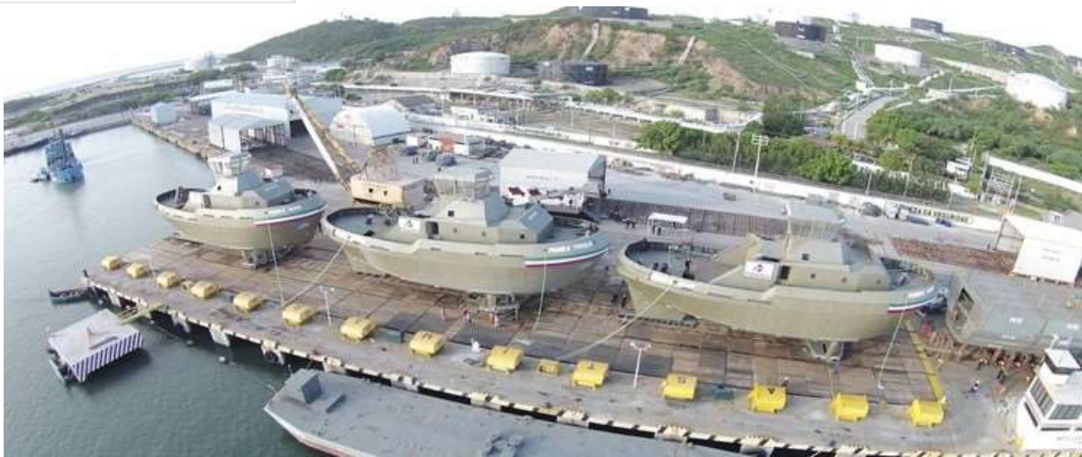
Astilleros del Puerto de Salina Cruz, utilizados por la empresa DEAMEN SHIPYARDS S.A DE C.V. para la fabricación de buques, al amparo de un programa de Promoción Sectorial (PROSEC).