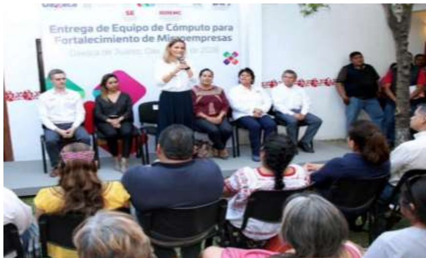
Entrega de equipos de TIC. Santa Lucía del Camino y Oaxaca de Juárez -. Marzo 2018