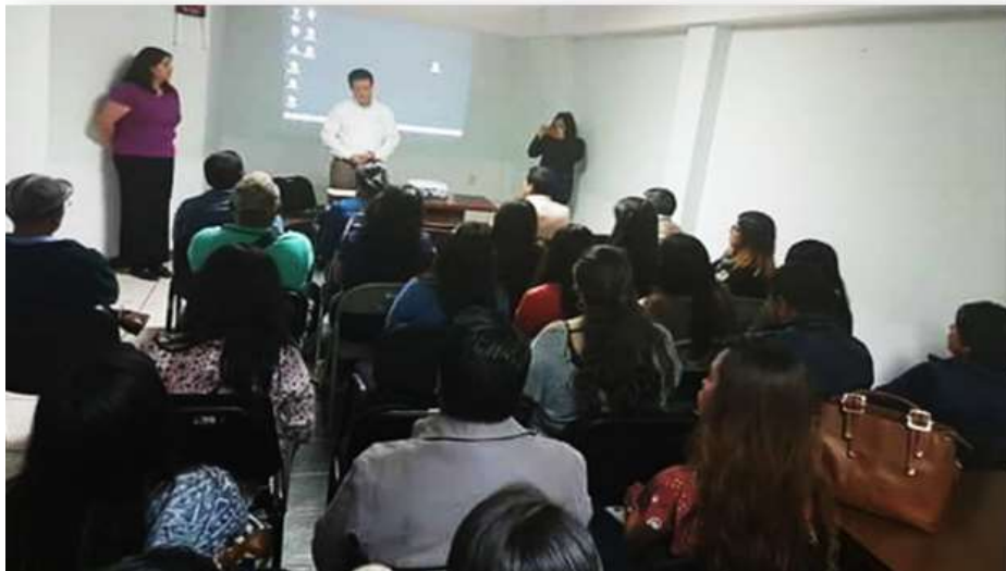
Taller de Signos distintivos - Abril 2017

Con el objetivo de promover y difundir entre los empresarios y emprendedores del estado, la importancia y los beneficios de registrar y/o patentar la Propiedad Intelectual, durante el periodo comprendido de enero a diciembre de 2017 y enero abril del 2018, esta Delegación Federal, en coordinación con la Oficina Regional Centro del Instituto Mexicano de la Propiedad Industrial realizó 19 talleres sobre el procedimiento de registro de signos distintivos (marcas, avisos comerciales) así como también 12 pláticas relacionadas al proceso para registro de patentes, modelos de utilidad y dibujos y diseños industriales, eventos en los cuales se contó con la participación de 616 interesados.