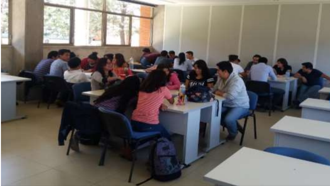
Taller para Emprendedores ( Simulador de Negocios ) realizado en las instalaciones de la Delegación Federal de la SE Oaxaca –Marzo 2018

En el 2018 le viene dando continuidad al fomento de la cultura emprendedora, así en el periodo enero - abril se realizaron 4 talleres en los que se capacitaron a 78 emprendedores y microempresarios de los municipios de la entidad, mismos que se llevaron a cabo en coordinación con instituciones educativas de niveles superior y medio superior de Oaxaca, Universidad La Salle, Programa Punto México Conectado de la SCT Oaxaca, agrupación de artesanos de Santa María Atzompa y grupo de emprendedores de ecoturismo de la Mixteca.