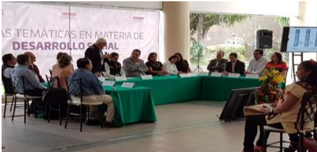
Inauguración y Definición de Trabajo Conjunto en Mesas Temáticas Sectoriales de Desarrollo Social organizadas por la Secretaría de Desarrollo Social del Gobierno de Oaxaca y la SEDESOL Federal. Oaxaca de Juárez - Marzo 2017