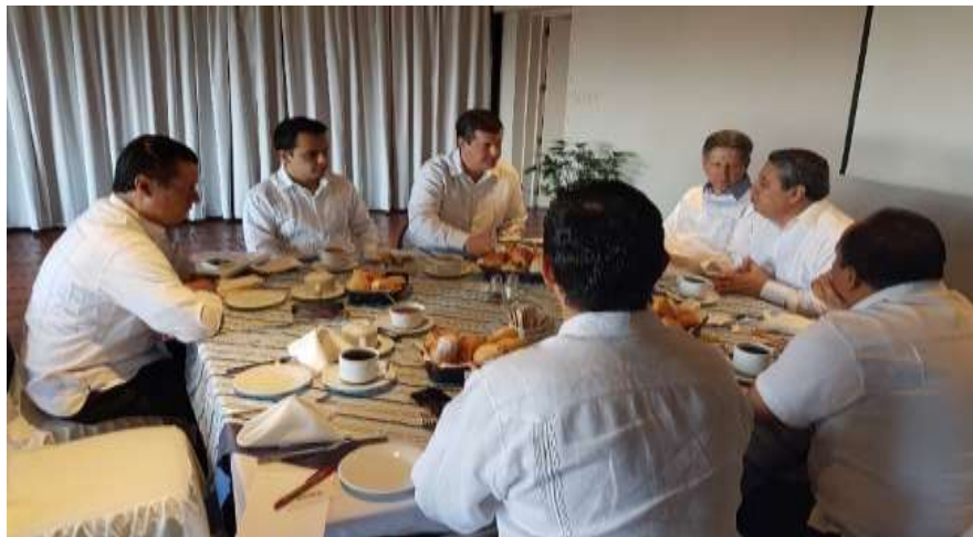
Reunión de trabajo con el Subsecretario Rogelio Garza de la SE-MEXICO para definir estrategias conjuntas de trabajo. Oaxaca de Juárez - Julio 2017

En 2017 se tuvieron reuniones de trabajo con el Instituto Nacional del Emprendedor con el cual se asistió también a diversos eventos de fomento del emprendimiento realizados por instancias del Gobierno Estatal, ayuntamientos e instituciones educativas de nivel superior. Con la Secretaría de Turismo del Gobierno Estatal se participó en la difusión de programas de apoyo productivo y crediticio para Mipymes turísticas en exposiciones de productos oaxaqueños en Oaxaca de Juárez.