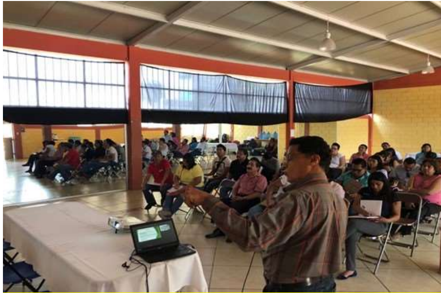
Difusión del SNIIM con empresarios del Municipio de Huajuapán de León - Abril 2018