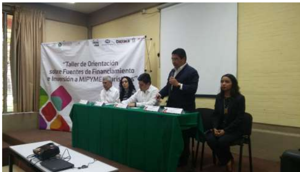
Taller de Financiamiento realizado conjuntamente con SECTUR y NAFIN- Agosto 2017