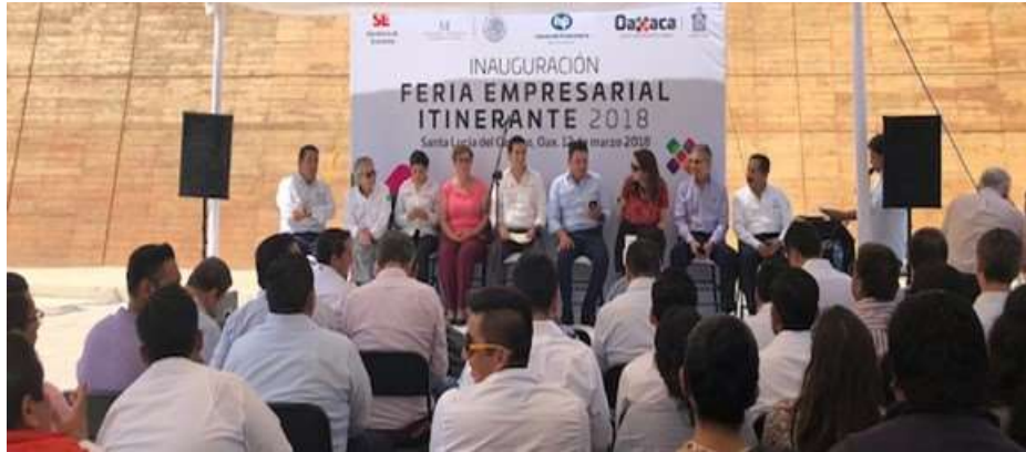
Inauguración de la Feria Empresarial Itinerante NAFIN-Oaxaca – Marzo 2018