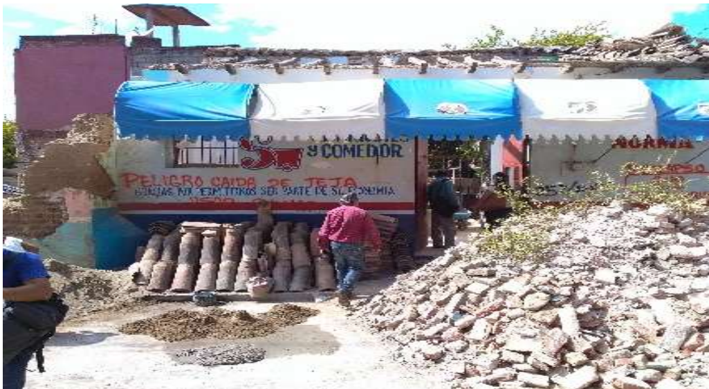
Supervisión de negocios siniestrados por sismos de septiembre de 2017 en la Región del Istmo

A petición del INADEM, en enero del 2018 la Delegación Federal participó con la Secretaría de Economía Estatal, autoridades municipales y Mipymes en la supervisión y elaboración de actas de situación actual de obras y acciones de 10 proyectos del Fondo Nacional Emprendedor de 2015 y 2016, relacionados con la dotación de energía solar para comunidades rezagadas; capacitación de empresas afiliadas a Canacintra Oaxaca, mejoría del módulo SARE de Oaxaca de Juárez; equipamiento de hoteles de empresarias de Oaxaca de Juárez; infraestructura y equipo para dos empresas mezcaleras; equipamiento de 10 empresas turísticas en Puerto Escondido; infraestructura y equipo para una productora de alimentos empacados en Tlalixtac de Cabrera y para una productora de cerveza artesanal en Oaxaca de Juárez; y un proyecto para capacitación administrativa para Mipymes ubicadas en el interior de la Entidad.