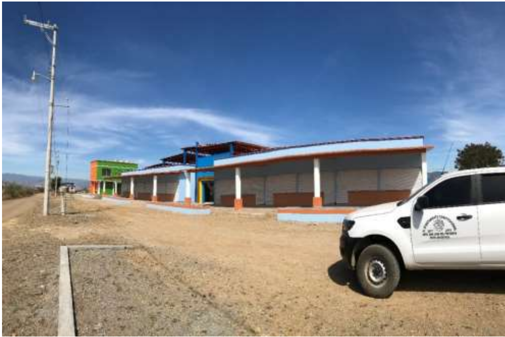
Mercado de San José del Progreso. En proceso de terminación y entrega recepción a la autoridad municipal - Diciembre 2017

En diciembre de 2017 se aprobaron en la convocatoria 1.8. Innova tu Central de Abasto y Mercado recursos para dos mercados públicos por un monto de 15.9 millones de pesos para beneficio de 108 y 102 locatarios cuya conclusión se espera para el 2018.