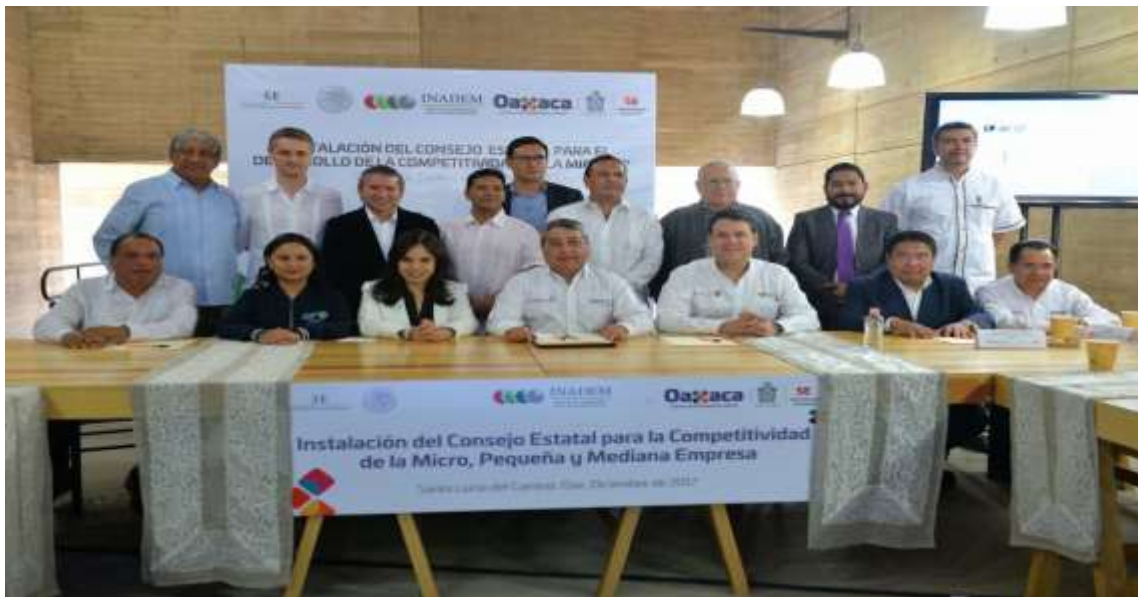
Instalación del Consejo Estatal para la Competitividad de la Micro, Pequeña y Mediana Empresa de Oaxaca. Santa Lucía del Camino - Diciembre 2017