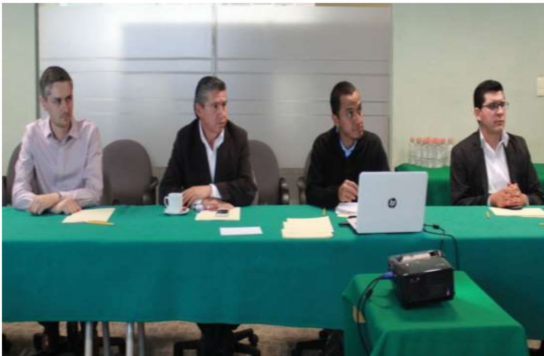
Primera Reunión Ordinaria del Consejo Estatal para la Competitividad de Mipymes en el estado de Oaxaca. Ciudad Administrativa. Secretaría de Economía del Gobierno del Estado de Oaxaca. Tlaxiáctac de Cabrera - Marzo 2018

Sectores Futuro: Energías Renovables e Industria Textil.