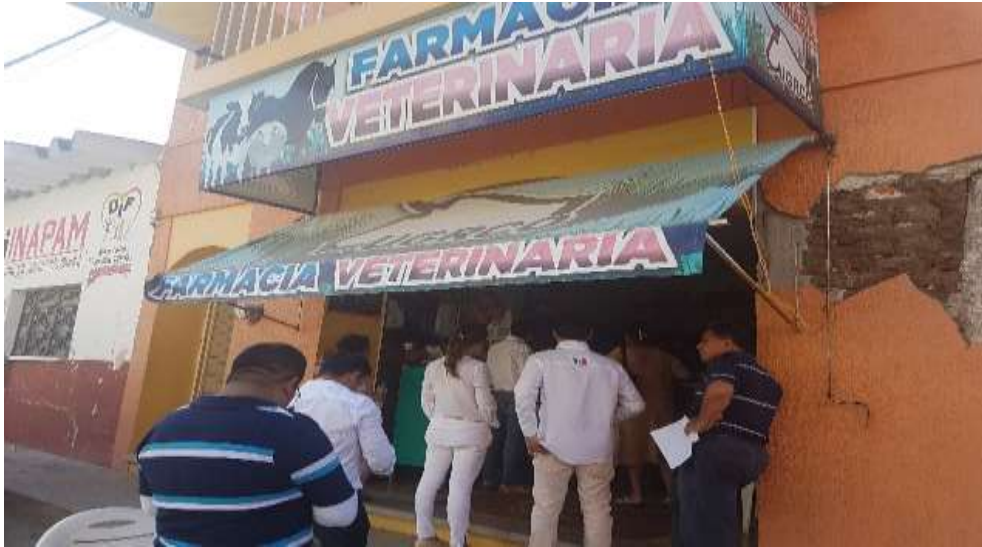
Supervisión de negocios siniestrados por sismos en febrero de 2018 en la Región de la Costa

Domingo Tehuantepec y Salina Cruz, en la Región del Istmo; así mismo, en la supervisión a negocios de municipios siniestrados por el sismo ocurrido en febrero de 2018 en la Región de la Costa. Esta última actividad fue realizada conjuntamente con directivos del INADEM.