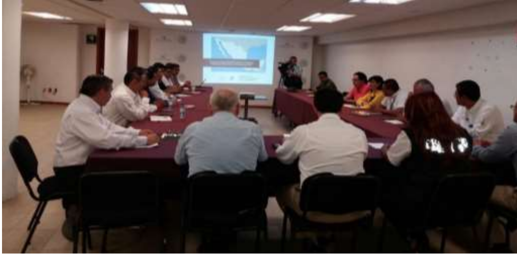
Instalación del Comité de Abasto Privado - Abril 2017

La instalación del comité de abasto también sirvió para fortalecer el compromiso de los participantes y que a su vez se pudiera compartir información útil para la población. Además, asumiendo esta responsabilidad de formulación y conducción de las políticas de comercio interior y de abasto en situaciones de emergencia, en el estado de Oaxaca se garantiza el restablecimiento suficiente y oportuno del abasto privado de los productos a la población ubicada en las zonas potencialmente afectadas, para lo que fue necesario actualizar en el Sistema de Información de Comercio Interior y Abasto.