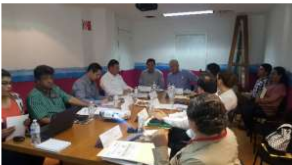
Reunión con el Gabinete Sectorial de Economía. Marzo 2017.