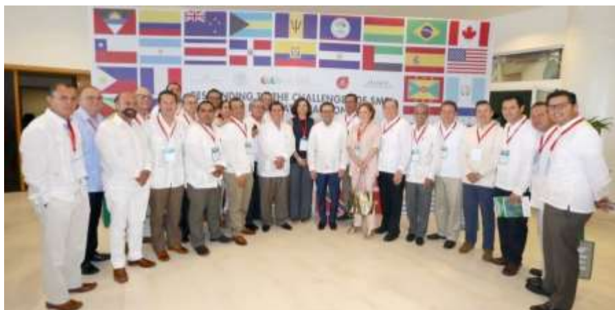
Reunión de Trabajo en Beneficio de las MIPYMES.