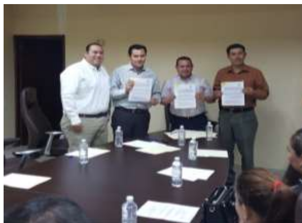
Firma de Convenio con Ayuntamiento de Mocorito-SE.