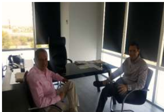
Reunión con Alcalde del Rosario. Mayo 2017.