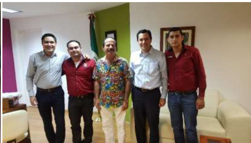
Reunión Ayuntamiento de Angostura. Abril 2017.