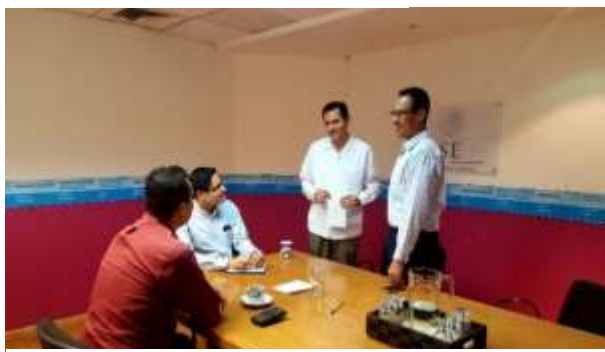
Reunión con Alcalde de Concordia. Febrero 2017.