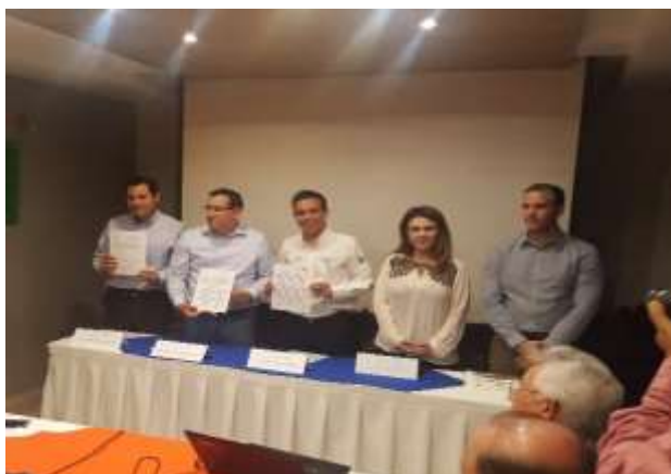
Convenio IMPI-CANIRAC Ahome. Febrero 2017.