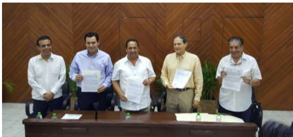
Firma de Convenio de Colaboración con el Ayuntamiento de Mazatlán. Junio 2017.