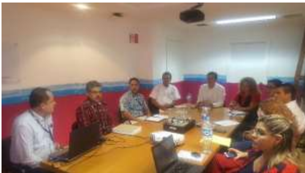
Reunión con INEGI. Febrero-2017.

Los titulares de las delegaciones federales en Sinaloa, como son la Secretaría de Economía, la Procuraduría Federal del Consumidor, Proméxico, Servicio Geológico Mexicano y el Fideicomiso de Fomento Minero, planearon estrategias y desarrollaron actividades para impulsar las políticas públicas en materia económica, así como la atención de los sectores empresariales, mineros y la defensa de la sociedad en general.