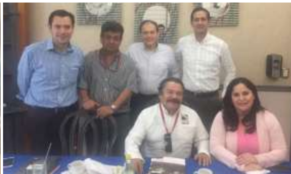
Reunión con el Sector Coordinado. Febrero 2017.