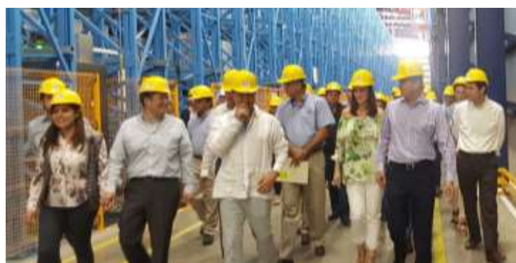
Recorrido en la Nueva Planta Herdez, Ahome. Marzo 2017