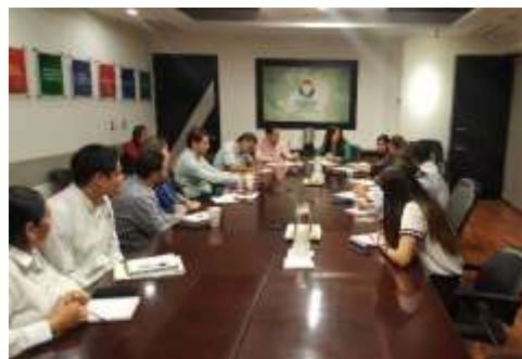
Reunión trabajo con SEDECO y con la Subsecretaría de Promoción Estatal. Enero 2017.