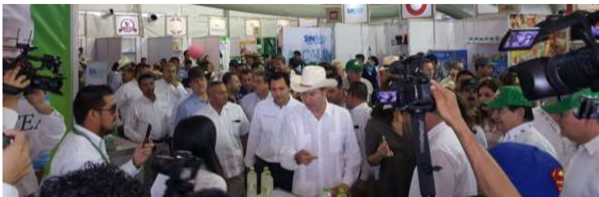
Expoagro Sinaloa. Abril 2017.