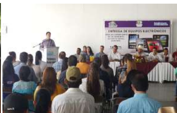
Entrega de Apoyos INADEM en el Municipio de CHOIX.