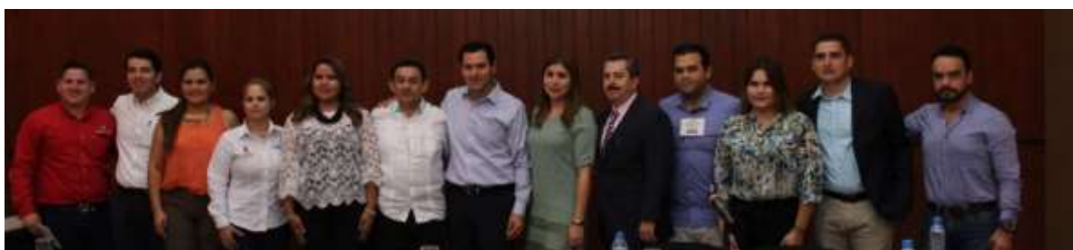
Reunión con la Red Estatal de Incubadoras y Diputados Locales. Junio 2017.