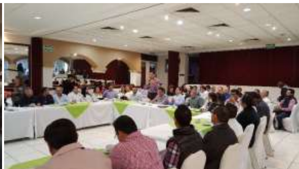
Reunión con Empresarios de Salvador Alvarado. Febrero