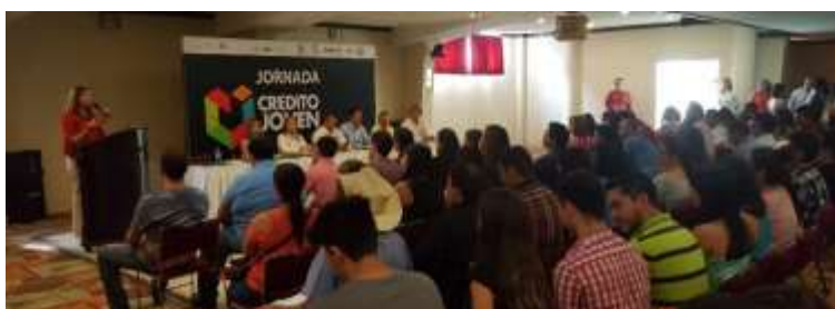
Crédito Joven en Ahome. Agosto 2017.