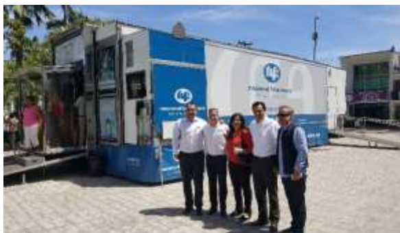
Reunión con Nacional Financiera, Crédito Joven. Marzo