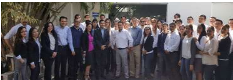
Entrega de apoyos a Univale. Enero 2017.

Los resultados del 2017 rompieron cualquier referencia en materia de apoyo a empresarios y emprendedores en el estado de Sinaloa. Con más de 3,500 millones de pesos en financiamientos y 225 millones de pesos provenientes del INADEM se aceleró el crecimiento de las empresas en nuestro Estado.