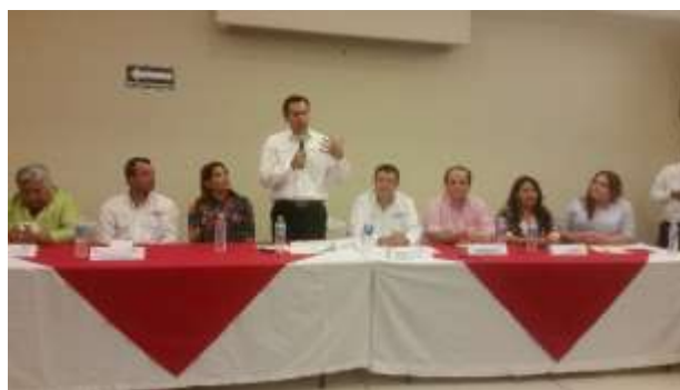
Gira de Trabajo en Ahome. Agosto 2017.