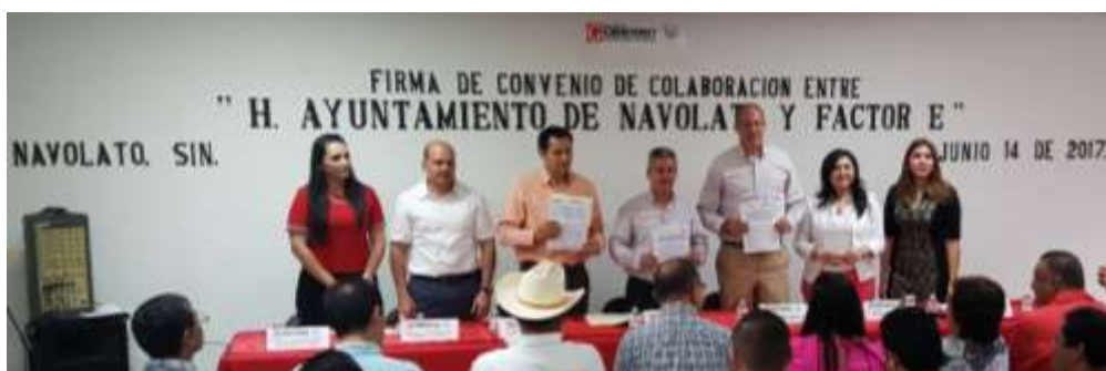
Firma de Convenio de Colaboración con el Ayuntamiento de Navolato. Junio 2017