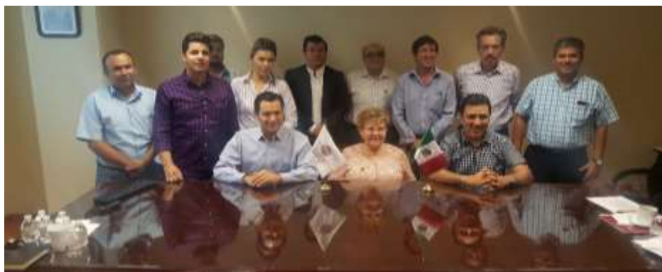
Firma de Convenio de Colaboración con el Ayuntamiento de Mazatlán. Junio 2017.