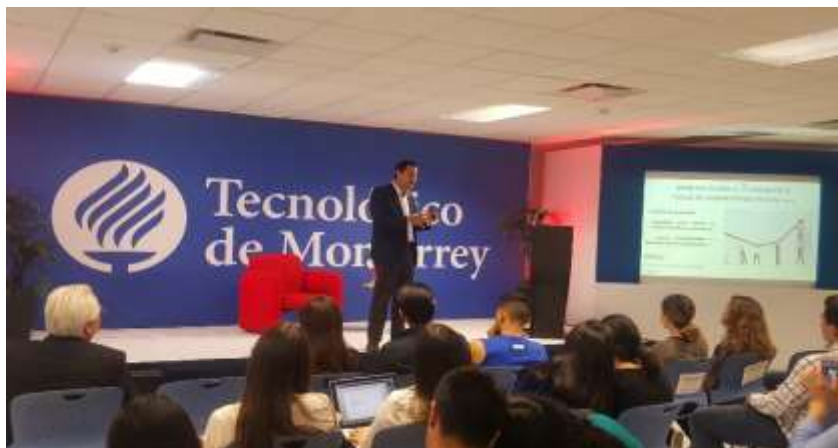
Firma de Convenio de Colaboración con el Ayuntamiento de Mazatlán. Junio 2017.