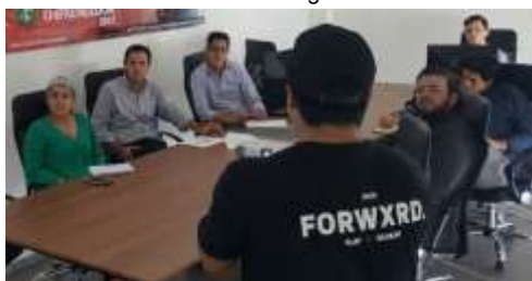
Jóvenes del Sector TI