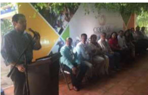
Comité de Planeación Municipal Navolato. Abril 2017.