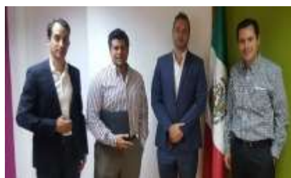
Monterra Energy. Marzo 2017.