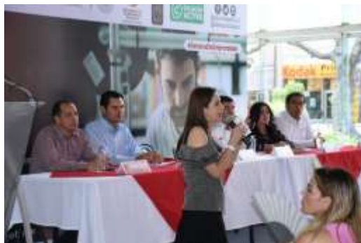
Presentación de la SNE en Sinaloa. Agosto 2017