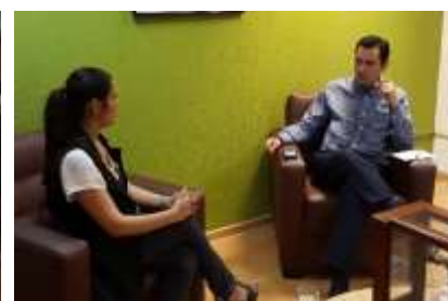
CANIRAC-Culiacan. Marzo 2017.