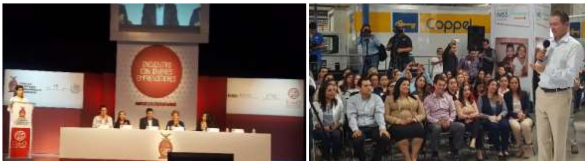
Encuentro con Jóvenes Emprendedores UdeO. Enero 2017. Lanzamiento del Programa de Guarderías del IMSS. Febrero

El número de eventos en los que se representó a la Secretaría de Economía ante los diferentes organismos es inmenso, siempre enmarcando las políticas públicas de inclusión económica que la Secretaría ha manifestado y ponderando la importancia de los programas de apoyo para empresarios.