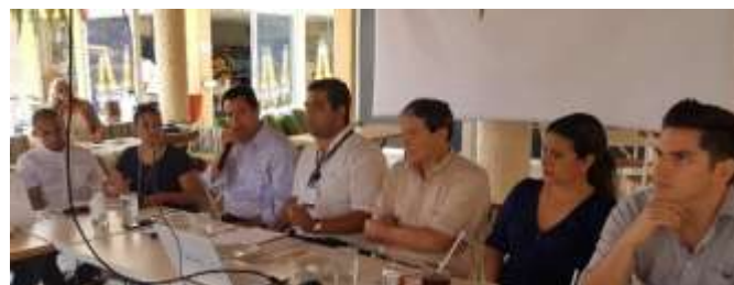
Consejo de Empresarios Jóvenes de Mazatlán. Julio 2017