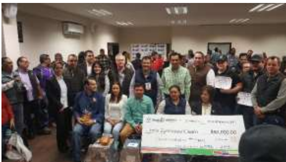
Entrega de Apoyos del INADEM en Ahome. Enero 2017.