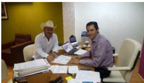
Reunión con Alcalde de Choix. Mayo 2017.