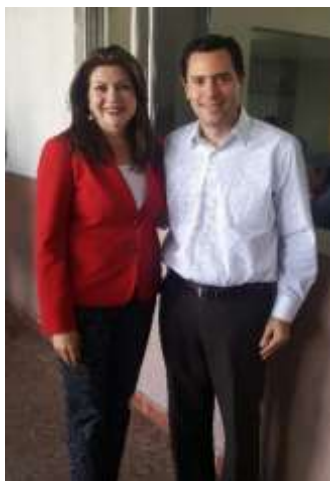
Reunión de Trabajo con Alcaldesa de Guasave, Diana Armenta. Enero 2017

La coordinación entre los tres niveles de gobierno siempre será imperante en cualquier administración. Durante 2017 se realizó un trabajo conjunto para generar el desarrollo económico de la región. Se realizaron un sinnúmero de eventos y reuniones de colaboración con el Gobierno del Estado de Sinaloa, siempre representado por la Secretaría de Desarrollo Económico (SEDECO) y con los presidentes de los 18 municipios del estado.