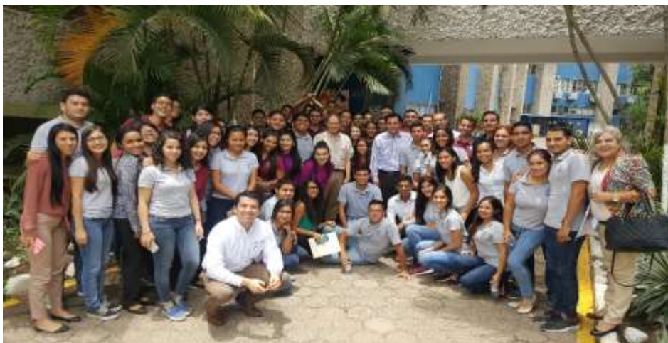
Conferencia con Universidad Politécnica de Sinaloa. Junio 2017.