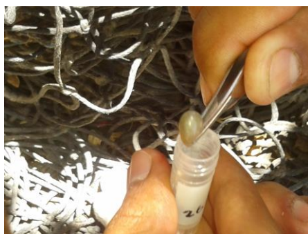
Fig. 1 a) Garrapata en su etapa libre.

Dentro de este grupo de enfermedades se tiene como una prioridad de atención en salud pública en México a la Fiebre Manchada de las Montañas Rocosas FMMR ( Rickettsia rickettsii ) que se transmite al ser humano por la picadura o contacto con garrapatas (principalmente la garrapata café del perro); esta enfermedad se caracteriza por presentar inicialmente síntomas como: fiebre ( >38.9 °C), cefalea (dolor de cabeza), mialgias (dolor muscular), artralgias (dolor articular), dolor abdominal, vómito y diarrea; presentando posteriormente exantema (manchas en la piel) en las zonas distales de miembros superiores (palmas, muñecas) e inferiores (plantas y tobillos) el cual se distribuye centrípetamente (hacia la línea media del cuerpo) lo cual se asocia a la complicación del cuadro llegando ocasionalmente a dejar secuelas permanentes en órganos diversos (cerebro, corazón, riñones, miembros) e incluso causar la muerte. (Fig. 1 b).