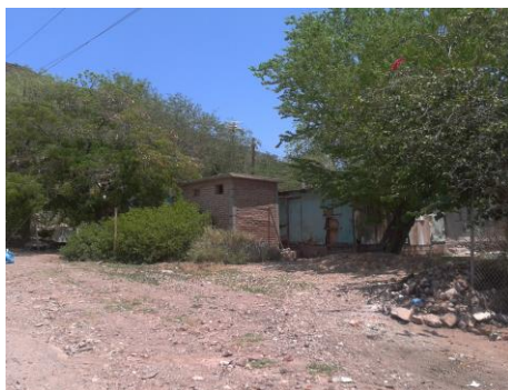
Fig. 6 Vivienda con saneamiento básico deficiente.

Las mayores densidades de este ectoparásito se observan en áreas donde existen condiciones micro ambientales para su reproducción; por ejemplo: acúmulos de basura en las calles y en los patios, lotes baldíos con basura y maleza, presencia de perros callejeros, calles sin pavimentar o viviendas con maleza (Fig. 6).