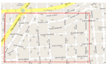
Fig. 5 Delimitación de colonia para barrido.