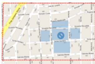
Figura 4. Delimitación de un área para bloqueo.