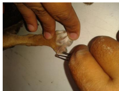
Fig. 2 a) Recolección de garrapatas del dorso del animal. Fig. 2 b) Recolección de garrapatas en los espacios interdigitales.