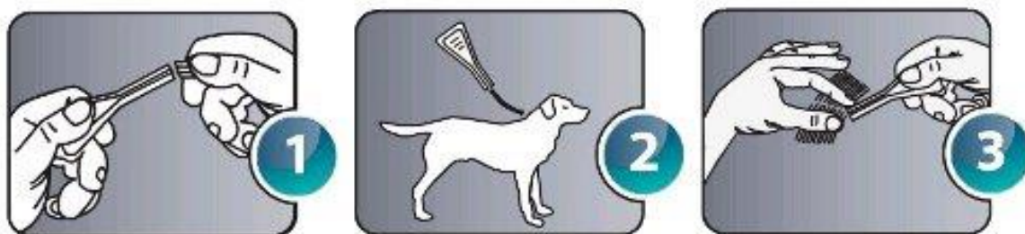
Figura 8. Aplicación de pipeta.