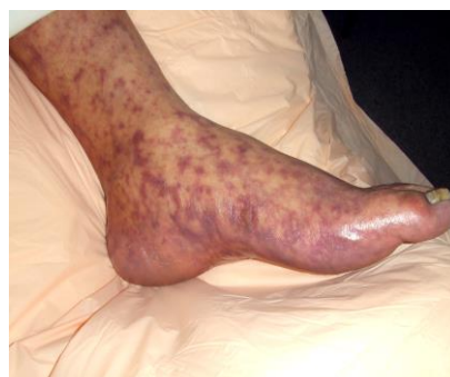
Fig. 1 b) síntomas típicos de un enfermo de FMMR.

Otras enfermedades menos letales dentro de este grupo son el Tifo epidémico o exantemático ( Rickettsia prowasekii ) transmitido al ser humano por el piojo corporal ( Pediculus humanus corporis ) y el Tifo murino o endémico ( Rickettsia typhi ) que se transmite al humano por pulgas de roedores y felinos ( Xenopsyla cheopis ).