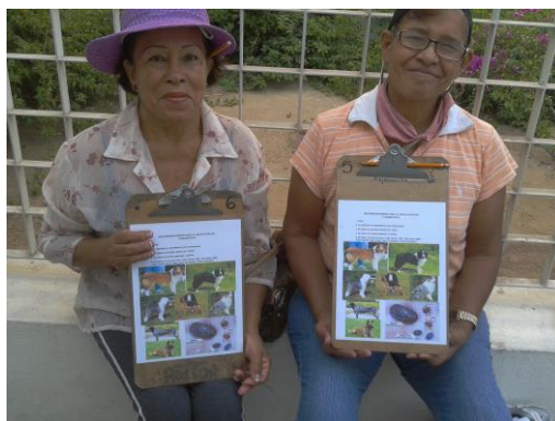
Fig. 3 Actividades de promoción a la salud.