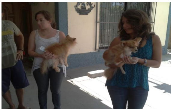
Fig. 7 Tenencia responsable de perros.

Otros factores condicionantes para la presencia de garrapatas es la falta de una cultura responsable de los perros (Fig. 7).