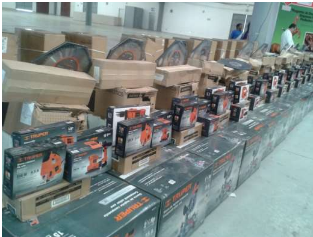
Foto. Equipo otorgado a los beneficiarios de los proyectos aprobados.