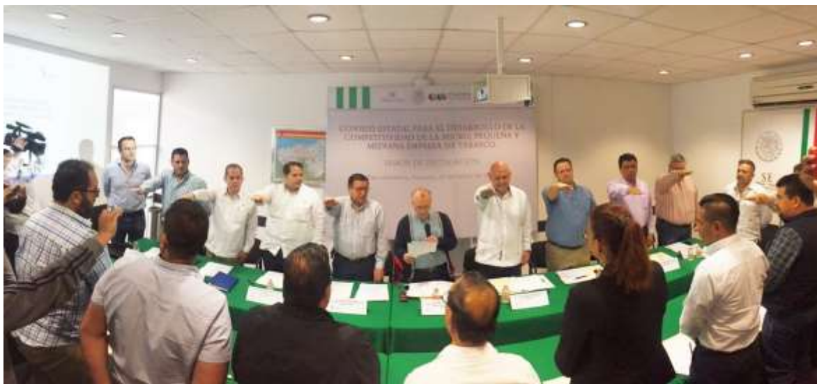
Foto. Toma de protesta de Consejeros en la Sesión de instalación del Consejo.