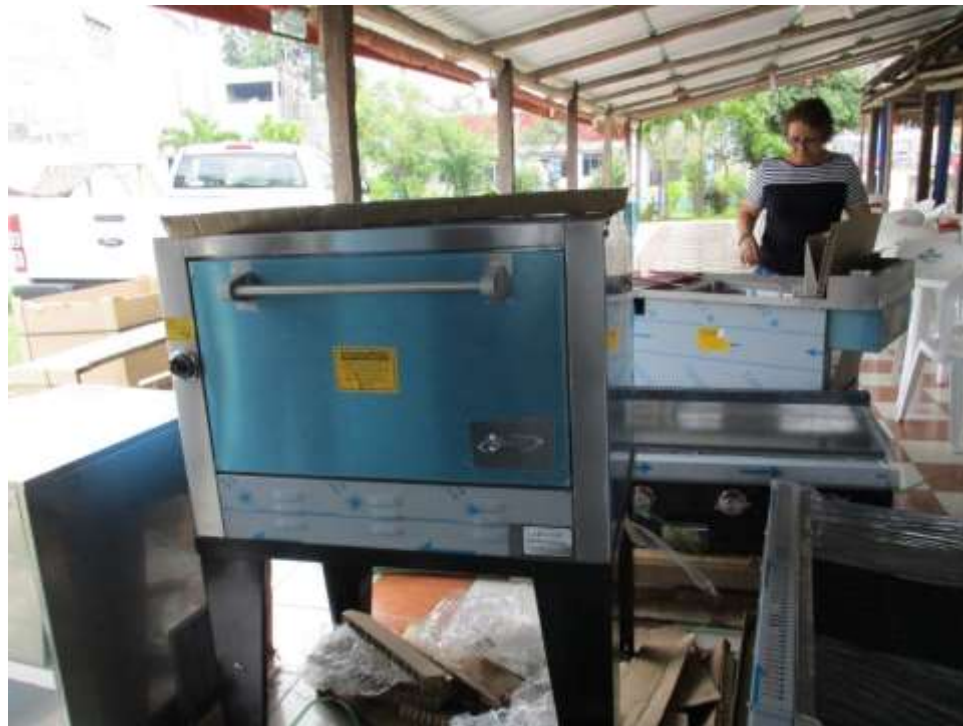
Foto. Equipo otorgado a los beneficiarios de los proyectos aprobados.

En cuanto al Programa de Financiamiento para la Reactivación Económica diseñado para los estados de Tabasco y Campeche, se colocaron $132,826,000.00 en beneficio de 115 empresas tabasqueñas, que sumados a los $105,204,000.00 otorgados en 2016 a 94 empresarios, arroja un total de $238,030,000.00 en beneficio de 209 empresas, superándose la bolsa considerada para Tabasco que inicialmente contaba con $225,000,000.00 para el programa.