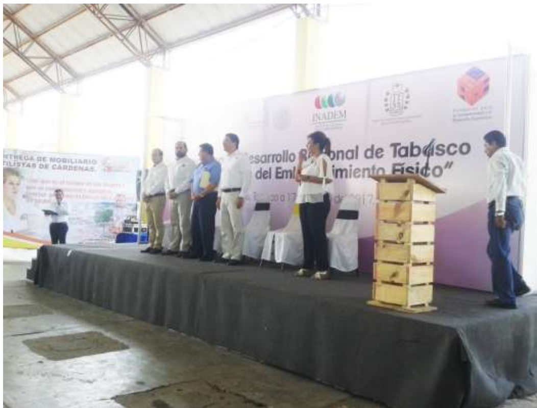
Foto. Evento de entrega a los beneficiarios de los proyectos aprobados.

Por otra parte, es importante mencionar que en el tema de la competitividad, se organizó y convocó a nivel local la participación de empresarios, instituciones y sector académico en 4 sesiones de los Diálogos con el sector privado en materia de competitividad, realizados en la Ciudad de México y transmitidos vía streaming en las oficinas de la Delegación Federal en Tabasco, donde los principales actores del Gobierno Federal expusieron las acciones relevantes que se han realizado para disminuir el impacto de algunos inhibidores que afectan la competitividad y productividad en las empresas. Se tuvo una asistencia acumulada de 100 personas.