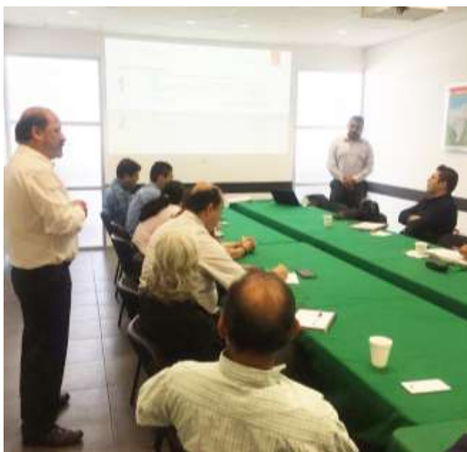
Foto. Plática PPCI llevada a cabo de la Delegación de Economía.

Durante el periodo enero-abril 2018, se impartió un taller sobre la convocatoria de este programa, siendo otorgado por personal adscrito al área normativa y se realizó una visita por dicha área a empresas interesadas en este programa.