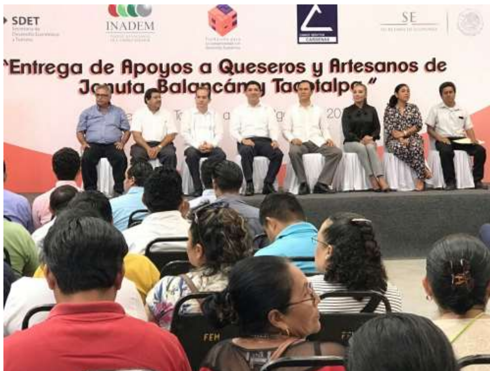
Foto. Evento de entrega a los beneficiarios de los proyectos aprobados.