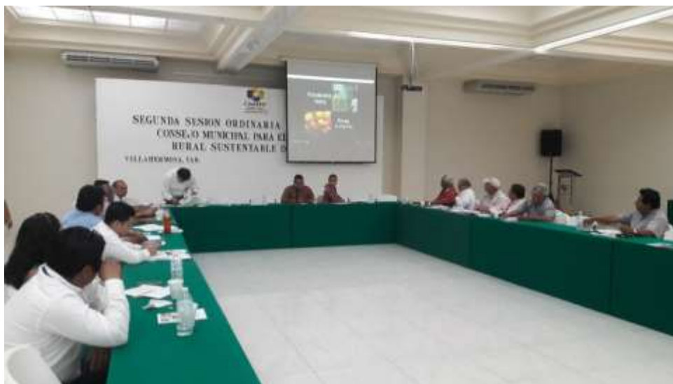
Foto. Plática del SNIIM con productores, en el marco del Consejo de Desarrollo Rural Sustentable del municipio del Centro