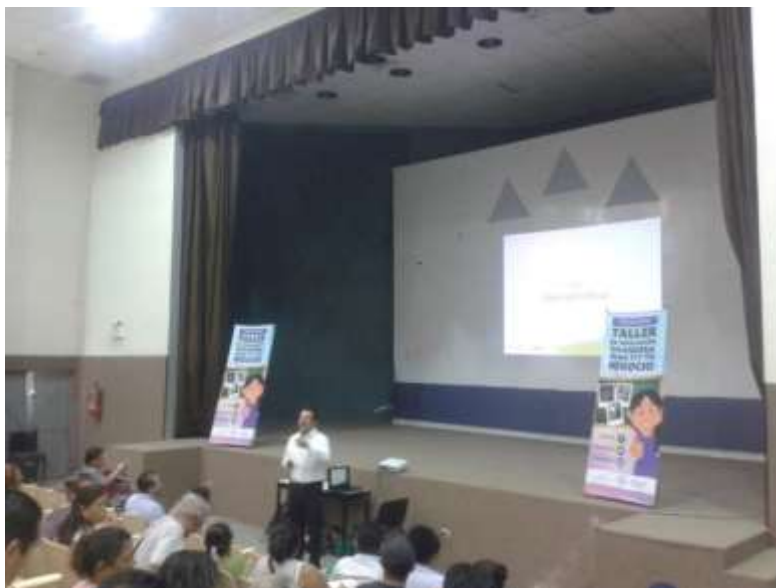
Foto. Taller PRONAFIM otorgado por Instituciones Financieras.