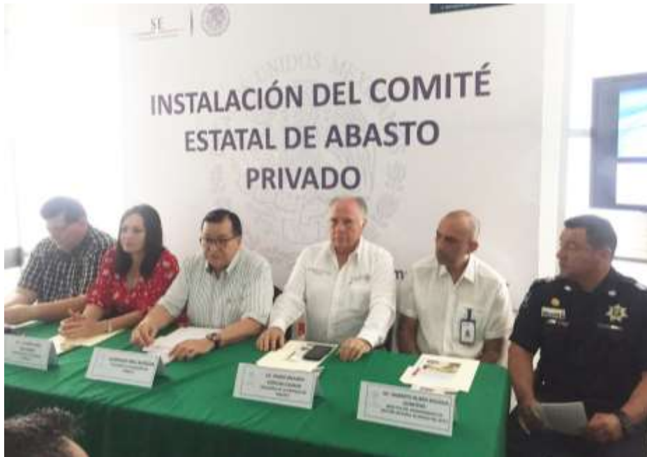
Foto. Instalación del Comité de Abasto 2018.

Para el ejercicio 2018, la instalación del Comité Estatal de Abasto se llevó a cabo el 26 de abril de 2018 en las instalaciones de la Secretaría de Economía, delegación Tabasco; con una asistencia de 26 representantes de la iniciativa privada, además de contar con la presencia y participación de autoridades federales y estatales que convergen en el tema de la distribución y el abasto privado.