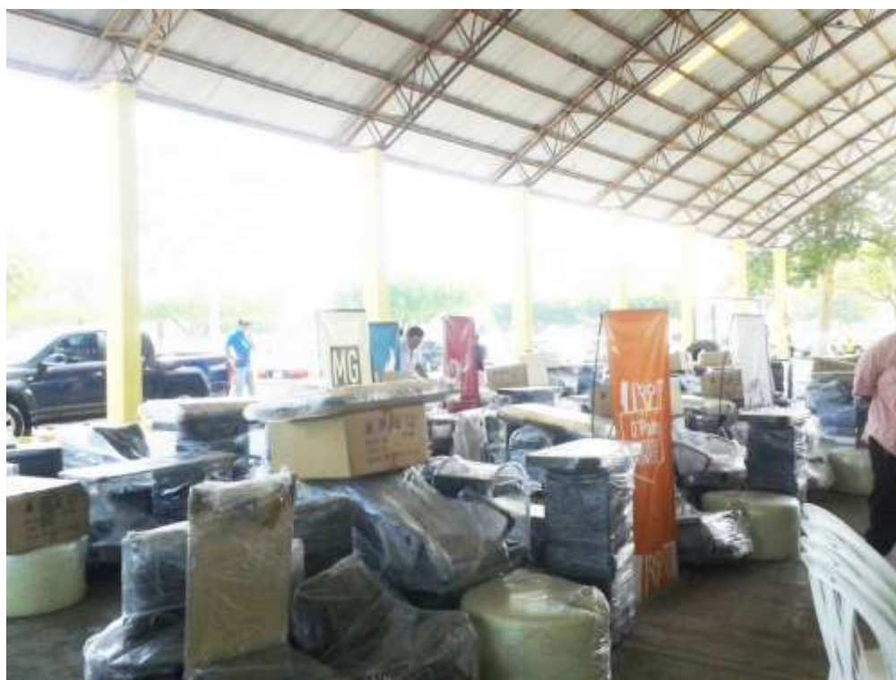
Foto. Equipo otorgado a los beneficiarios de los proyectos aprobados.