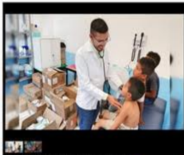
9 de Agosto de 2018 a las 17:52:00 / Por Redacción / 90 grados