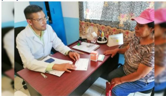
Autor: Redacción / UrbisTV | Publicado: 9 de Agosto de 2018 a las 18:25:00