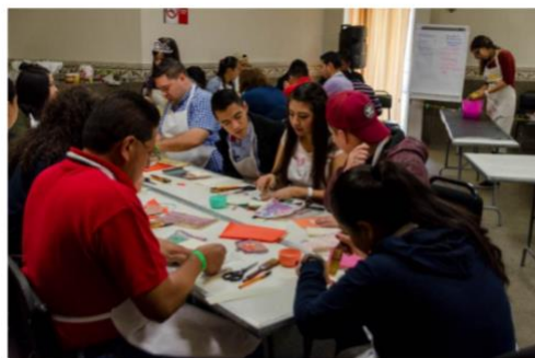
Antes de comenzar el ciclo los tutores reciben capacitación

CAMPECHE (6/ago/2018). El Consejo Nacional de Fomento Educativo (Conafe) reforzará el lenguaje, la comunicación y el pensamiento matemático a través de sus programas para el nuevo ciclo escolar 2018-2019, previa capacitación a los jóvenes que dan sus servicios como tutores a la población estudiantil.