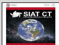
Enlace Manual SIAT-CT SEGOB