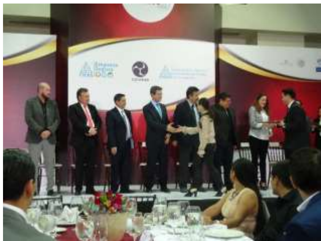
Participación de Delegación Federal de SE en evento MexicanShoes Quality