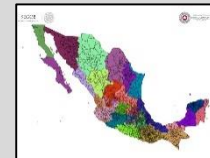
REGIONALIZACIÓN División de tu estado

Siguiente alerta será emitida: Boletín único.