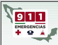
En caso de emergencia marca al 911