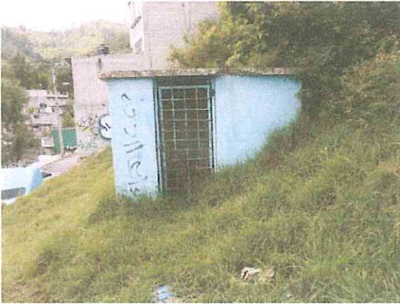
Foto 9. Zona de área verde con declive.

El cuerpo del edificio no presenta desplomes ni deformaciones visualmente apreciables. Los muros, las techumbres ligeras, los firmes y la estructura en su conjunto no presentan ninguna afectación estructural considerable ocasionada por el sismo. Derivado de lo anterior, se dictamina que EL INMUEBLE DEL CENTRO COMUNITARIO INDEPENDENCIA, ES UNA EDIFICACIÓN QUE REQUIERE DE MANTENIMIENTO MAYOR GENERAL PARA QUE SEA HABITABLE.