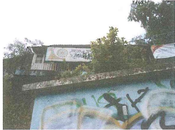
Foto 10. Fachada de aulas de lámina.