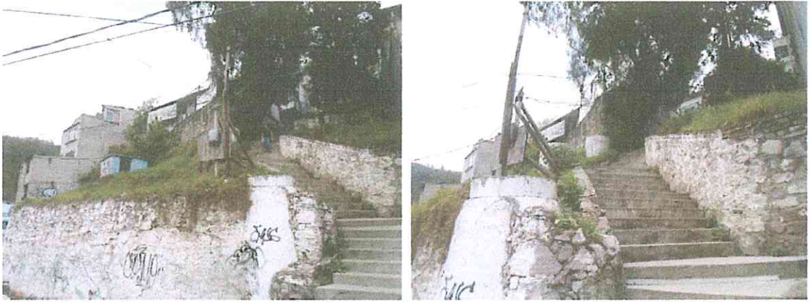
Foto 11 y 12. Escalinata de acceso al Centro Comunitario.