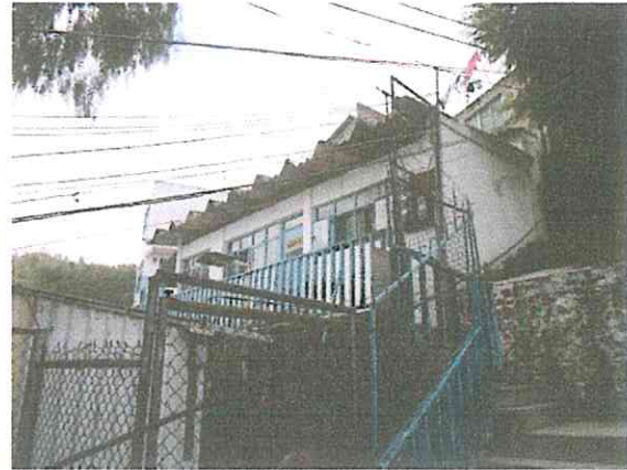
Foto 1. Fachada desde la calle San Miguel, donde se aprecia el declive del terreno.