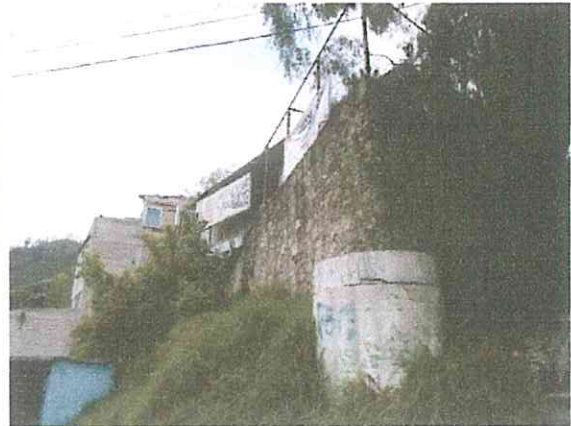
Foto 7 y 8. Muros de contención con algunas fisuras.