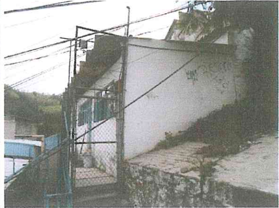
Foto 3. Pasillo de circulación hacia las aulas de lámina.