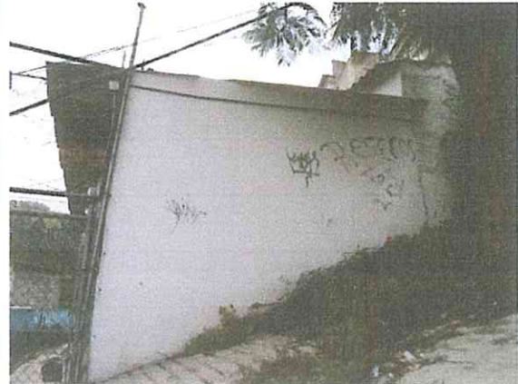
Foto 5 y 6. Fachada interior y exterior del cuerpo de mampostería con techumbre de asbesto.