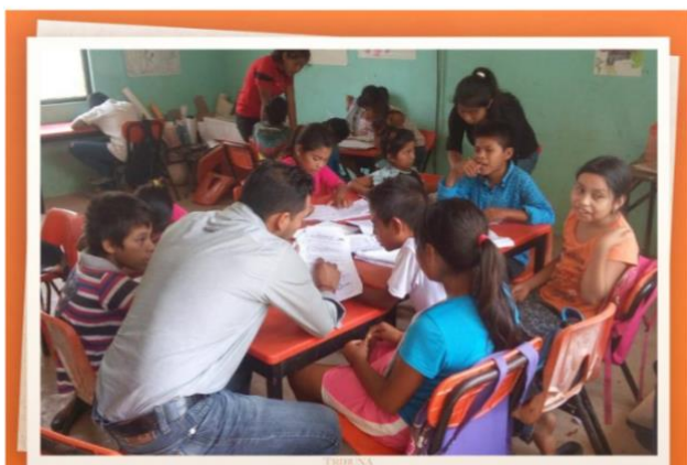
A unas semanas de concluir el ciclo escolar 2017-2018, personal del Consejo Nacional de Fomento Educativo