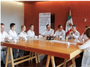
El Gobernador del Estado se reunió con los representantes de ambos organismos quienes expusieron la estrategia educativa del Modelo ABCD que impulsa el Gobierno Federal.

OAXACA (6/jun/2018). El Gobernador del Estado sostuvo una reunión con el Representante del Banco Interamericano de Desarrollo (BID) en México, Tomás Bermúdez y el Director General del Consejo Nacional de Fomento Educativo (Conafe), quienes anunciaron acciones para respaldar y fortalecer la educación rural en la entidad, a través del Modelo de Aprendizaje Basado en la Colaboración y el Diálogo (Modelo ABCD) que realiza el Gobierno Federal.