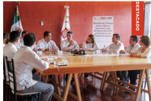
El Director General del Conafe, consideró que el Modelo ABCD es un programa exitoso que respalda y fortalece la educación de niñas y niños en zonas rurales.

Junio 7, 2018 Escrito por Melissa RUIZ Publicado en Política Estatal