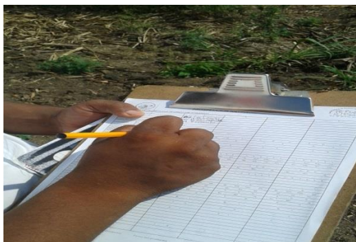
Figura 1. Llenado del formato de prospección antiacridiana, en el estado de Oaxaca.

Al llevar a cabo las acciones de la campaña en 10 Entidades Federativas, se protegió indirectamente la superficie establecida con cultivos de agave, calabaza, caña de azúcar, cártamo, cítricos, frijol, frutales, girasol, limón, maíz, mango, naranja, palma de aceite, piña, sorgo, soya, teca y tomate de cáscara, principalmente, pues la langosta es un insecto polífago que puede llegar a alimentarse de hasta 400 especies vegetales. Mediante la detección y control oportuno, la plaga en cuestión no representó riesgo de daño o pérdidas económicas, que pueden llegar a ser de hasta el 100% de los cultivos susceptibles (Figura 1 y 2).