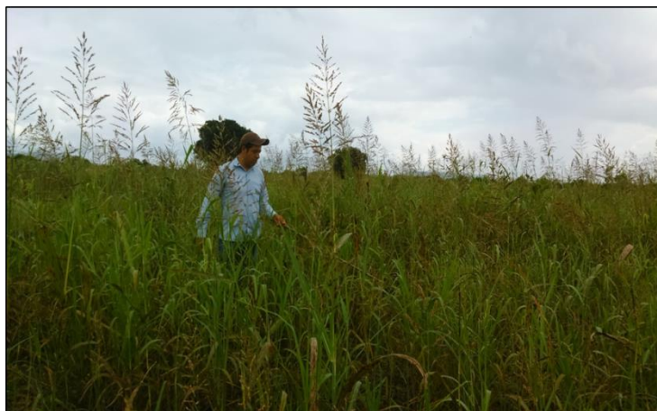
Figura 2 y 3. Áreas de Exploración localizadas en el Municipio de San Felipe Orizatlán, Hidalgo.

Responsable de elaboración: Judith Cervantes Reyes.