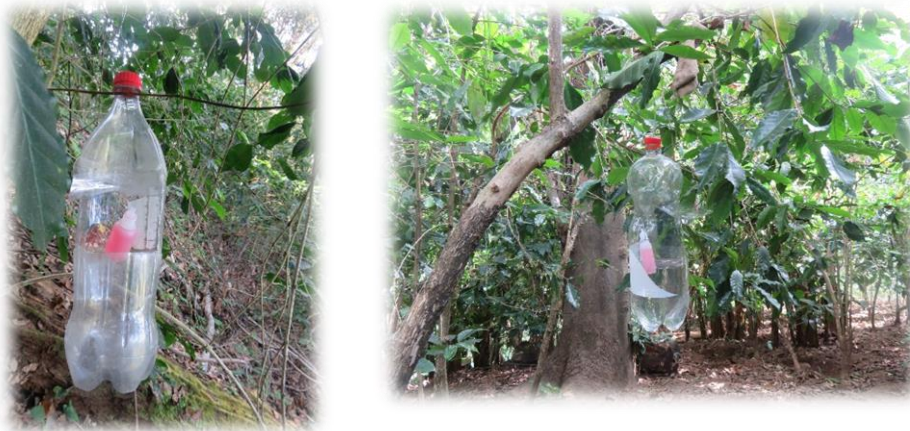
Figura 3. Sitios atendidos con actividades de trampeo en el mes de enero de 2018, en los estados de Chiapas, Colima, Guerrero, Hidalgo, Nayarit, Oaxaca y San Luis Potosí.

Las acciones implementadas en el 2017 coadyuvaron a mantener los niveles de infestación de la broca del café registrando un promedio nacional de 2.1%. En lo que se refiere a los predios atendidos en dicho ejercicio fiscal, en 22,858 predios (68%) se registraron niveles de infestación entre 0 y 2%; 8,622 predios (25%) con niveles de infestación entre el 2.1% y 5% y sólo en el 7% de los predios muestreados se superó el 5% de infestación. Por lo que la instalación oportuna de trampas y el mantenimiento de las mismas por parte de los productores en el ciclo productivo 2018-2019, coadyuvará al evitar el incremento de la broca del café en los sitios atendidos.